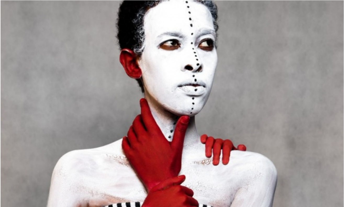
Aida Muluneh, 99 Series, 2012. The Divine Comedy. Heaven, Purgatory and Hell Revisited by Contemporary African Artists, catalogo a cura Mara Ambrožič, Simon Njami, Kerber Verlag Bielefeld, 2014

(la lingua etiopica) si combinano con le preghiere di perdono. Ho scelto di unire questi elementi perché per me essi incorporano sia il mio background culturale sia qualcosa di digitale, come la fotografia con un elemento analogico, come il mio disegno al tratto su carta fotografica. Più nello specifico, i disegni al tratto che ho fatto negli ultimi due anni sono in un certo senso ispirati ai tradizionali rotoli sacri di pergamena, in pratica costituiti da un lungo e sottile pezzo di pelle tagliato in base all'altezza della persona. Sul pezzo di pelle è disegnata una preghiera perché protegga o tenga lontana la malattia, insieme a versi tratti dalla Bibbia. Si tratta di un'antica forma di testo sacro, non accettata dalla Chiesa perché considerata stregoneria; tuttavia, i vari simboli provengono direttamente dalla Chiesa. Pertanto, anche la mia stessa fonte d'ispirazione proviene da queste forme che trovo di grande fascino. A.M.