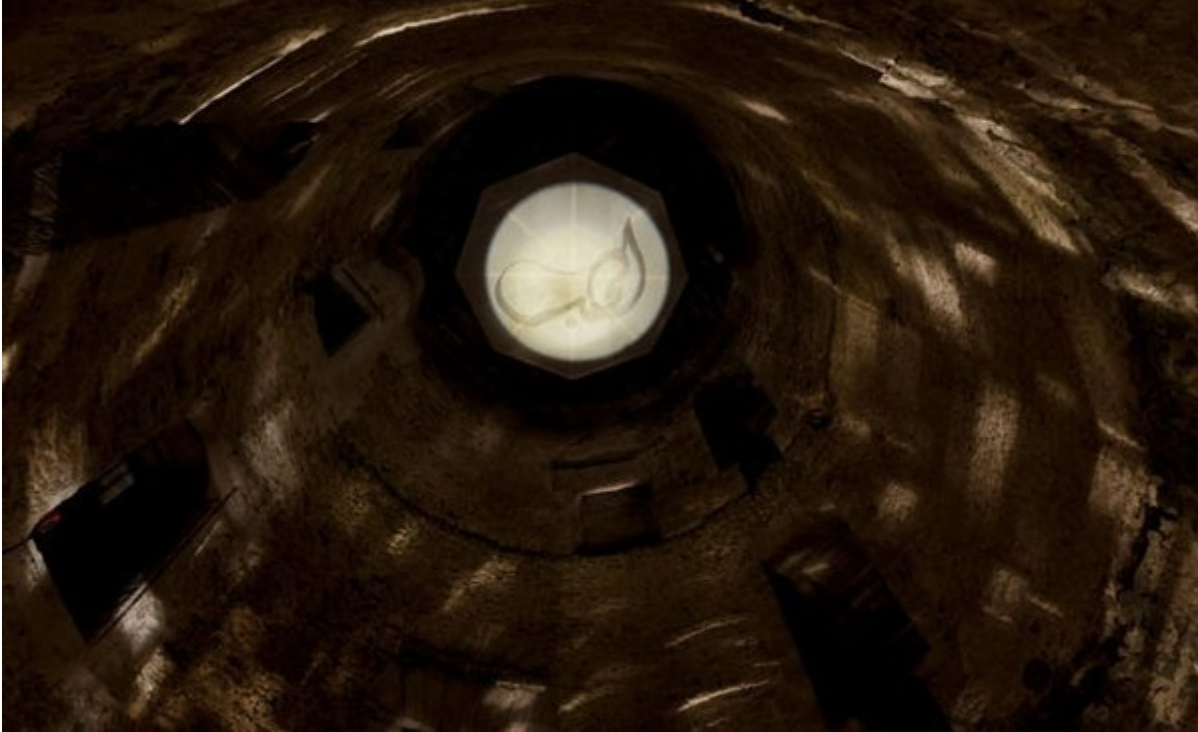
Moataz Nasr, Dome ,

2011. The Divine Comedy. Heaven, Purgatory and Hell Revisited by Contemporary African Artists , catalogo a cura Mara Ambrožič?, Simon Njami, Kerber Verlag Bielefeld, 2014