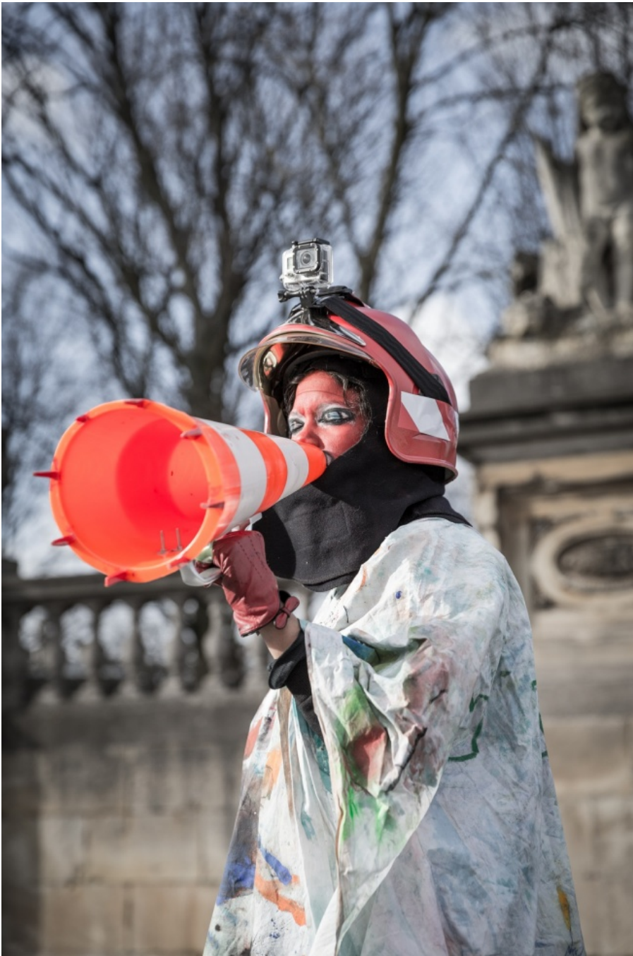
Tracey Rose, Tracings, performance, 2015

Intensa, tagliente, provocatoria e marcatamente politica, questa esposizione curata da Koyo Kouoh espone nelle sale del Wiels di Bruxelles il lavoro di una generazione di artiste africane provenienti da differenti regioni del continente formatesi alla fine degli anni '90, nel momento in cui, trascorsi ormai vent'anni dagli studi postcoloniali, dalle performances e dalle azioni radicali sul corpo degli anni '70, la questione del femminismo e la nozione di genere e sessualità nell'arte venivano nuovamente "rilette" e interrogate dalle pratiche artistiche contemporanee. In questa mostra a "parlare" non è più l'emozione, l'espressione e la "passione" del corpo occidentale, emblema di un secolo di turbamenti, inquietudini, orrori, desideri e follie, ma il calore, la memoria e la sensibilità del corpo africano negli anni duemila con le sue personali identità, vulnerabilità, storie e ribellioni. A differenza dei paesi occidentali, infatti, in molte regioni africane l'esibizione pubblica del corpo nudo della donna è una pratica ancora profondamente radicata nella cultura africana tradizionale come mezzo per denunciare le ingiustizie.