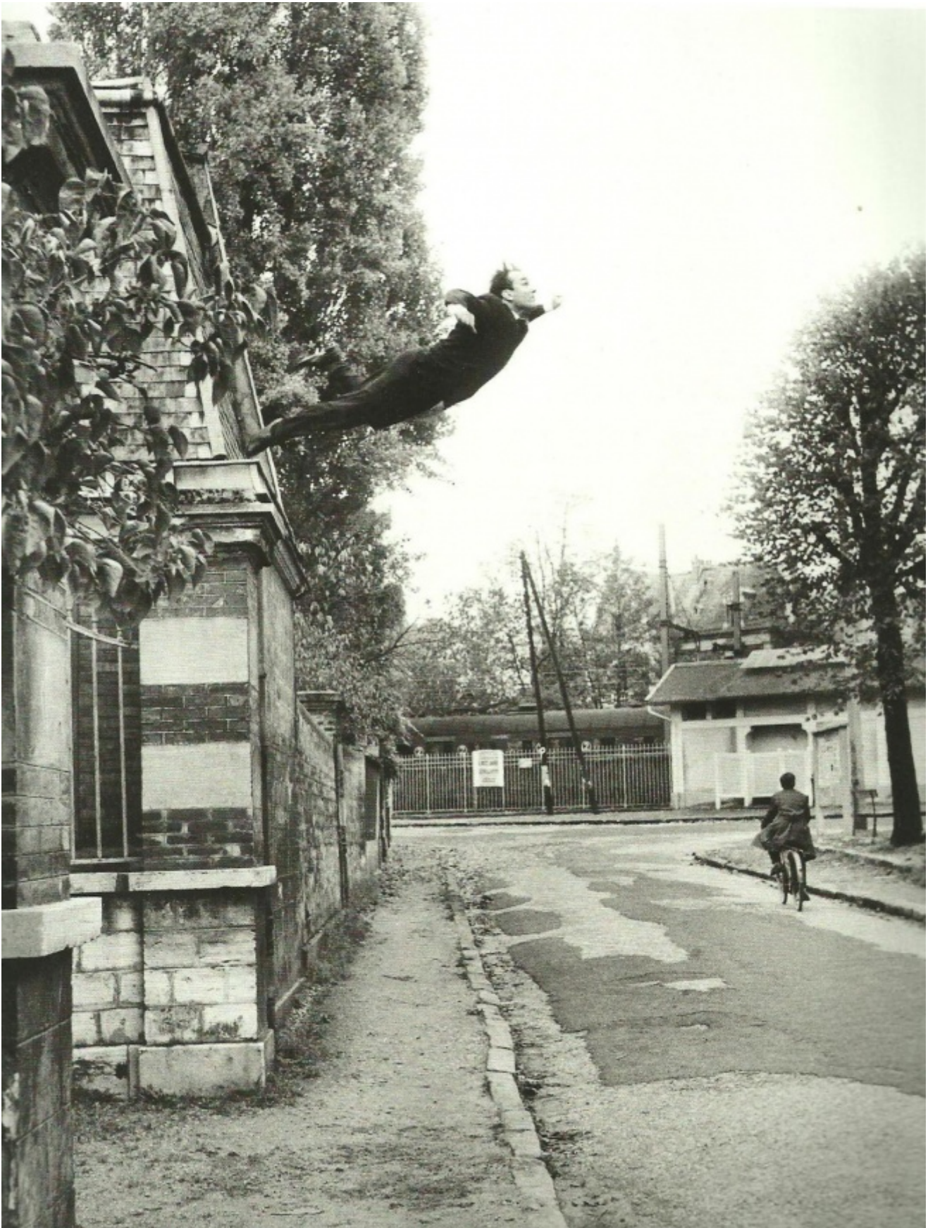
Yves Klein, Volo nel vuoto, 1960