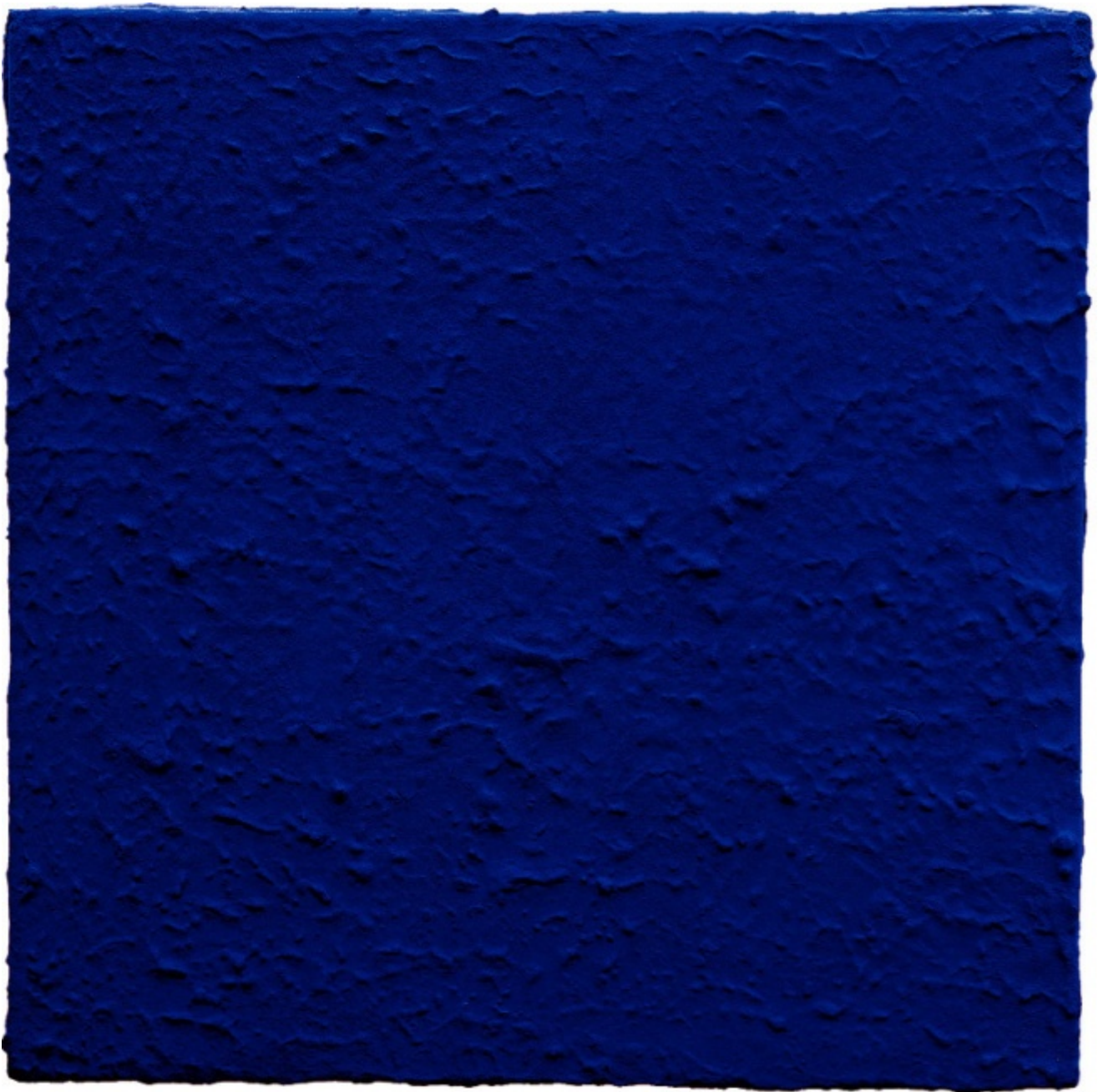
Monochrome bleu sans titre, (IKB 190), 1959

Simili reazioni ostili si produssero in patria. Fa eccezione solo il teutonico Gruppo Zero, che lo aveva preso in simpatia, e qualche italiano arcistupo dell'Informale. Questa situazione non sorprende: non appena ci si avvicina all'arte di Klein – alle opere quanto al personaggio – si è costretti a gestire una serie di impasse: “da una parte il monocromo metafisico e l'approccio solenne al vuoto; dall'altra le performance che parodiavano la solennità, l'ironia decostruttiva, le buffonate da clown”, riassume McEvelley che insiste sulla polarità Malevich/Duchamp, dai quali Klein tenne un'equa distanza se non un oculato, strategico disinteresse.