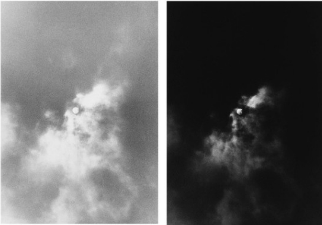
Timm Rautert, Sonne und Mond von einem negativ , dittico, 1972

alla luce, si possa ottenere un'immagine e il suo contrario, il Sole e la Luna, assottigliando il confine tra oggettività e manipolazione.