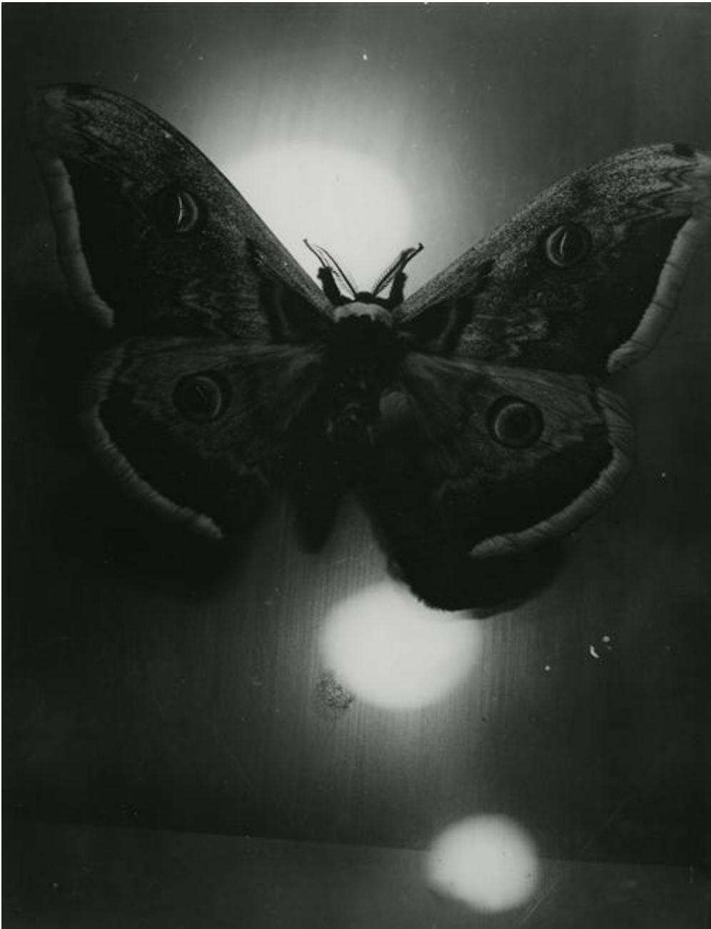
Brassaï, Papillon à la bougie , 1934 circa

Aprono la mostra le affascinanti falene immortalate da Brassai intorno ai fiochi lumi notturni, splendida metafora della fotografia intesa come pulsione, “incoercibile voglia di vedere”, e dell’irresistibile attrazione del fotografo per la luce. Il percorso procede mettendo in evidenza le differenti chiavi interpretative elaborate dai diversi artisti nel cercare di definire la fotografia, chi procedendo da un’analisi dei materiali alla base del processo di produzione dell’immagine fotografica, chi a partire dai suoi principi ottici e chimici, chi dalle tecniche di sviluppo: Timm Rautert, nel dittico Sonne und Mond von einem negativ , mostra come da un unico negativo, semplicemente variando la durata dell’esposizione