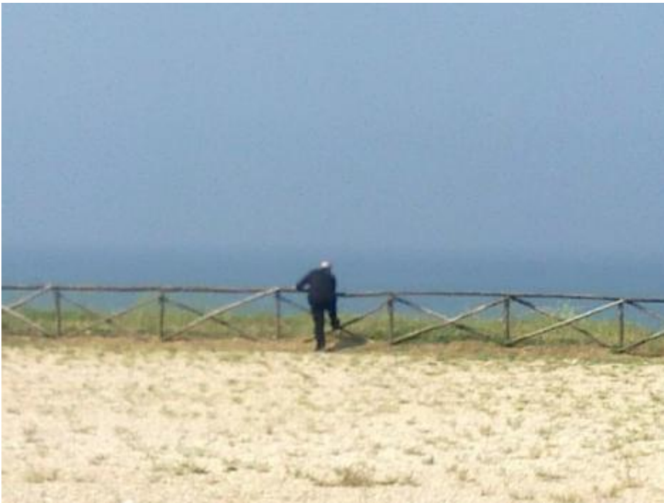
Telefonare sulla via del Circeo.