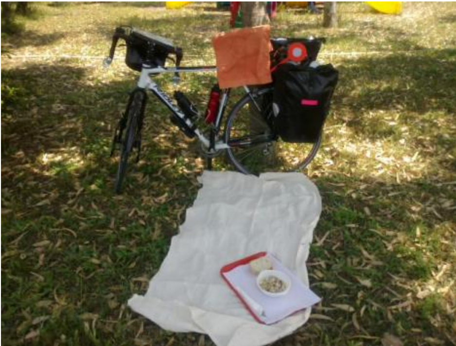
Sotto i voli di Fiumicino.