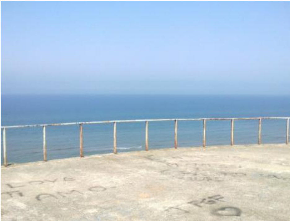
A Torvaianica ho avuto paura.