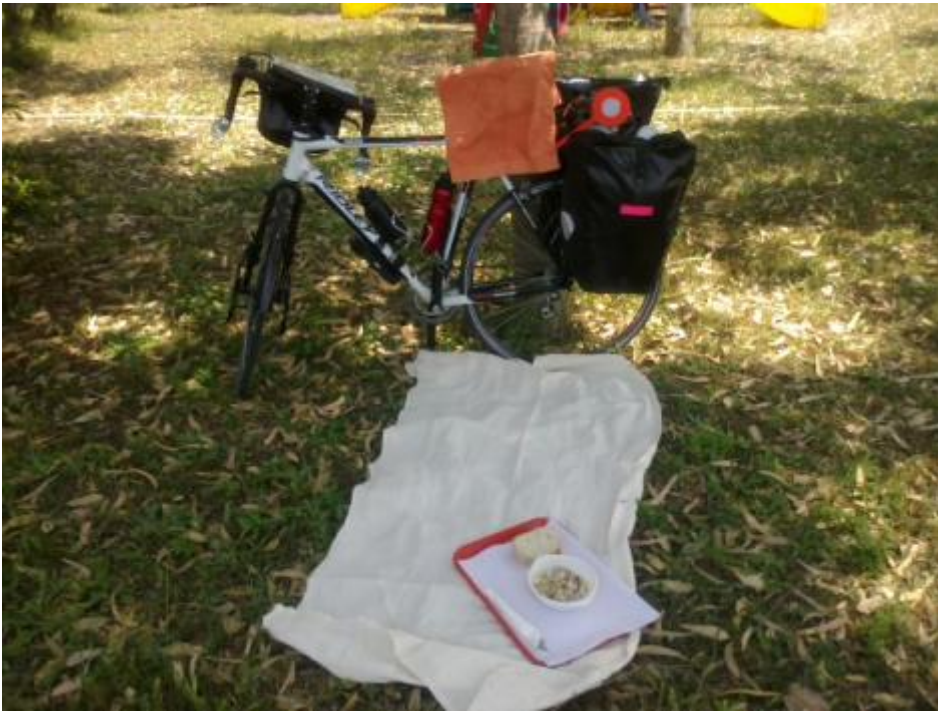
Sotto i voli di Fiumicino.