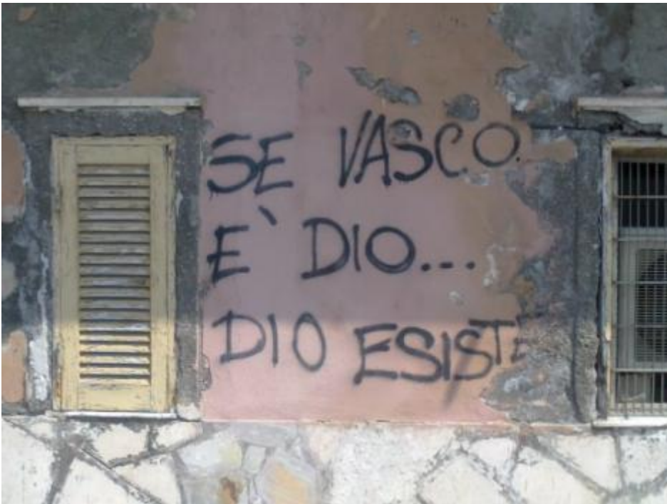
Se Vasco è Dio...Dio esiste. Ad Anzio.