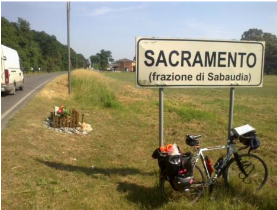
Sacramento a Sacramento.