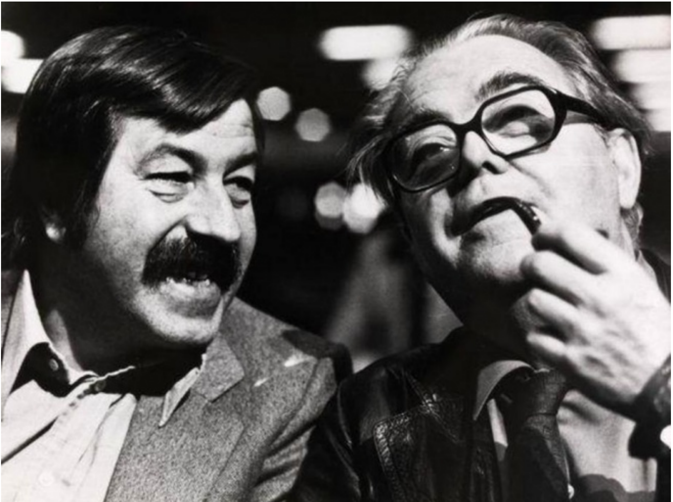
Max Fischer e Günter Grass

Ovest, la città in cui Frisch trova stimoli positivi per il suo lavoro e le sue riflessioni: di questa parte della città Frisch pare quasi abitare solo il suo appartamento, isola nell'isola, a cui regolarmente approdano gli amici in visita, e nel quale si sente «il guardiano di un faro che non è più in funzione: prende nota delle navi che passano, perché non sa che cos'altro potrebbe fare».