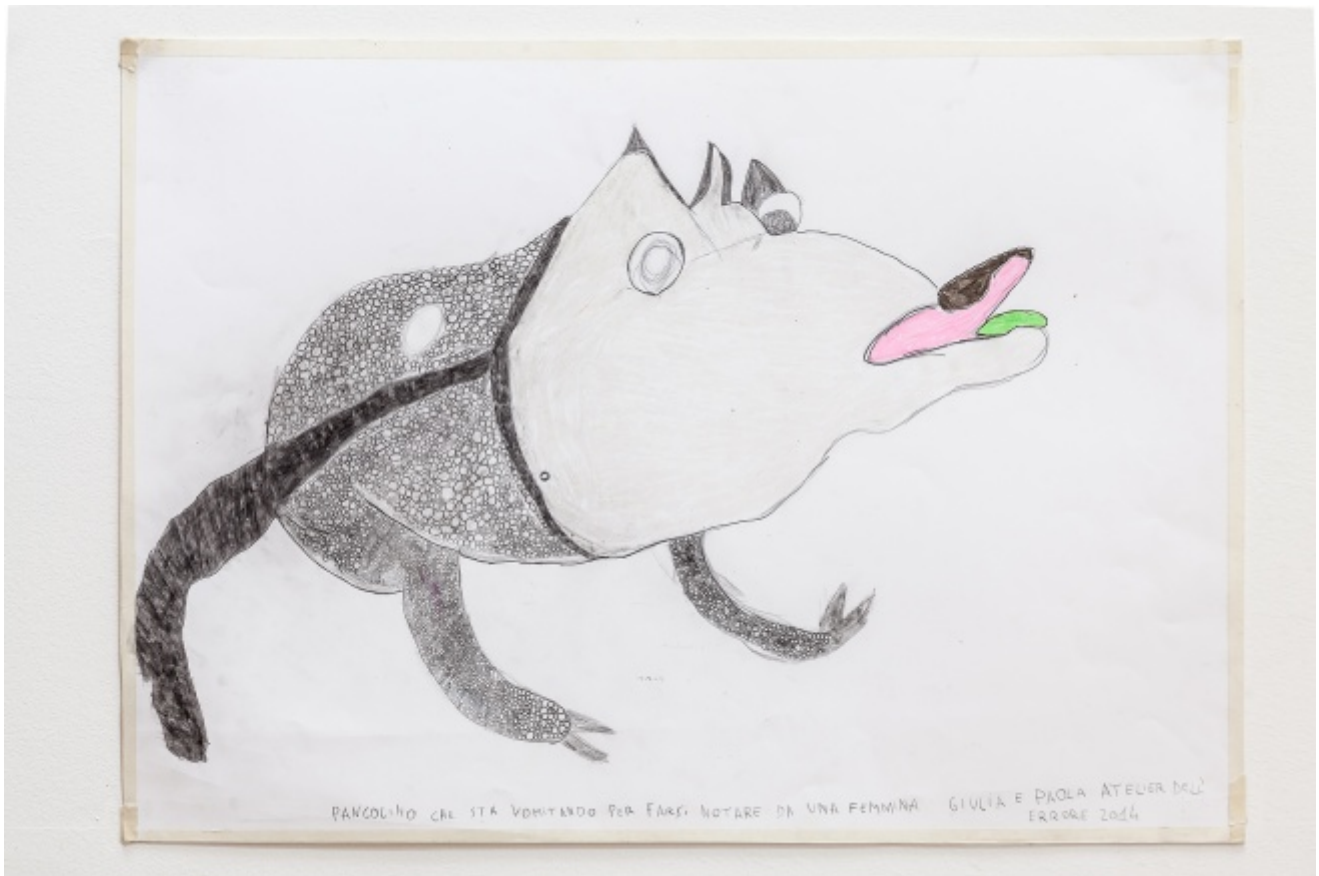
Pangolino che sta vomitando per farsi notare da una femmina, autori vari, Atelier dell'Errore