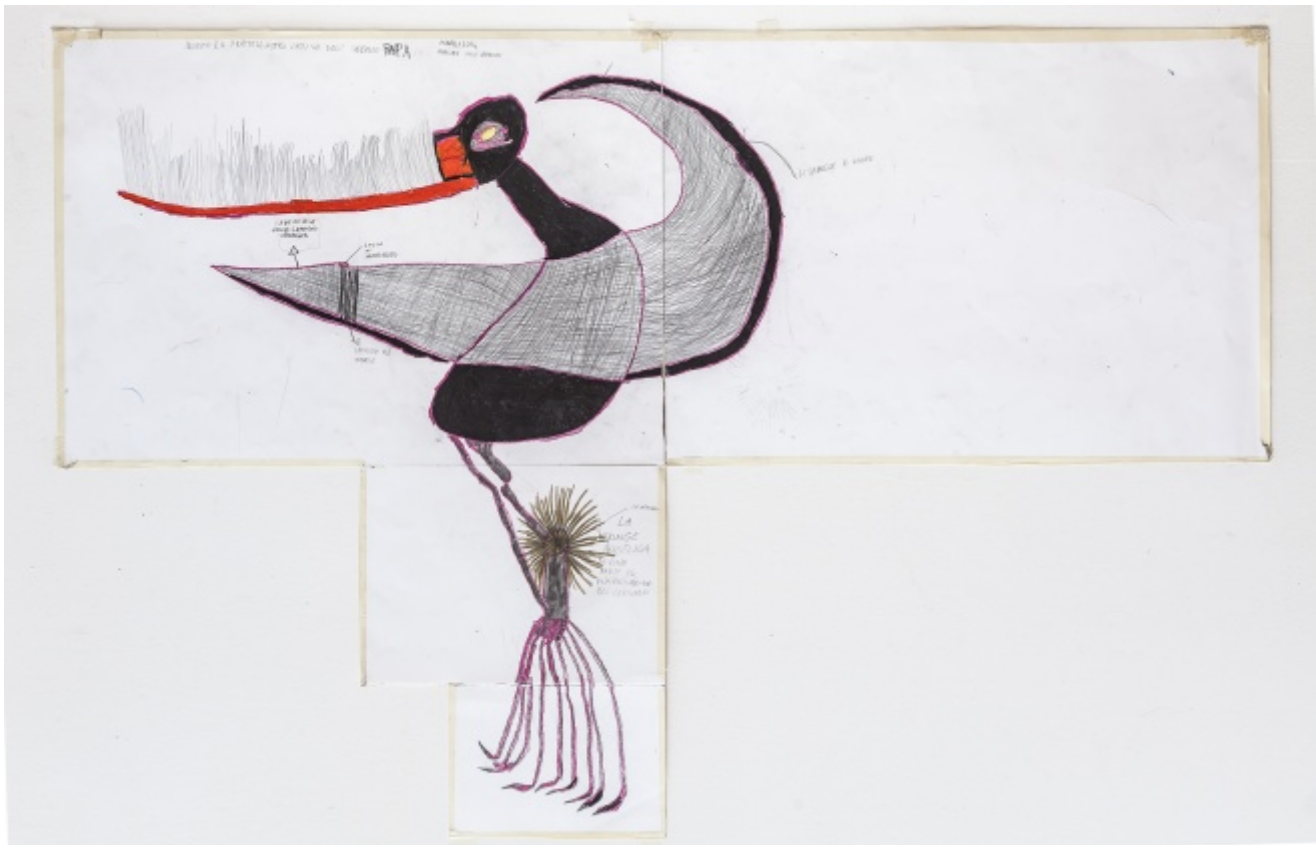
Il fratello cattivo dell'Uccello Papa, Andrea, Atelier dell'Errore

Da qualche mese l'Atelier ha una appendice, L'Atelier Big, ospitato dentro l'edificio della Collezione Maramotti. In stanze da lavoro, accanto alle sale in cui sono esposte le opere degli artisti cosiddetti "normali" del Novecento, ci lavorano i ragazzi che hanno più di diciotto anni per cui il servizio dell'Asl non è più assicurato. L'Atelier, sia quello tradizionale sia quello coi ragazzi più grandi, è strutturato come uno studio d'artista, con materiali a disposizione: matite, colori, pastelli a cera, fogli. Si lavora, perché l'arte è dedizione, concentrazione, costanza, e anche fatica. I suoi frequentatori, come ha detto uno di loro, sono quelli che "nessuno invita alle feste di compleanno".