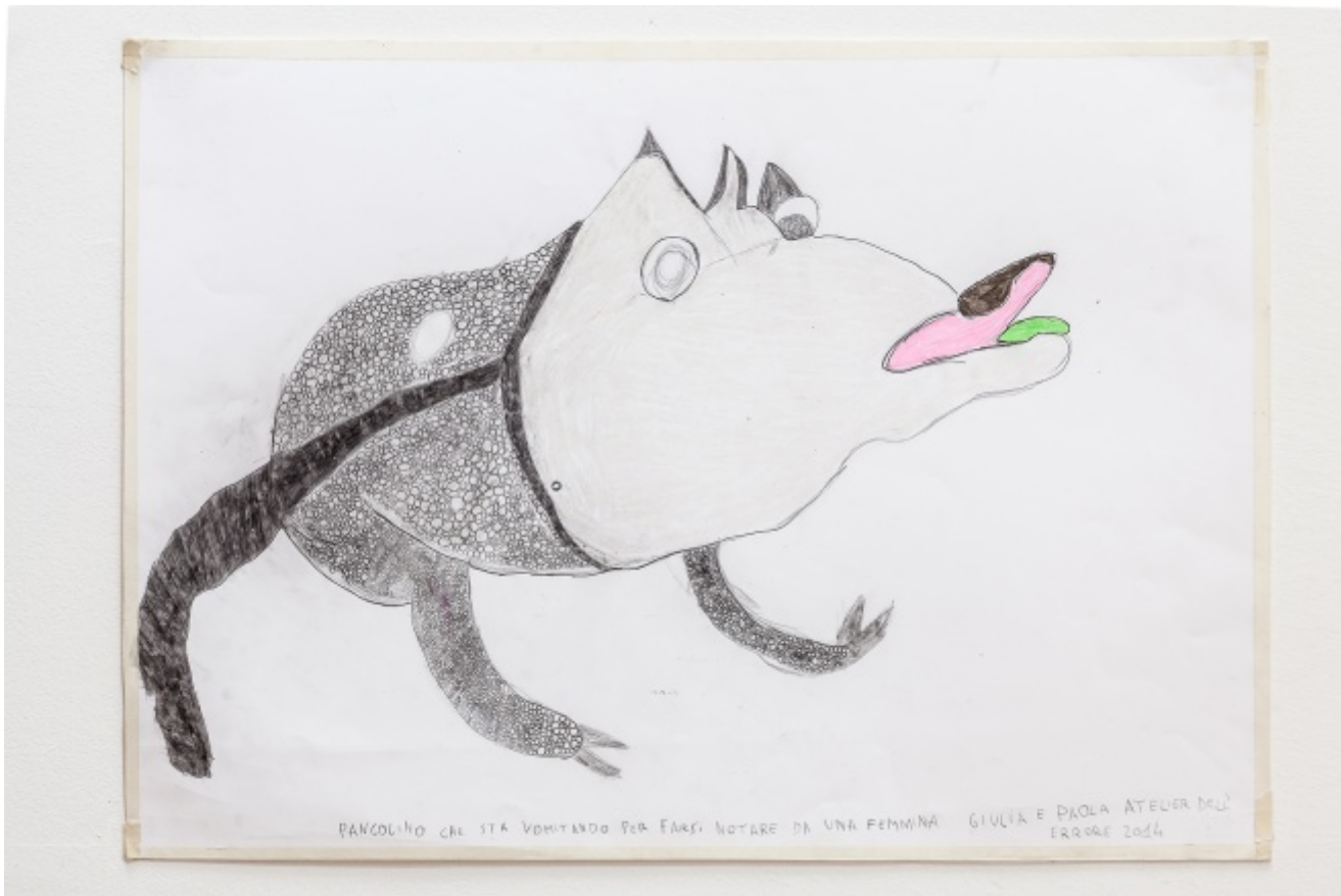
Pangolino che sta vomitando per farsi notare da una femmina, autori vari, Atelier dell'Errore