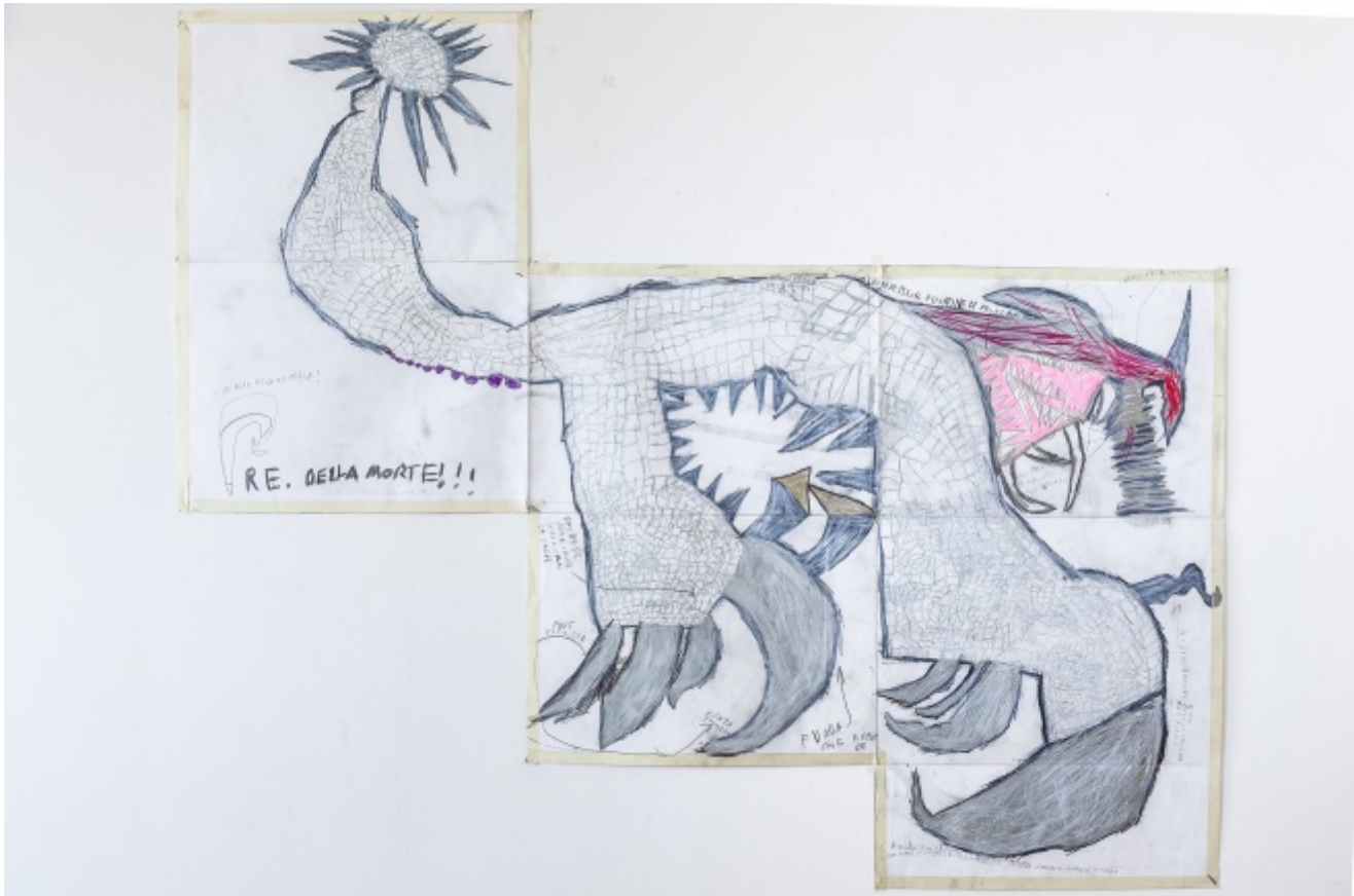
Il Re della morte, Christian, Atelier dell'Errore

L'idea di partenza, dice Luca Santiago Mora, è stata d'attingere alle narrazioni che ciascuno ha dentro di sé, che si porta da tempo, o che invece nascono all'improvviso mentre si disegna. “La prima regola è quella che non si può mai cancellare. Per questo – aggiunge – si è chiamato Atelier dell'Errore: l'errore fa parte del lavoro. All'inizio usavamo solo pastelli a cera, che non si possono tirar via con la gomma. Lo sbaglio diventa il modo con cui si procede, d'invenzione in invenzione. Siamo una scuola specialistica di Oltre-Zoologia, zoologia fantastica, come quella dei bestiari medievali, del Fisiologo per esempio”. Da qualche tempo i disegni di questi ragazzi illustrano le copertine della collana Compagnia Extra di Quodlibet, curata da Ermanno Cavazzoni e Jean Talon, con romanzi e racconti di Gianni Celati, Luigi Malerba, Maria Sebregondi e tanti altri.