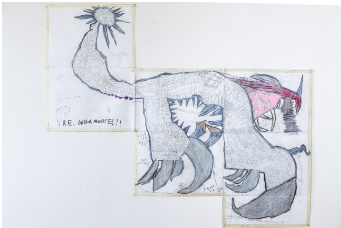
Il Re della morte, Christian, Atelier dell'Errore

L'idea di partenza, dice Luca Santiago Mora, è stata d'attingere alle narrazioni che ciascuno ha dentro di sé, che si porta da tempo, o che invece nascono all'improvviso mentre si disegna. "La prima regola è quella che non si può mai cancellare. Per questo - aggiunge - si è chiamato Atelier dell'Errore: l'errore fa parte del lavoro. All'inizio usavamo solo pastelli a cera, che non si possono tirar via con la gomma. Lo sbaglio diventa il modo con cui si procede, d'invenzione in invenzione. Siamo una scuola specialistica di Oltre-Zoologia, zoologia fantastica, come quella dei bestiari medievali, del Fisiologo per esempio". Da qualche tempo i disegni di questi ragazzi illustrano le copertine della collana Compagnia Extra di Quodlibet, curata da Ermanno Cavazzoni e Jean Talon, con romanzi e racconti di Gianni Celati, Luigi Malerba, Maria Sebregondi e tanti altri.