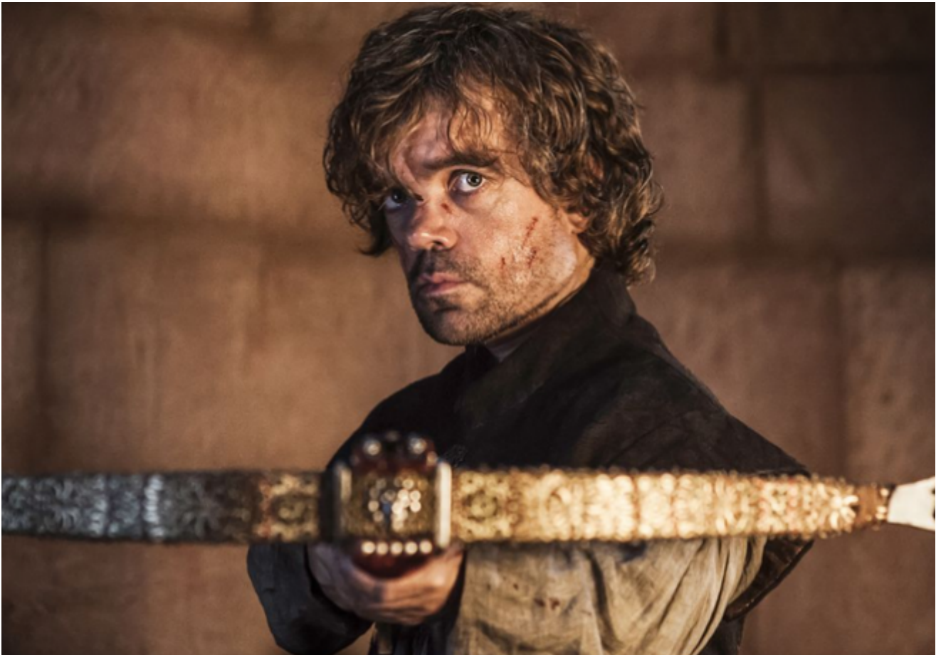
Tyrion Lannister, Game of Thrones

Primo, la serialità continua. È nota la differenza tra la serialità episodica delle sit-com (in cui ciascuna puntata è autosufficiente e riporta alla situazione di partenza), la serialità aperta delle saghe (in moto perpetuo verso ulteriori sviluppi), e le gradazioni intermedie della serialità a spirale (che combina iterazione e progressione) e della quasi-saga (serie progressiva con episodi incapsulati). Solo la serialità continua provoca la dipendenza di cui stiamo parlando qui. Né Dr. House né Sex and the City , né Friends né How I Met Your Mother ci hanno mai ridotti a schiavitù: uno o due episodi alla volta ci appagavano, e lo scioglimento dell'intreccio ci riportava dolcemente a terra. I serial continui viceversa frustrano il bisogno umano di compiutezza (closure), intrecciando trame e sottotrame che non si risolvono neppure a fine stagione, ed è questa vorticoso fuga in avanti a catturare il pubblico, come ben sapevano i romanzieri d'appendice. Con la differenza che in quel caso la scansione delle puntate imponeva un consumo dilazionato del racconto, laddove il libero accesso agli episodi in streaming ne incoraggia l'uso smodato e la conseguente insoddisfazione. Senza chiusura non c'è catarsi, e senza catarsi non c'è pacificazione col presente.