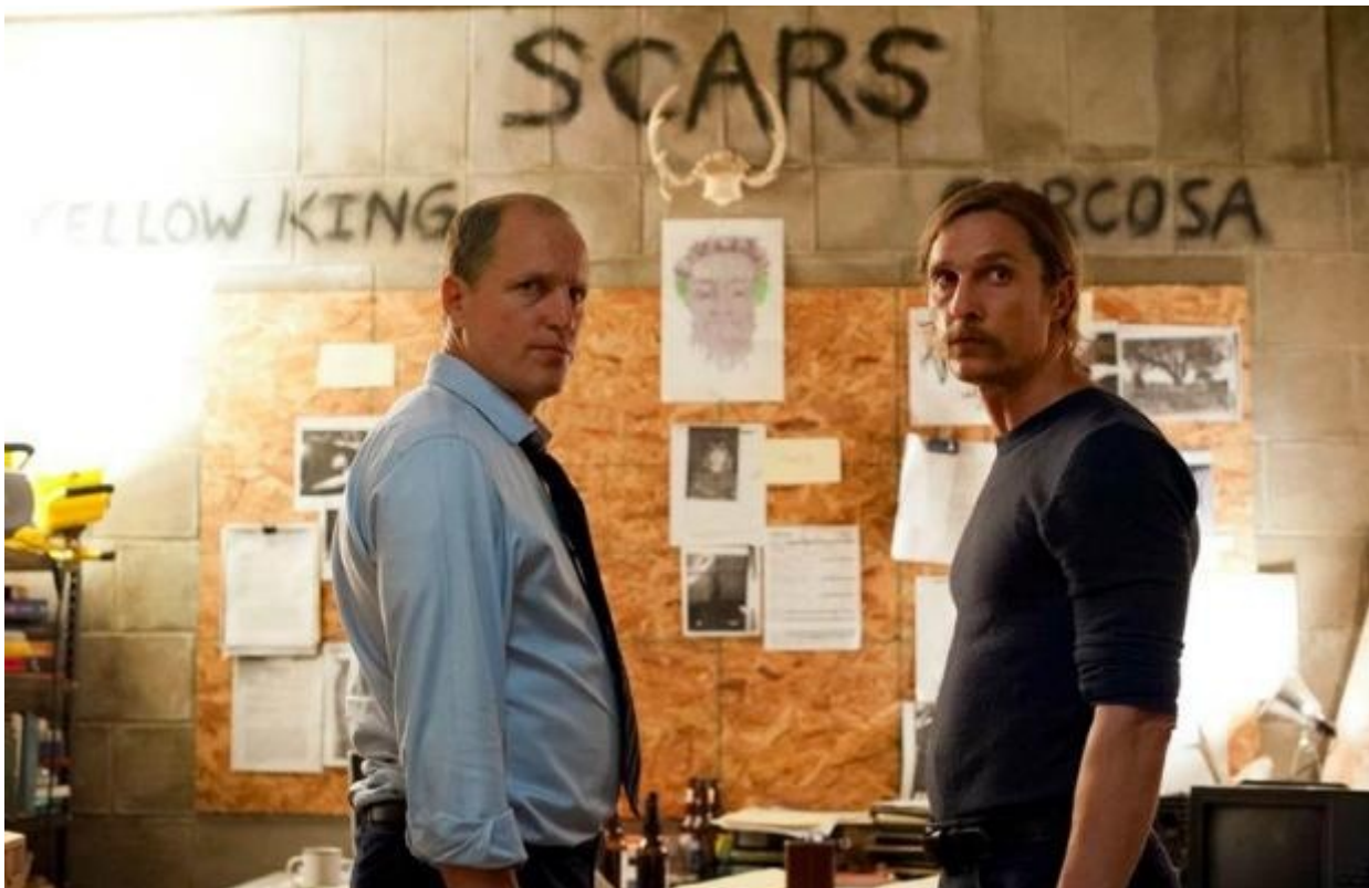
Marty Hart e Rust Cohle, True Detective

una vasta gamma di scenari controfattuali: se faccio X potrebbero succedere A, B oppure C, ma se succede C io farò Y e il mio avversario penserà che Z... Tengono d'occhio il quadro d'insieme, come si conviene ai migliori strateghi, formulano continue ipotesi su ciò che accade nelle menti degli altri, sanno intrattenere una molteplicità di mondi possibili alternativi senza confondersi tra l'uno e l'altro, e non esitano a mentire, a ricattare, e persino a uccidere, pur di perseguire i loro scopi. La distinzione tra bene e male non è particolarmente rilevante, né per loro né per chi ne segue le vicende: conta l'abilità strategica di sopravvivere e di prosperare in ambienti spesso ostili o insidiosi.