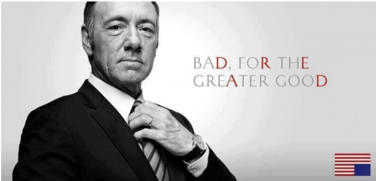
Frank Underwood, House of Cards