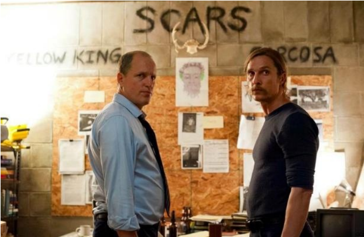
Marty Hart e Rust Cohle, True Detective

compaiono, sempre in controllo di una vasta gamma di scenari controfattuali: se faccio X potrebbero succedere A, B oppure C, ma se succede C io farò Y e il mio avversario penserà che Z... Tengono d'occhio il quadro d'insieme, come si conviene ai migliori strateghi, formulano continue ipotesi su ciò che accade nelle menti degli altri, sanno intrattenere una molteplicità di mondi possibili alternativi senza confondersi tra l'uno e l'altro, e non esitano a mentire, a ricattare, e persino a uccidere, pur di perseguire i loro scopi. La distinzione tra bene e male non è particolarmente rilevante, né per loro né per chi ne segue le vicende: conta l'abilità strategica di sopravvivere e di prosperare in ambienti spesso ostili o insidiosi.