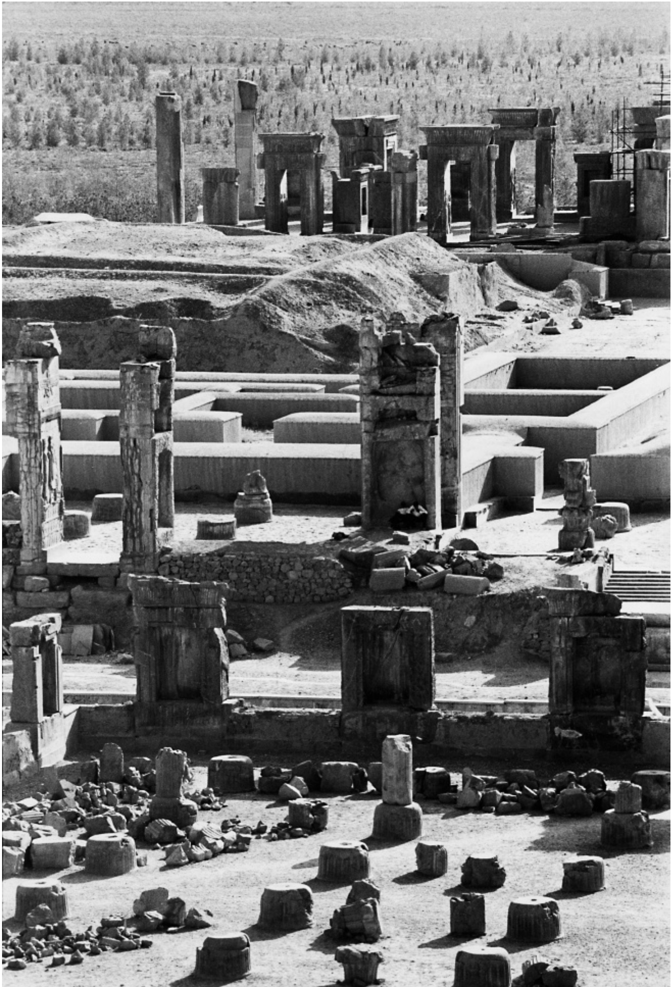
Gabriele Basilico, Persepolis, Iran. Da "Gabriele Basilico, Iran 1970"