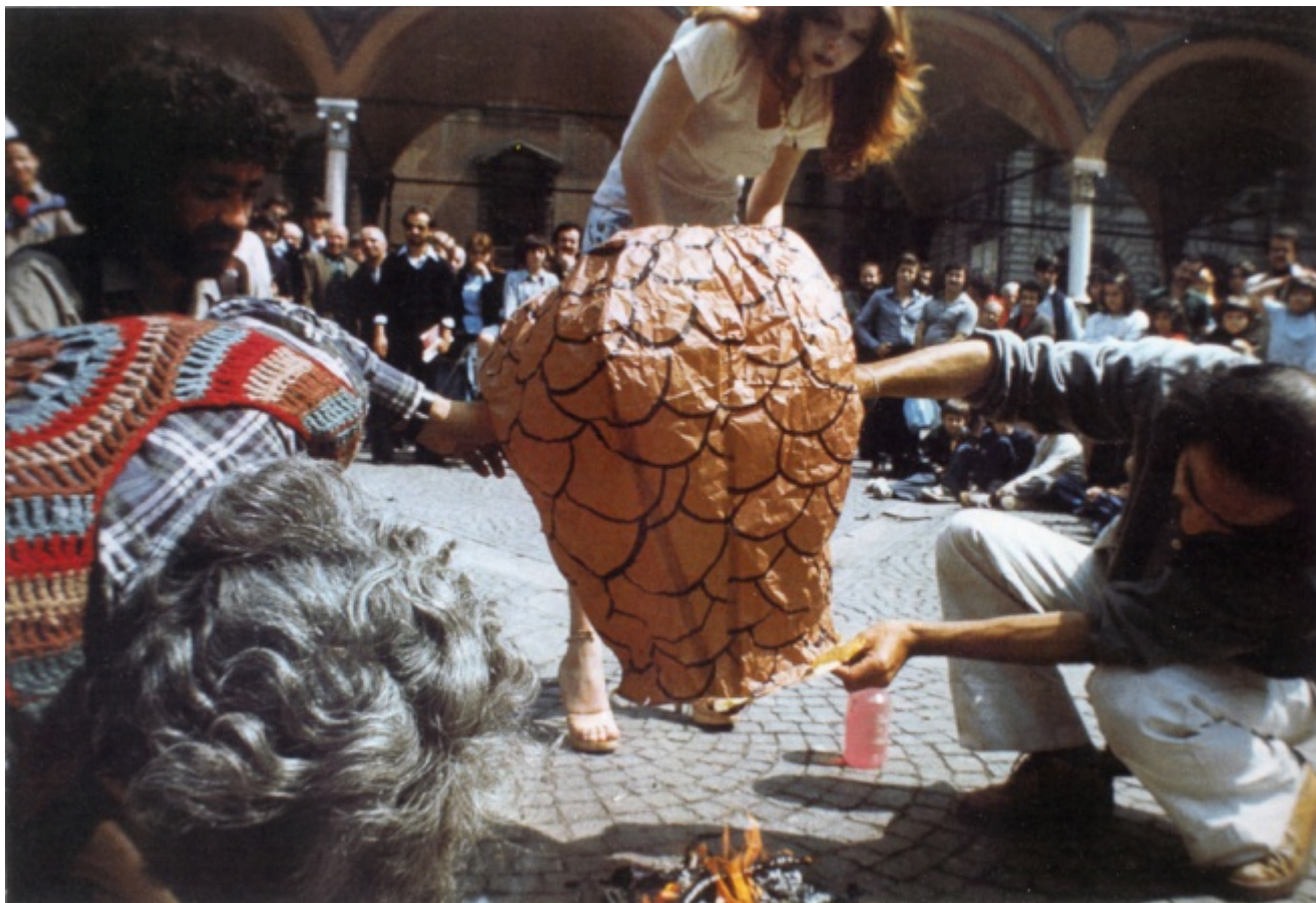
Lancio di mongolfiere nelle strade di Bologna dopo i fatti del marzo '77