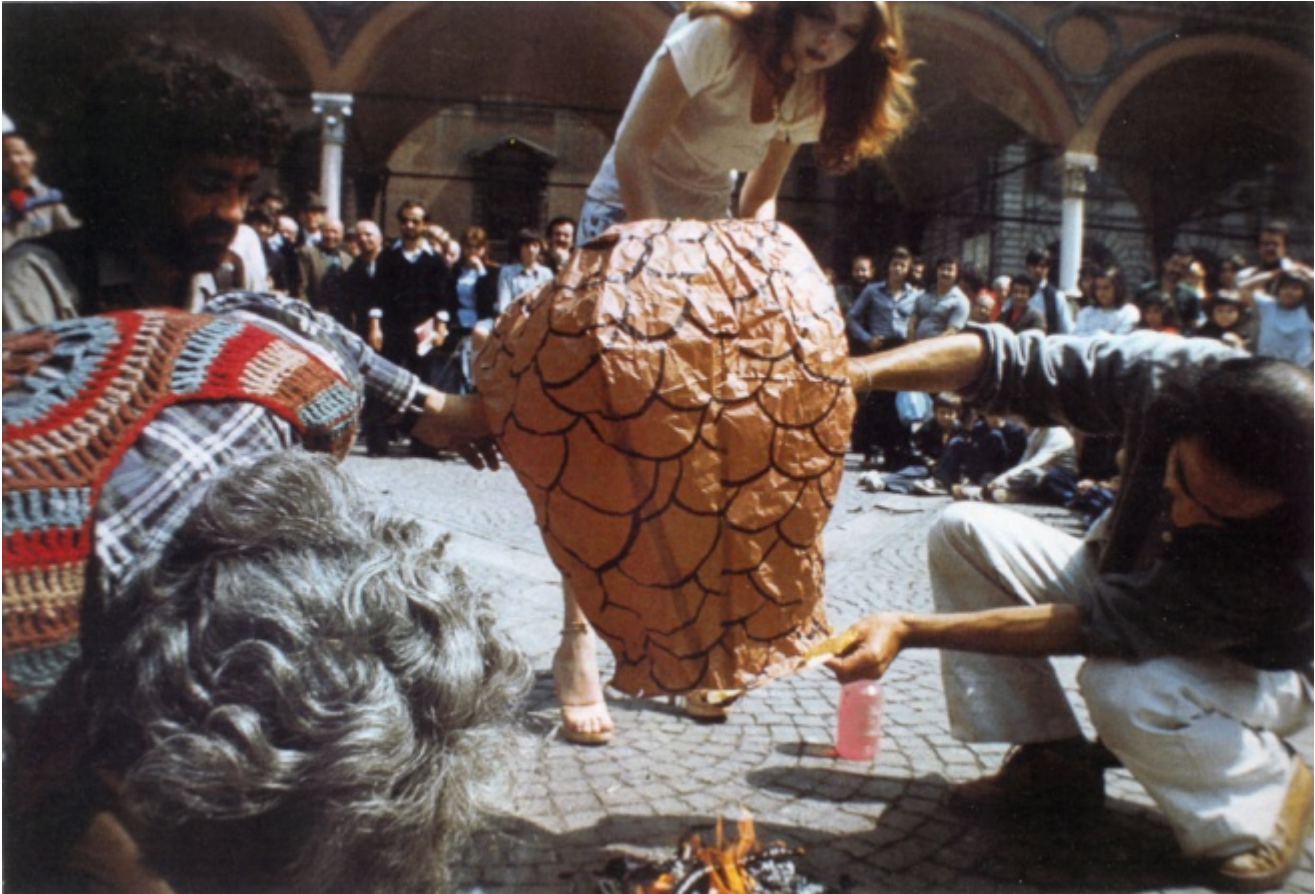
Lancio di mongolfiere nelle strade di Bologna dopo i fatti del marzo '77