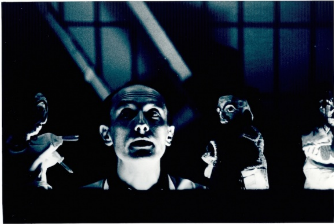
Ciclo del Teatro Vagante: Fantastica Visione Vision Fantastique, regia di Alessandro Marinuzzi, prod. Css Udine - L'Abattoir - Centre Régional de Créations Européennes de Chalon-sur-Saône (1993)