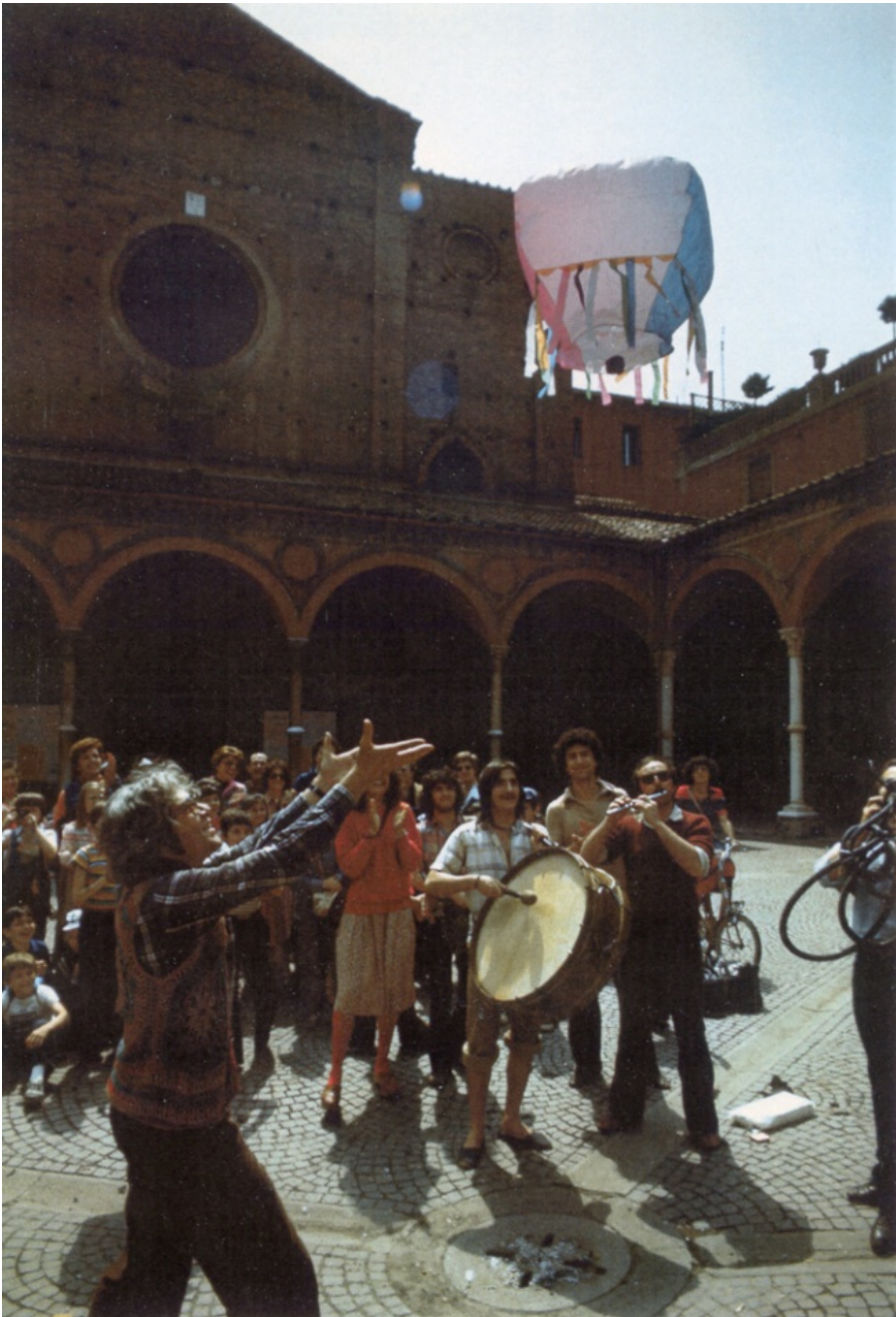
Volo di mongolfiere nelle strade di Bologna dopo i fatti del marzo '77