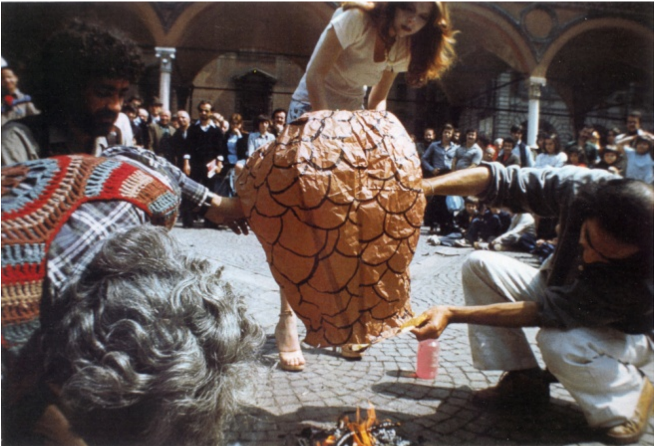
Lancio di mongolfiere nelle strade di Bologna dopo i fatti del marzo '77

farsi venticinque anni di carcere senza mai aver ucciso nessuno, dall'altra mi ha raccontato che tra i libri che leggevano in prigione c'erano Marco Cavallo e Teatro negli spazi degli scontri . Ecco, gli ho detto, bisognava fare i burattini prima . Sai, Marco Cavallo alla fine vince su tutti, anche su Bin Laden. Basta intendersi sulle regole del gioco. La morte, intesa come possibilità di morire e di dare la morte, ha sempre rappresentato una posta in gioco terribilmente affascinante per i bambini e per i sognatori. Ma ha un grave torto: fa male all'altro.