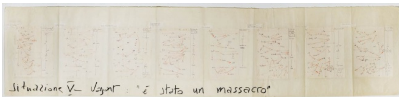
La pagina sulla tragedia del Vajont della partitura della Fabbrica illuminata (1964, testi di Giuliano Scabia, musica di Luigi Nono)

In una pagina de Il tremito. Che cos'è la poesia (Casagrande, Bellinzona, 2006) hai scritto che le religioni alle volte impazziscono. Il fondamentalismo rappresenterebbe la fase del loro impazzimento?