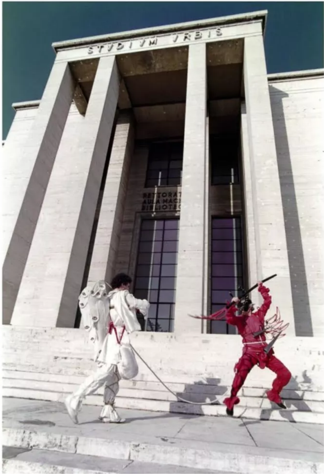
Foto n. 11. "È quasi il tramonto e siamo davanti all'Aula Magna dell'Università. Qui dea è Minerva, la misericordiosa Atena. Pensando alla sua equilibrata forza ho fatto il duello che si vede nella foto."