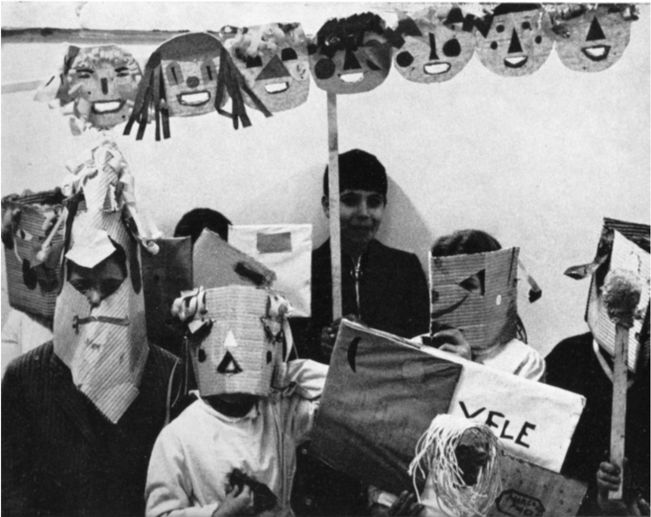
Azioni di decentramento a Torino: i bambini e il loro doppio; le maschere di cartone per il Teatrino di Corso Taranto, e – in alto – il grappolo delle sagome di teste in compensato

A quel punto è successo che mi sono spaventato, del dolore e di quell'esplosione dolorosa che era stato il '77. Perché avevo visto tante persone, anche tra i miei allievi, rovinate da questa infatuazione per la violenza politica. Volevo calmare le teste e allora ho detto: ricominciamo da zero. Uno dei primi lavori all'epoca è stato quello di rileggere con gli studenti la prima scena di Zip dove c'è la nascita degli attori dall'uovo. Ho chiesto agli otto studenti che in quel momento seguivano il mio seminario di cominciare dalle loro parole più segrete, che è una pratica che avevo già esplorato in In capo al mondo . Ognuno si è dato un nome e ha elaborato un copione ispirato alle prime parole, quelle dell'infanzia, quelle segrete, i primi suoni con la madre e il padre. Alla fine c'erano queste otto voci che dialogavano tra di loro. Volevo ripartire da ciò che è più radicale, più profondo e spesso più rimosso dentro di noi.