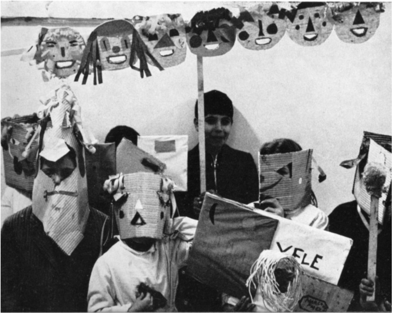
Azioni di decentramento a Torino: i bambini e il loro doppio; le maschere di cartone per il Teatrino di Corso Taranto, e - in alto - il grappolo delle sagome di teste in compensato

Era una risposta al cupio dissolvi che in quel momento sembrava inghiottire i movimenti politici?