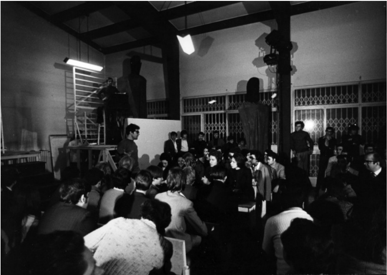
Azioni di decentramento a Torino: Giuliano Scabia interviene durante il dibattito in occasione di 600.000 al Centro sociale di Mirafiori sud

la musica, la danza inducono stati di trance . Ma se non è controllata, la trance produce sconvolgimenti, perché ti impedisce di vedere la realtà. E la realtà è l'unica maestra, è sempre la realtà che ci impartisce delle lezioni. Non è che le religioni creino queste situazioni di euforia e di offuscamento del senso della realtà, semplicemente le facilitano. Questo non è un male in sé, il male sta nell'incapacità di gestire la fase discendente del processo, la caduta dell'entusiasmo, quando non si riesce più a sopportare che dalla furia accecante dell'apparizione si torni all'ombra del mutamento. Il teatro che si rifà a Dioniso, il teatro greco anzitutto, ma in seguito anche quello europeo, ha cercato di capire questi stati di alterazione della mente. Certo, oggi non rappresenta che un margine della società, ma per lungo tempo il teatro è stato un luogo di osservazione della mente, dove l'umanità ha trasferito i suoi incubi, i suoi assassini, le sue vendette, i suoi adulteri, in una parola i suoi eccessi: per osservarli e per trovare un modo di uscirne. Prometeo, Elettra, Edipo. Io li ho letti così quegli scrittori e quei poeti. Catarsi per me vuol dire: cerchiamo di uscirne, cerchiamo di non farci troppo male.