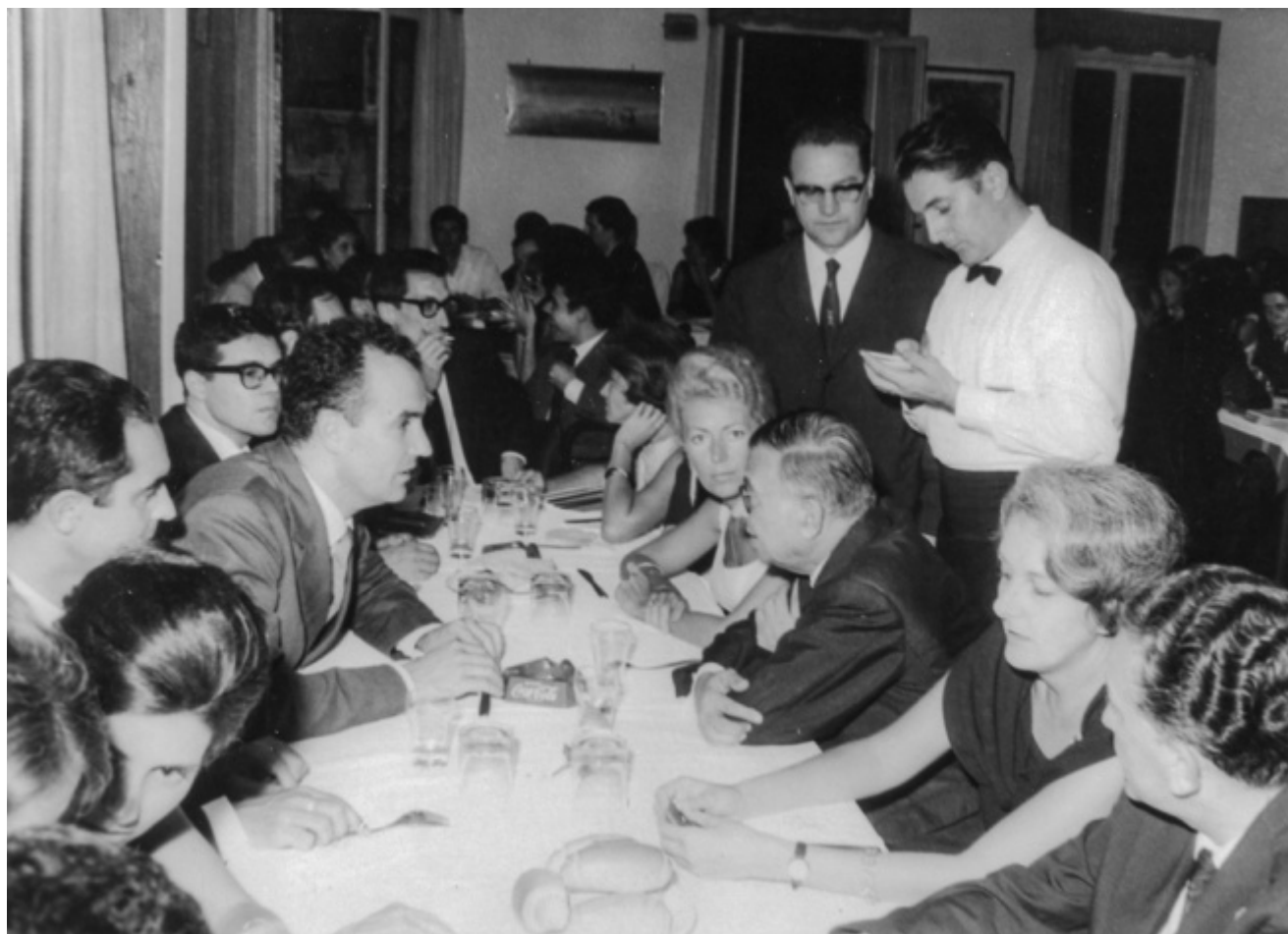
A cena con Sartre: si riconoscono a destra Jean-Paul Sartre e Rossana Rossanda; a sinistra Italo Calvino, Luigi Nono, Giuliano Scabia, Toni Negri

Continua lo speciale dedicato agli ottanta anni di Giuliano Scabia, uno dei padri fondatori del nuovo teatro italiano, maestro profondo e appartato di varie generazioni, artista sperimentatore, poeta, drammaturgo, regista, attore, costruttore di fantastici oggetti di cartapesta, pittore dal tratto leggero e sognante, narratore, pellegrino dell'immaginazione, tessitore di relazioni, incantatore. Dopo l'intervista Alla ricerca della lingua del tempo , la pubblicazione in quattro puntate del poema Albero stella di poeti rari – Quattro voli col poeta Blake (lo potete scaricare in pdf qui ), l'articolo di Oliviero Ponte di Pino sul suo teatro , Attilio Scarpellini lo intervista sulla delicata della violenza politica, incrociata in vari momenti del suo camminare e ricercare. E il poeta regala, infine, ai lettori di doppiozero una Canzone inedita.