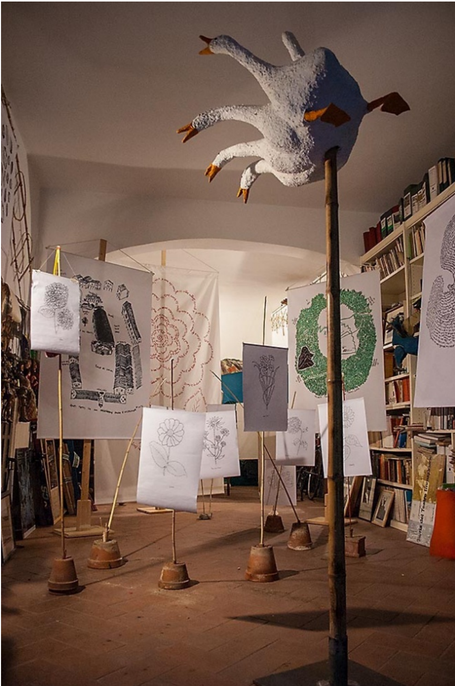
Firenze, il laboratorio di Giuliano Scabia: preparazione di una mostra

Per quanto vagabondo e cosmopolita, da decenni cittadino di Firenze e per trent'anni docente al Dams di Bologna, Scabia rimane intimamente veneto, per formazione ed elezione. Nelle Venezie ha sviluppato molta parte del suo lavoro artistico e qui si radica quasi tutta la sua produzione letteraria, dai romanzi alle raccolte di poesia, ma anche alcuni testi per il teatro, disegni, camminate e azioni teatrali, i grandi progetti di Marco Cavallo nell'ospedale psichiatrico di Trieste (1973) e del Teatro Vagante per la Biennale di Venezia (1975).