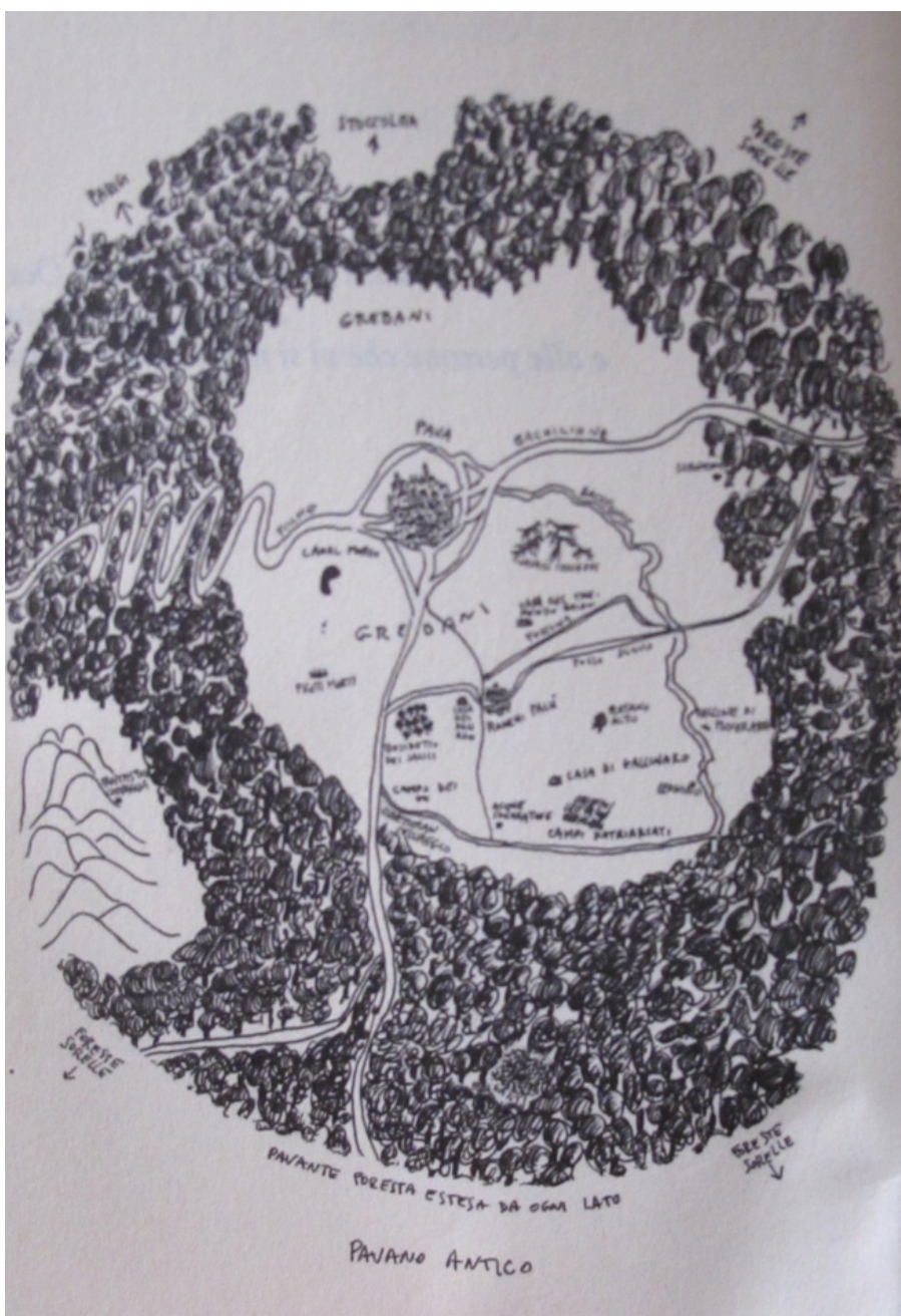
Mappa del Pavano antico (disegno di Giuliano Scabia)

[...] sotto sotto ci sono altre voci, quelle del mondo sottostante e retrostante, che ci seguono, ci inseguono, e ci vengono fuori malgrado noi, attraverso tutti i buchi che abbiamo, come fiati, venti, ruttini e altro - voci di altri che parlano attraverso di noi, di cui siamo solo tubi e bocche, quasi un protopopolo non del tutto estinto - anzi, ben vivo, che ogni tanto salta su e ci parla... [Il tremito cit.].