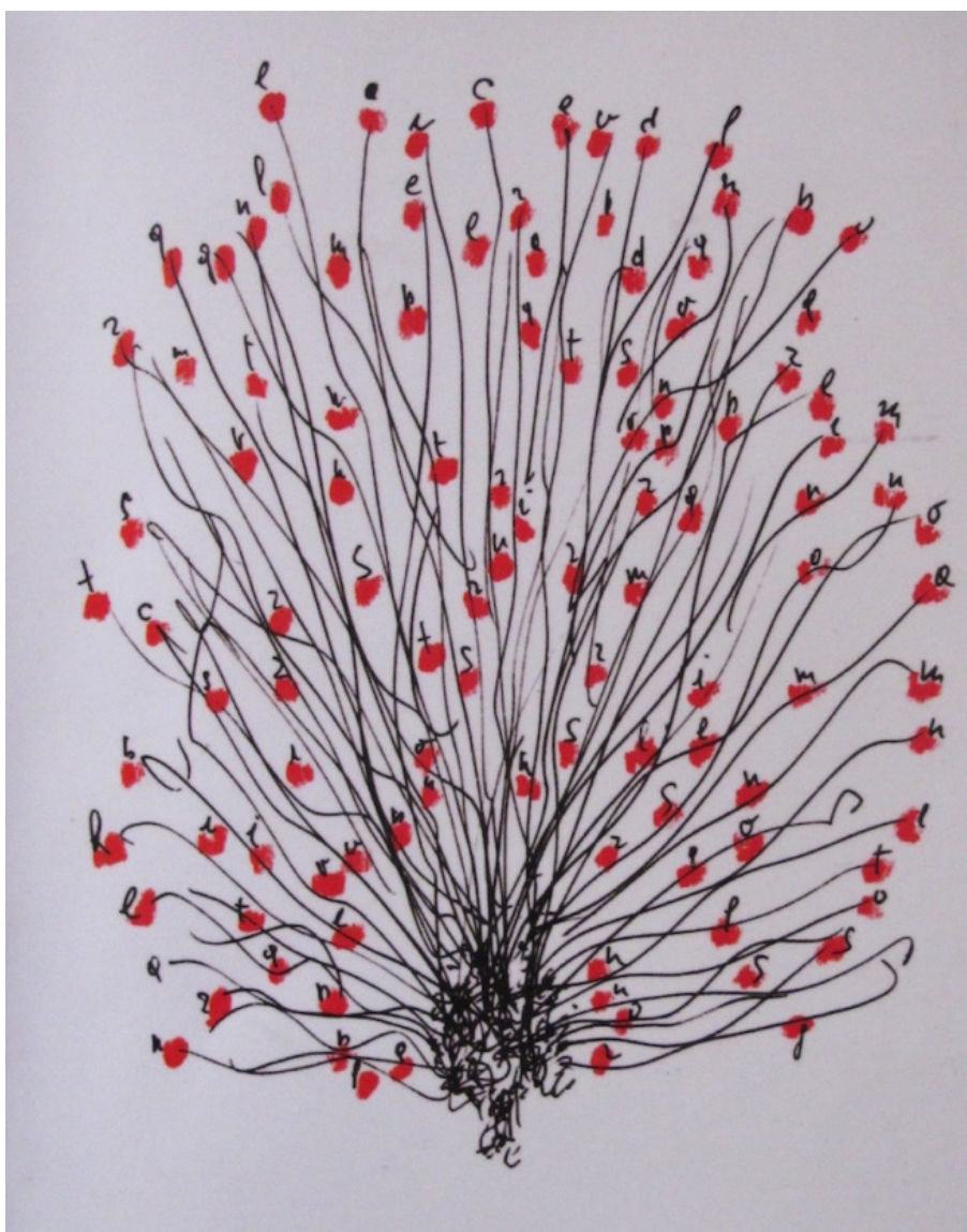
Disegno di Giuliano Scabia per la copertina di Nane Oca rivelato , terzo e ultimo romanzo della trilogia di Nane Oca

formula «dai campi di sterminio allo sterminio dei campi». Ma per questo la scrittura deve farsi a sua volta campo . Campo da «misurare a passi tardi e lenti», ovvero luogo di riflessione del soggetto (in senso fisico, perché nella scrittura l'onda assertiva dell'io cambia finalmente di segno e direzione), e campo di giochi linguistici, cioè di mondi inventati, di altre forme di vita, effimere e caparbie, come la poesia. Leopardiane ginestre e lucciole pasoliniane. Perché la scrittura possa dare forma al magico mondo, divenire stralingua, «prendere le parole come pesci» scorgere altri mondi «dalle fessure fra una parola e l'altra», bisogna, come si evince dalle metafore metapoetiche d'autore, che entri in gioco il corpo, e con esso lo spazio. Per ritrovare la «lingua ricca e storta» dei grèbani e dei Ronchi Palù o i resti delle lingue scomparse delle bestie e degli uomini basta infatti capovolgere sassi e zolle, come insegna il professor Pandolo a Nane Oca. Ma appunto bisogna capovolgerli: serve un gesto, un movimento, un'azione in uno spazio. Serve il teatro. Non si comprende la scrittura di Scabia senza coglierne la fisicità, la gestualità implicita. Una scrittura come teatro che è l'altra faccia del teatro come scrittura.