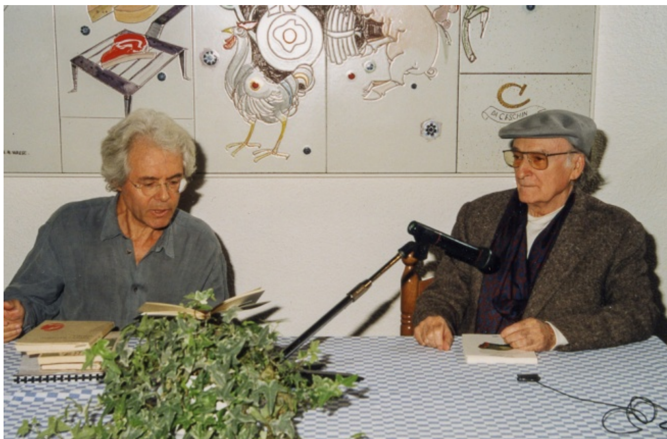
Scabia e Andrea Zanzotto

Continua lo speciale a cura di Massimo Marino dedicato agli ottanta anni di Giuliano Scabia, uno dei padri fondatori del nuovo teatro italiano, maestro profondo e appartato di varie generazioni, artista sperimentatore, poeta, drammaturgo, regista, attore, costruttore di fantastici oggetti di cartapesta, pittore dal tratto leggero e sognante, narratore, pellegrino dell'immaginazione, tessitore di relazioni, incantatore. Dopo l'intervista Alla ricerca della lingua del tempo , la pubblicazione in quattro puntate del poema Albero stella di poeti rari – Quattro voli col poeta Blake (lo potete scaricare in pdf qui ), l'articolo di Oliviero Ponte di Pino sul suo teatro , l'intervista di Attilio Scarpellini sulla delicata questione della violenza politica , incrociata in vari momenti dal ricercare di questo poeta teatrante, Fernando Marchiori racconta qui lo Scabia "veneto", di come a un certo punto del suo cammino di artista d'avanguardia, cosmopolita, il substrato regionale, familiare, e la sua lingua, il suo dialetto, insieme personale e culturale, siano riemersi ad aprire nuovi, antichi orizzonti.