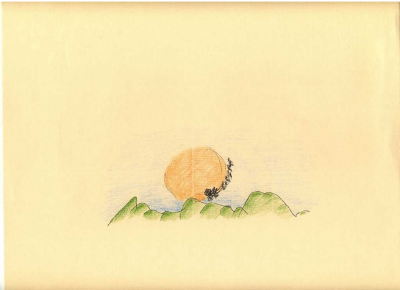
Il carro del sole, particolare della copertina del romanzo Lorenzo e Cecilia