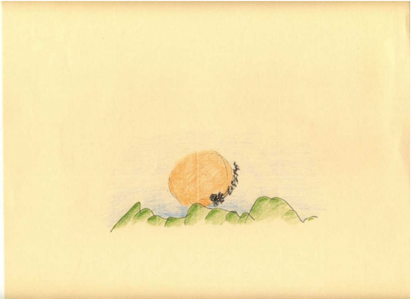
Il carro del sole, particolare della copertina del romanzo Lorenzo e Cecilia (disegno di Giuliano Scabia)

All'altezza cronologica di questi versi, composti tra il 1984 e il 1994, i quattro lati della scrittura di Scabia sono ormai saldamente serrati a formare quell'unico suo inconfondibile stilo, organico e mitopoietico, che è insieme lingua del paesaggio e paesaggio della lingua.