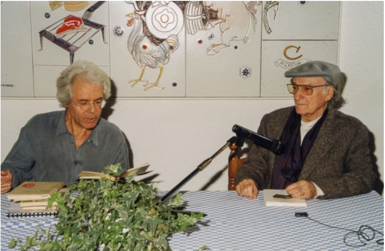
Scabia e Andrea Zanzotto

In visita al museo degli antichi venetici a Este, Lorenzo e Irene, protagonisti del romanzo breve In capo al mondo (Einaudi 1990), contemplano gli stili metallici, incisi «sui quattro lati in alfabeto un po' greco un po' etrusco», che servivano ai sacerdoti paleoveneti per scrivere sulla cera ma che erano essi stessi degli ex voto offerti a Reitia, la misteriosa dea madre di questo misterioso popolo di allevatori di cavalli: «[...] e le parole incise erano parte essenziale della dea, sua lingua e suo corpo», chiosa il narratore. Se chiamiamo Reitia con il suo nome generico e universale - Natura - possiamo considerare i quattro lati della scrittura di Giuliano Scabia - poesia, prosa, drammaturgia, azione teatrale (sì, anche l'azione teatrale) - come lo stilo con cui l'autore padovano incide le sue figure della medesima divinità. E lo stilo stesso - la scrittura - si rivela dunque corpo e sonda della natura, sua lingua dalle segrete corrispondenze e pronunce. Voce della natura. O più esattamente - perché la visione è pur sempre mediata dalla prospettiva romantica - del paesaggio. Quel paesaggio da cui la scrittura degli autori veneti è sempre profondamente pervasa.