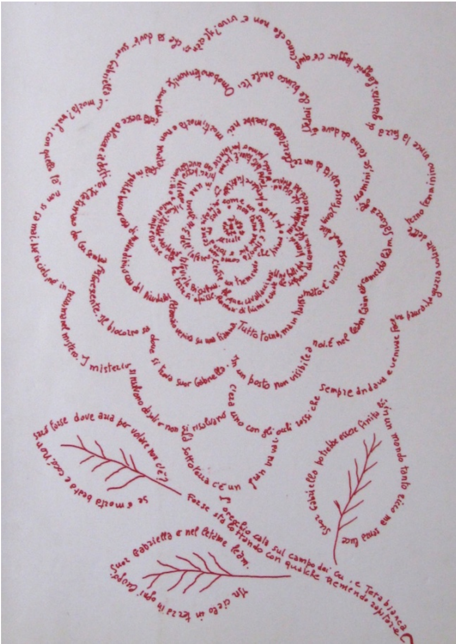
Disegno di Giuliano Scabia per la copertina di Le foreste sorelle , secondo romanzo della trilogia di Nane Oca

Il veneto, nella sua larga variante padovana, viene così recuperato come un tessuto linguistico in cui s'intrecciano anche fibre organiche di pavano ruzantiano e inserti multicolori della stralingua, quel «parlato segreto e manifesto in uso e basso giacente (quale substrato) al pavante e a qualsivoglia altro rovescio mondo», secondo la definizione proposta dall'autore ( Il tremito. Che cos'è la poesia , Casagrande 2006). E su questa base il plurilinguismo scabiano può parodiare e agglutinare qualsiasi materiale linguistico nella sua elocutio composita e scanzonata, dal latinorum alle battute in inglese e tedesco, dalle rivisitazioni del genere bucolico - quanta virgiliana natura, spesso riletta con Zanzotto, nei versi e nelle prose di Scabia - all'epica cavalleresca, dai lacerti di