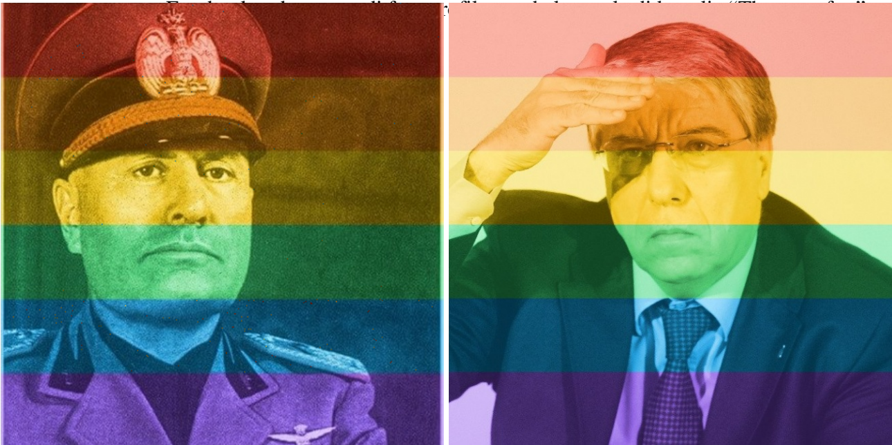
Benito Mussolini, Carlo Giovanardi

Ha del poetico che il primo tra i miei contatti Facebook a cui avevo visto postare, sabato 27 giugno, una foto arcobalenata (peraltro un Giovanardi , quando quindi il meme era già entrato nella sua fase caricaturale), sia anche il primo a toglierla, caricando come foto profilo, all'1:26 di giorno 28, una normale selfie scattata con la webcam. Alle 10:30 di domenica, la mia home si presenta ormai del tutto de-arcobalenizzata, fatta eccezione per le piccole e lontane chiazze colorate che sono le miniature delle foto profilo di pochi stoici. Il sito satirico Spinoza sintetizza efficacemente la dialettica prima-dopo con un disegno che mostra un