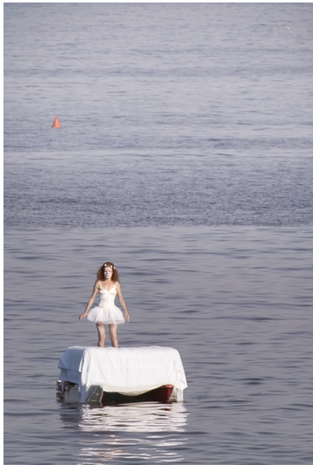
Metamorfosi, Orfeo e Euridice