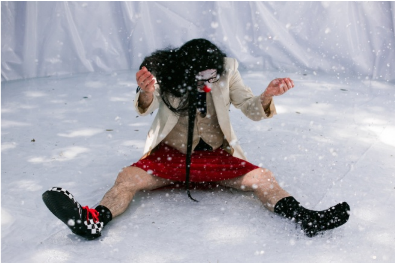
Metamorfosi, Narciso, ph. Futura Tittaferrante

Parla come un poeta, anzi come il più grande di tutti i poeti – e di tutti i musicisti – e mentre il suo discorso avanza lo spettatore sente mutare la stessa percezione del luogo in cui si trova: la spiaggia su cui siede è la riva di un grande fiume, il mare che si distende di fronte a lui è lo Stige infernale, il sipario è la porta aperta sugli inferi e lui stesso è uno degli appartenenti alla corte di Persefone e di suo marito, il signore che, come scrive Ovidio, regge lo squallido regno dei morti... È una magia metamorfica capziosa che sfida persino il cinema perché regola la distanza delle proprie illusioni direttamente sullo spettatore. Lontani, i clown parlano al nostro sguardo come gli elementi di una composizione pittorica smossa dalla musica: appartengono decisamente a un altro mondo. Vicini e sporgenti, a pochi passi da noi, lasciano che la voce e la parola si surriscaldino fino a sciogliere la cera della loro finzione e attraverso il velo leggero che ancora ci divide da loro, ci rimettono in contatto o per meglio dire all'ascolto del mito.