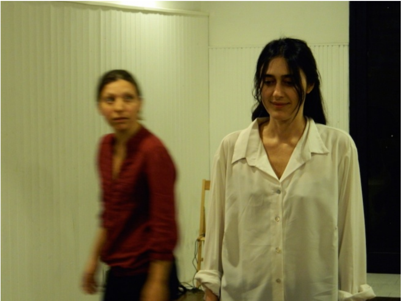
Il gabbiano, Ventriglia