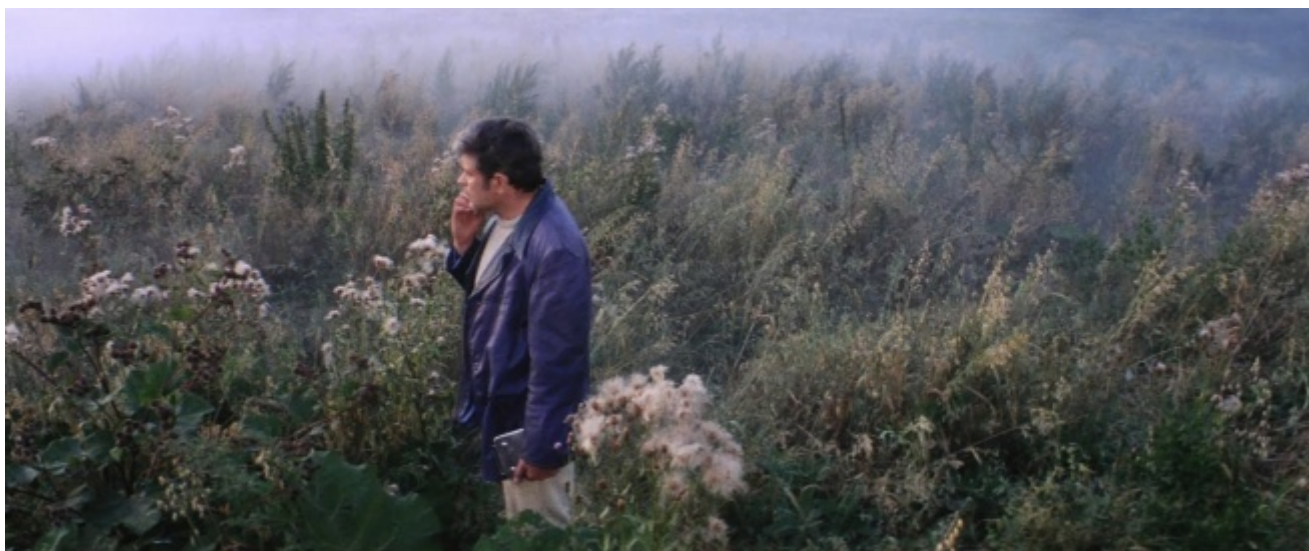
Dal film Solaris Andrej Tarkovskij, 1972

Innanzitutto va detto che in entrambi i casi si tratta di letture insieme affabili, eleganti e istruttive, che sollecitano riflessioni di ampio respiro partendo – secondo i canoni del genere saggistico – da impostazioni dichiaratamente soggettive. In secondo luogo, né l'uno né l'altro inducono all'ottimismo; nel primo circolano umori malinconici e tendenti allo sconforto, nel secondo prevale una perplessità smarrita, talvolta attonita. Peraltro, i due titoli sono orientati in maniera opposta. L'espressione «stato di minorità» designa la condizione in cui, a giudizio di Giglioli, ci troviamo, o pensiamo di trovarci; i «destini generali» rappresentano invece gran parte di quello che, secondo Mazzoni, è sfuggito al nostro orizzonte – e che dovremmo adoperarci per recuperare, se solo sapessimo come.