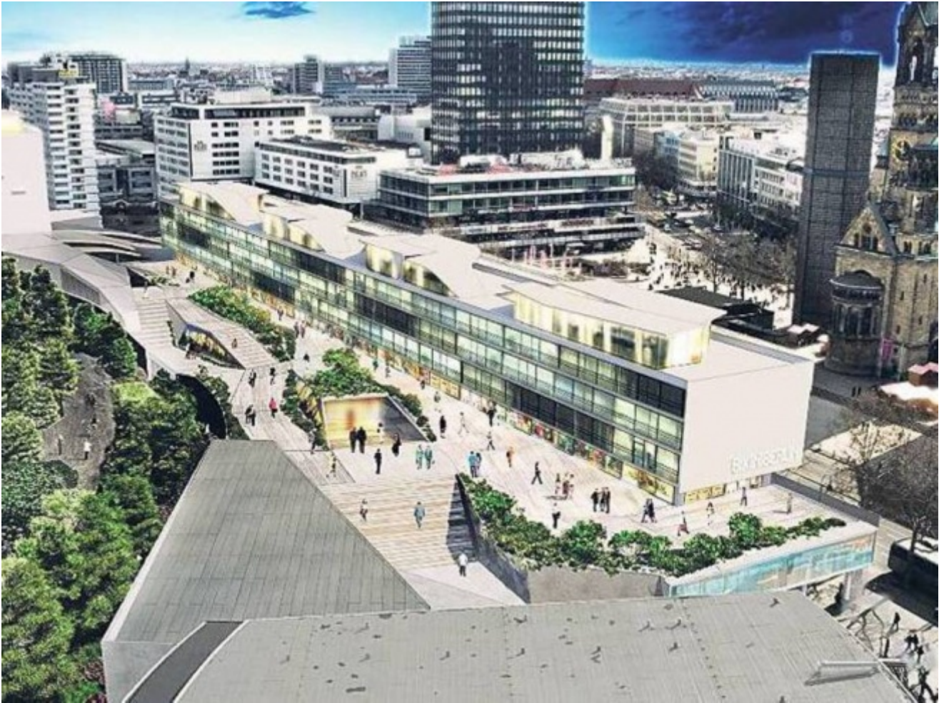
Progetto del Bikini

definitivamente archiviato come curioso incidente storico, c'è stato il ritorno su più fronti della vecchia Berlino Ovest. In primo luogo un vero e proprio ritorno fisico, con una serie di investimenti e recuperi nel centro occidentale, soprattutto attorno alla stazione di Zoo (tristemente famosa negli anni Settanta, declassata dopo l'unificazione da stazione centrale a snodo regionale), con il recupero, per esempio, di un edificio simbolo degli anni Cinquanta, il cosiddetto Bikini, trasformato in un centro commerciale di lusso, con zone verdi aperte al pubblico e ristoranti con spazi espositivi.