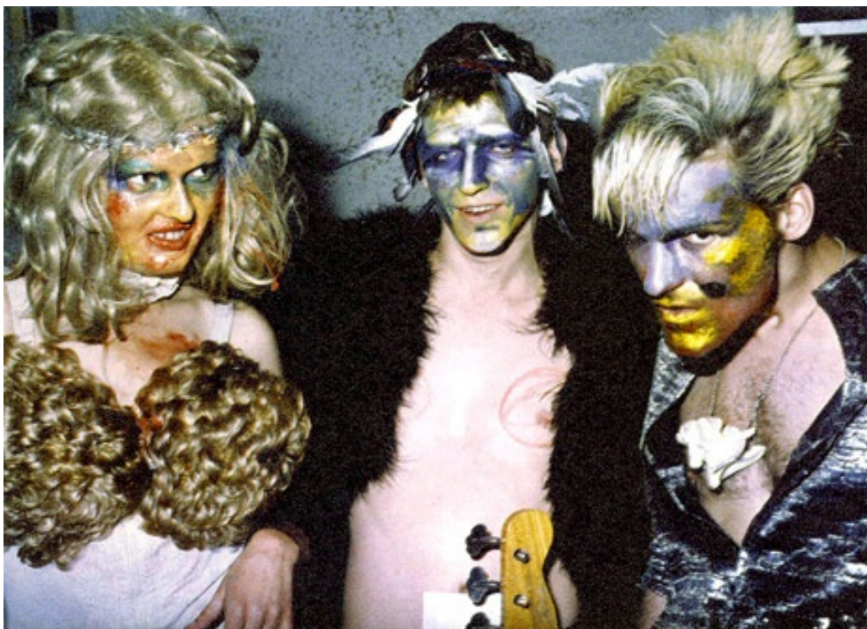
Die Tödliche Doris

Su questa ‘terra di nessuno’ si svilupparono quelle tante e varie forme sociali che ne fecero una città “in cui niente era normale”. Non a caso, fra le tante memorie, è proprio quella dei sovversivi anni Ottanta a essere risorta con maggiore visibilità, con una serie di libri autobiografici e di narrazioni storiche in parte autobiografiche, dai titoli significativi come, entrambi del 2014, Paradiso tra due fronti ( Paradies zwischen den Fronten ) del giornalista Rudolf Lorenzen o La subcultura a Berlino Ovest 1979-1989 ( Subkultur Westberlin 1979-1989 ) di Wolfgang Müller, fondatore nel 1980 di un gruppo artistico-musicale dal nome pittoresco Die Tödliche Doris , La mortifera Doris .