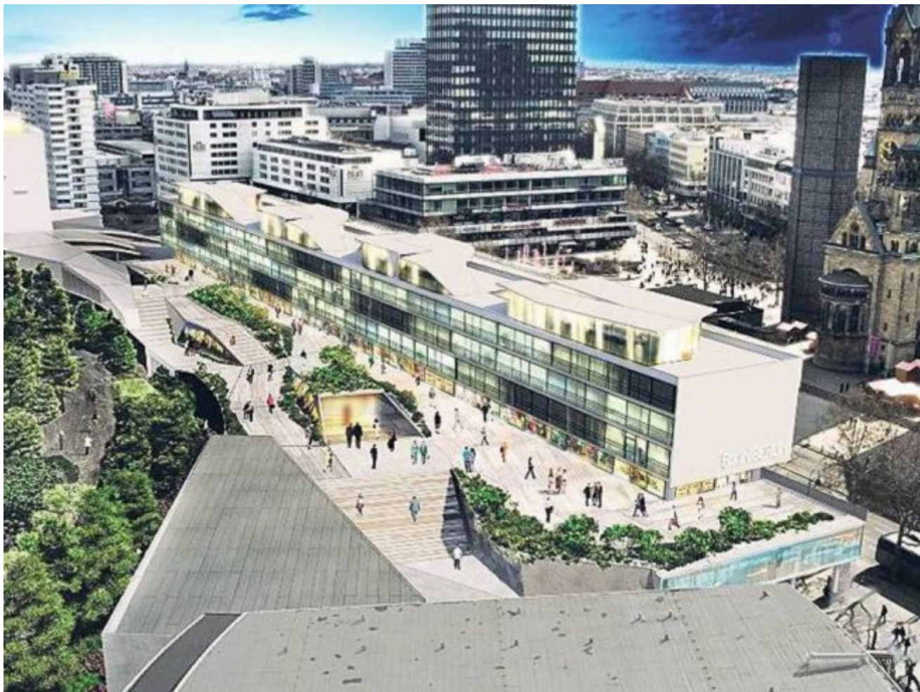
Progetto del Bikini

definitivamente archiviato come curioso incidente storico, c'è stato il ritorno su più fronti della vecchia Berlino Ovest. In primo luogo un vero e proprio ritorno fisico, con una serie di investimenti e recuperi nel centro occidentale, soprattutto attorno alla stazione di Zoo (tristemente famosa negli anni Settanta, declassata dopo l'unificazione da stazione centrale a snodo regionale), con il recupero, per esempio, di un edificio simbolo degli anni Cinquanta, il cosiddetto Bikini, trasformato in un centro commerciale di lusso, con zone verdi aperte al pubblico e ristoranti con spazi espositivi.