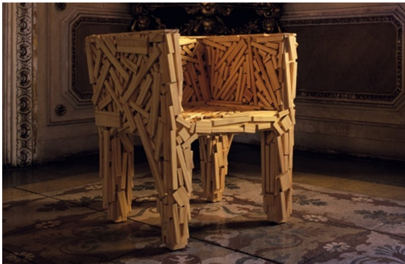
Fernando e Humberto Campana, poltrona Favela

È un'arte domestica e parca quella che cucina e serve in piatti nuovi gli avanzi del giorno prima; che sminuzza e mette insieme i resti ancora buoni dentro impasti saporiti, aggiungendo il poco che basta a rifarne la consistenza, a ricostruirne la forma e la testura, per offrirle come cose grate all'occhio e al palato. Il design del tempo della crisi ne ricalca i passi, o cerca di farlo, ne riprende da vicino i gesti e le attitudini, come se le ragioni intime del progetto rispondessero volentieri al richiamo di quella disposizione parsimoniosa, di una premura contraria allo spreco: e qui, secondo antiche ricette di massaia, va provando nuovi modi di produrre cose con le cose rimaste, di far progetti e prodotti con i residui della produzione.