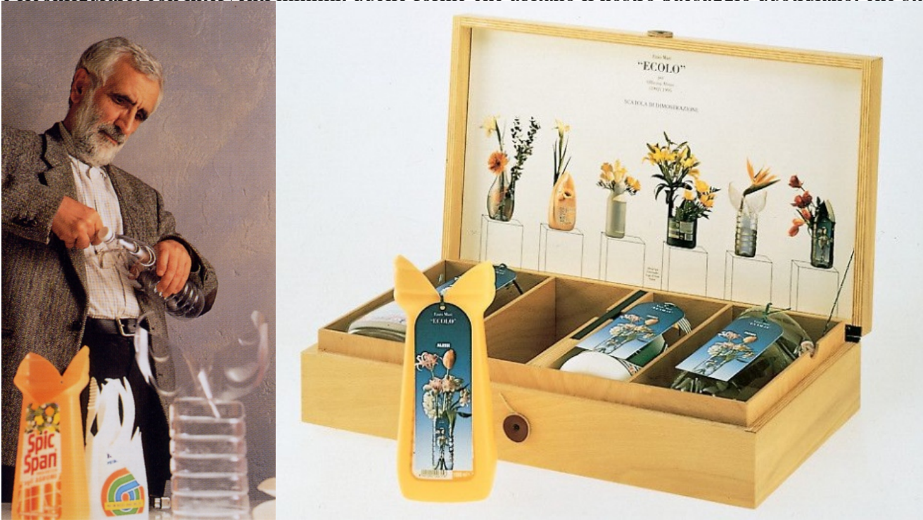
Enzo Mari, Ecolo - per "una convivenza non equivoca con il degrado dei nostri giorni"

e riconfigurare, con interventi minimi, quelle forme che abitano il nostro paesaggio quotidiano, che stanno lì