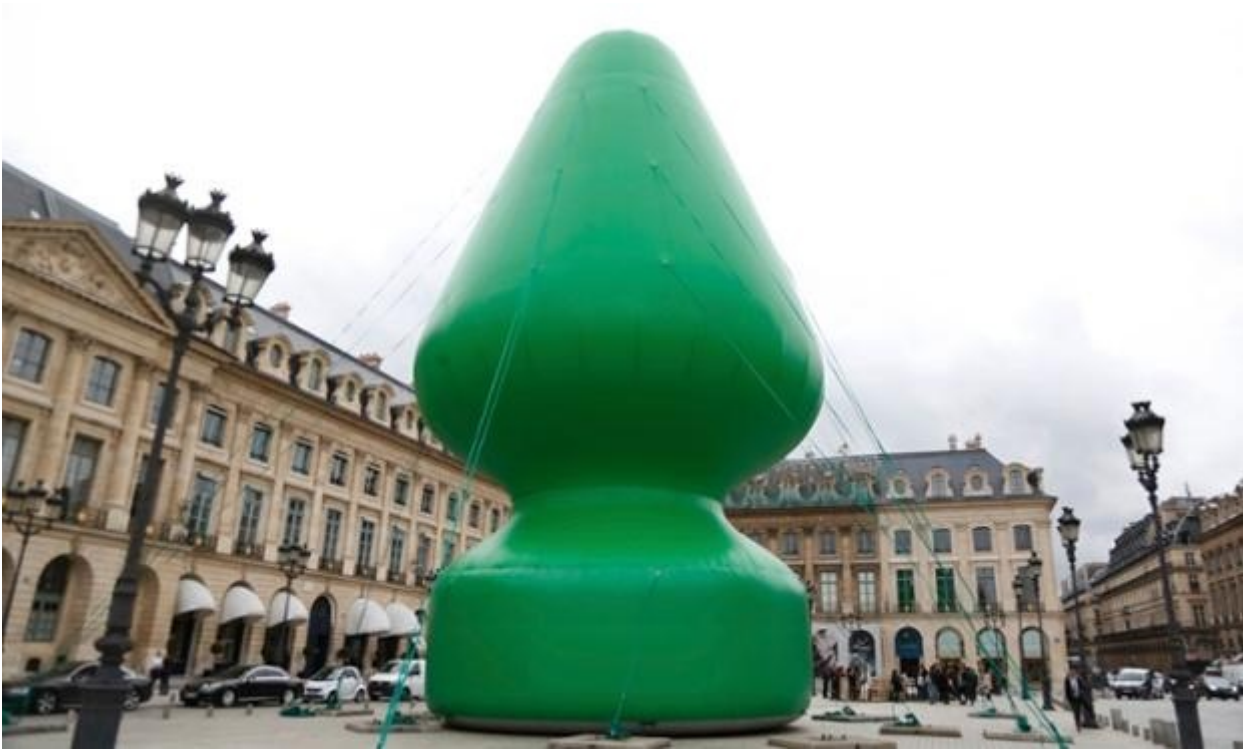
Paul McCarthy, Tree , Place Vendôme, 2014,

Il caos ha risposto all'invito: come l'aquilone di McCarthy, sgonfiato e reciso, privato del suo potere fallico, il 17 giugno la scultura di Kapoor era macchiata da schizzi di pittura gialla. Il vandalo inseminatore è rimasto anonimo. Mentre la stampa s'interrogava sulla vague pudibonda della società francese, su " Le Figaro " (era da tempo che questo quotidiano non consacrava tanto spazio all'arte contemporanea) Kapoor attribuiva il vile gesto a un gruppuscolo nostalgico del passato sacralizzato della nazione.