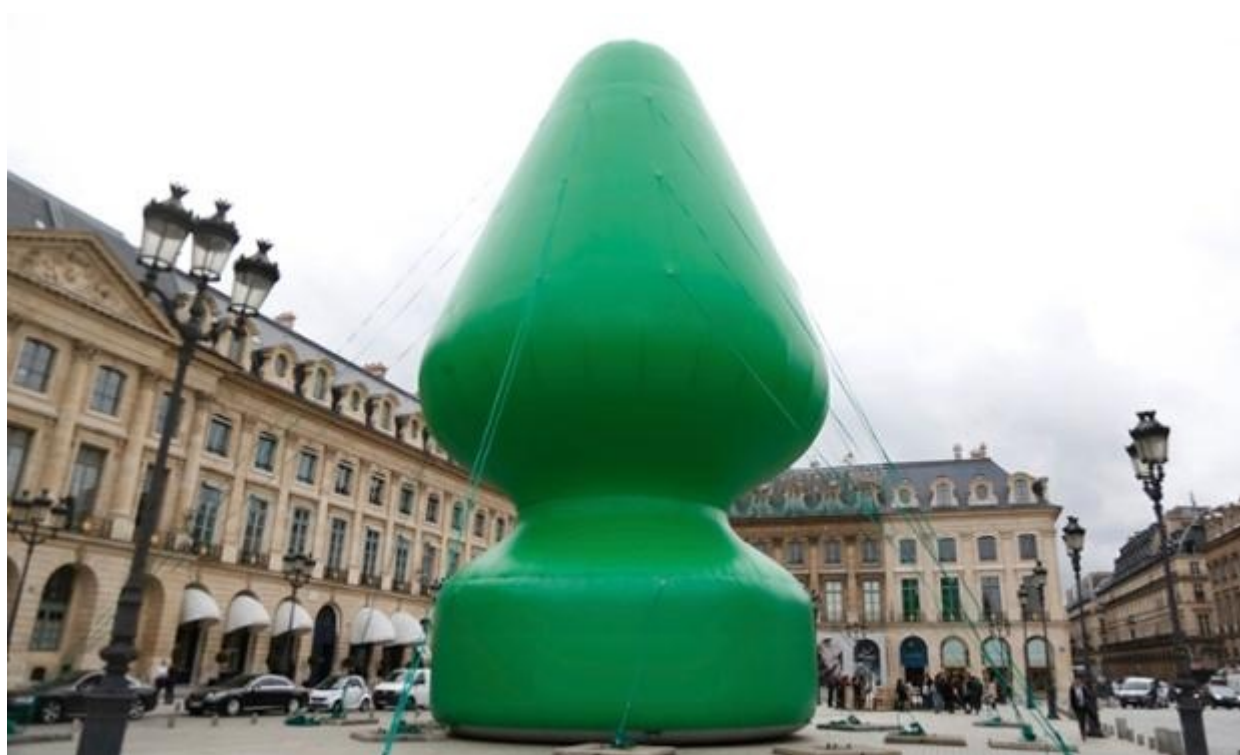
Paul McCarthy, Tree, Place Vendôme, 2014,

A pochi mesi dall'affaire Paul McCarthy, con il suo anal plug eretto al centro dell'elegante Place Vendôme (vedi Jeff Koons è un aspirapolvere ), Anish Kapoor – estraneo allo spirito di provocazione che segna la carriera di McCarthy – espone a Versailles. Dirty Corner è una scultura d'acciaio, un tunnel rosso ruggine lungo 60 metri, protetto da enormi blocchi di pietra di 25 tonnellate. Già presentata alla Fabbrica del Vapore di Milano nel 2011, è ora installata nei giardini regali. In un'intervista rilasciata prima dell'apertura al Journal du dimanche , Kapoor ha dichiarato trattarsi della “vagina della Regina che prende il potere” e che mira a “bouleverser l'équilibre” e “inviter le chaos”, insomma la vendetta di Marie-Antoinette.