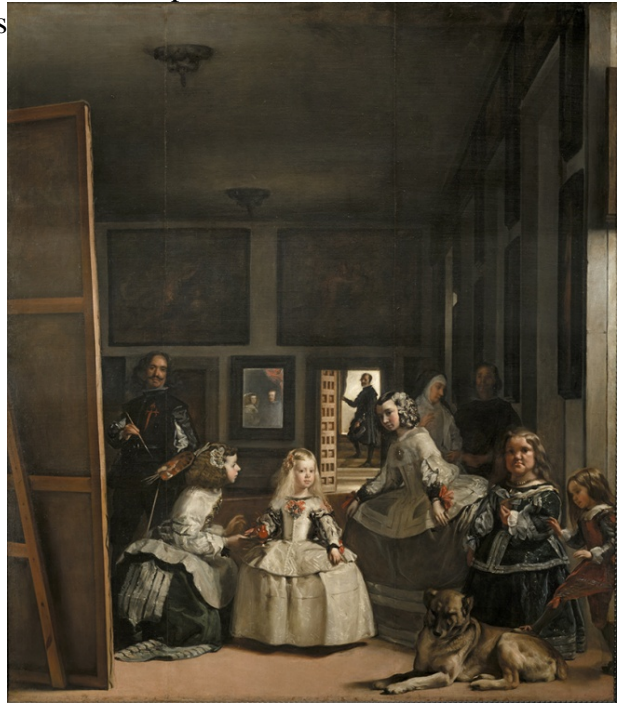
Da sinistra: Picasso, Les Femmes d'Alger , 1911-12; Diego Velázquez, Las Meninas , 1656

L'attenzione critica veniva spostata dal cosa è dipinto al come, alla tecnica utilizzata; il contenuto non era considerato rilevante. Una lettura che si è imposta nonostante il suo limite: Les Femmes d'Alger contava più per quanto presagiva – l'avvento e l'avventura del Cubismo – che per quanto effettivamente realizzava. Per Alfred H. Barr – primo direttore del MoMA e curatore della celebre retrospettiva Picasso. Forty Years of His Art – era un dipinto allegorico, un memento mori; il suo sguardo occhialuto non vi vedeva altro che “five of the least seductive female nudes in the history of art”. Per il collezionista Daniel-Henry Kahnweiler era un dipinto incompleto, con uno scarto tra la metà sinistra e la metà destra.