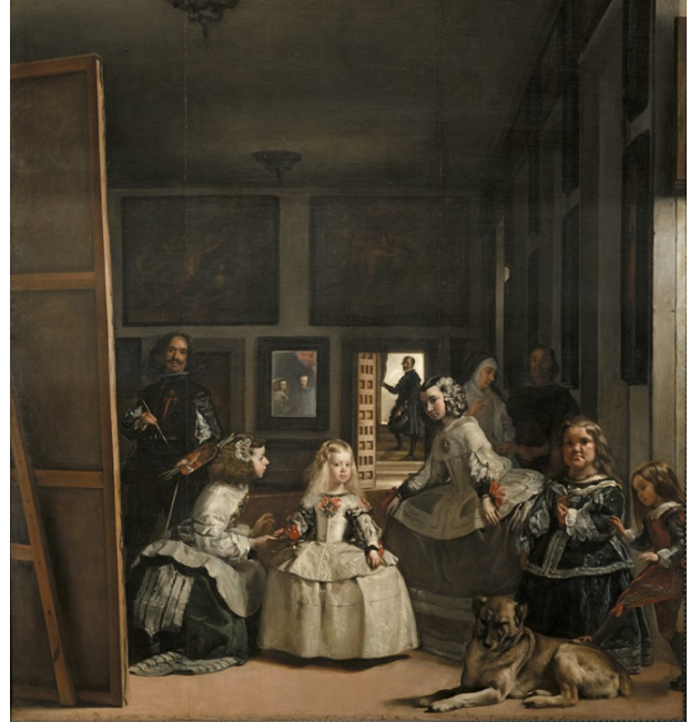
Da sinistra: Picasso, Les desmoiselles d'Avignon , 1907; Diego Velázquez, Las Meninas , 1656

L'attenzione critica veniva spostata dal cosa è dipinto al come, alla tecnica utilizzata; il contenuto non era considerato rilevante. Una lettura che si è imposta nonostante il suo limite: Les Demoiselles d'Avignon contava più per quanto presagiva – l'avvento e l'avventura del Cubismo – che per quanto effettivamente realizzava. Per Alfred H. Barr – primo direttore del MoMA e curatore della celebre retrospettiva Picasso. Forty Years of His Art – era un dipinto allegorico, un memento mori; il suo sguardo occhialuto non vi vedeva altro che “five of the least seductive female nudes in the history of art”. Per il collezionista Daniel-Henry Kahnweiler era un dipinto incompleto, con uno scarto tra la metà sinistra e la metà destra.