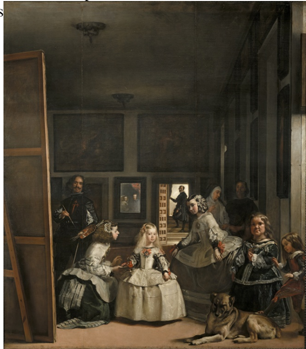
Da sinistra: Picasso, Les desmoiselles d'Avignon , 1907; Diego Velázquez, Las Meninas , 1656

L'attenzione critica veniva spostata dal cosa è dipinto al come, alla tecnica utilizzata; il contenuto non era considerato rilevante. Una lettura che si è imposta nonostante il suo limite: Les Femmes d'Alger contava più per quanto presagiva – l'avvento e l'avventura del Cubismo – che per quanto effettivamente realizzava. Per Alfred H. Barr – primo direttore del MoMA e curatore della celebre retrospettiva Picasso. Forty Years of His Art – era un dipinto allegorico, un memento mori; il suo sguardo occhialuto non vi vedeva altro che “five of the least seductive female nudes in the history of art”. Per il collezionista Daniel-Henry Kahnweiler era un dipinto incompleto, con uno scarto tra la metà sinistra e la metà destra.