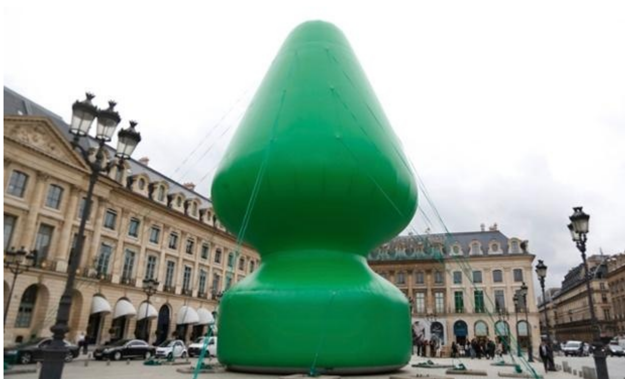
Paul McCarthy, Tree, Place Vendôme, 2014,

A pochi mesi dall'affaire Paul McCarthy, con il suo anal plug eretto al centro dell'elegante Place Vendôme (vedi Jeff Koons è un aspirapolvere ), Anish Kapoor – estraneo allo spirito di provocazione che segna la carriera di McCarthy – espone a Versailles. Dirty Corner è una scultura d'acciaio, un tunnel rosso ruggine lungo 60 metri, protetto da enormi blocchi di pietra di 25 tonnellate. Già presentata alla Fabbrica del Vapore di Milano nel 2011, è ora installata nei giardini regali. In un'intervista rilasciata prima dell'apertura al Journal du dimanche , Kapoor ha dichiarato trattarsi della “vagina della Regina che prende il potere” e che mira a “bouleverser l'équilibre” e “inviter le chaos”, insomma la vendetta di Marie-Antoinette.