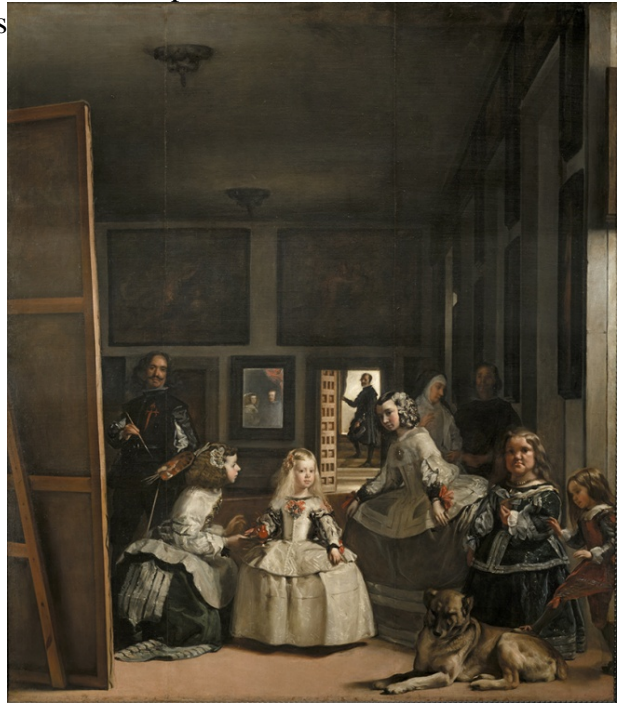
Da sinistra: Picasso, Les desmoiselles d'Avignon , 1907; Diego Velázquez, Las Meninas , 1656

L'attenzione critica veniva spostata dal cosa è dipinto al come, alla tecnica utilizzata; il contenuto non era considerato rilevante. Una lettura che si è imposta nonostante il suo limite: Les Femmes d'Alger contava più per quanto presagiva – l'avvento e l'avventura del Cubismo – che per quanto effettivamente realizzava. Per Alfred H. Barr – primo direttore del MoMA e curatore della celebre retrospettiva Picasso. Forty Years of His Art – era un dipinto allegorico, un memento mori; il suo sguardo occhialuto non vi vedeva altro che “five of the least seductive female nudes in the history of art”. Per il collezionista Daniel-Henry Kahnweiler era un dipinto incompleto, con uno scarto tra la metà sinistra e la metà destra.