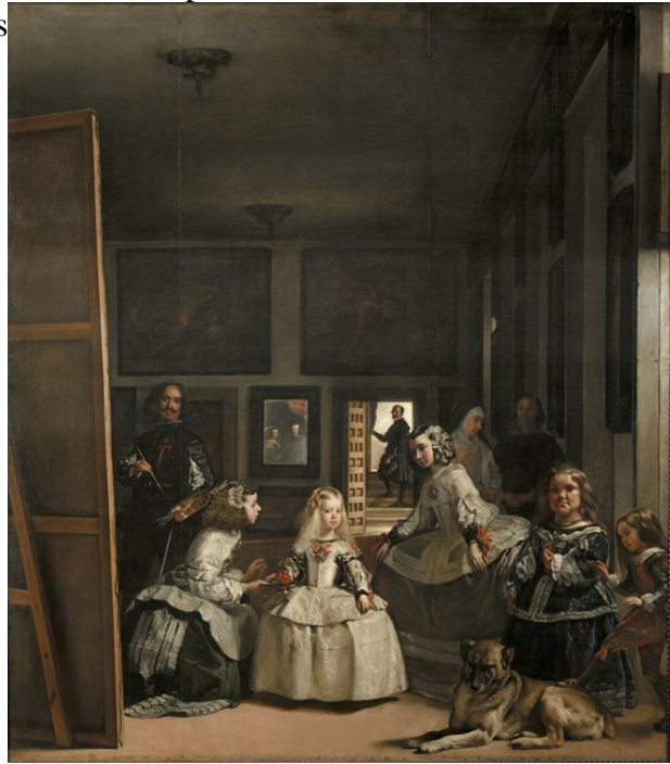
Da sinistra: Picasso, Les Femmes d'Alger , 1907; Diego Velázquez, Las Meninas , 1656

L'attenzione critica veniva spostata dal cosa è dipinto al come, alla tecnica utilizzata; il contenuto non era considerato rilevante. Una lettura che si è imposta nonostante il suo limite: Les Femmes d'Alger contava più per quanto presagiva – l'avvento e l'avventura del Cubismo – che per quanto effettivamente realizzava. Per Alfred H. Barr – primo direttore del MoMA e curatore della celebre retrospettiva Picasso. Forty Years of His Art – era un dipinto allegorico, un memento mori; il suo sguardo occhialuto non vi vedeva altro che “five of the least seductive female nudes in the history of art”. Per il collezionista Daniel-Henry Kahnweiler era un dipinto incompleto, con uno scarto tra la metà sinistra e la metà destra.