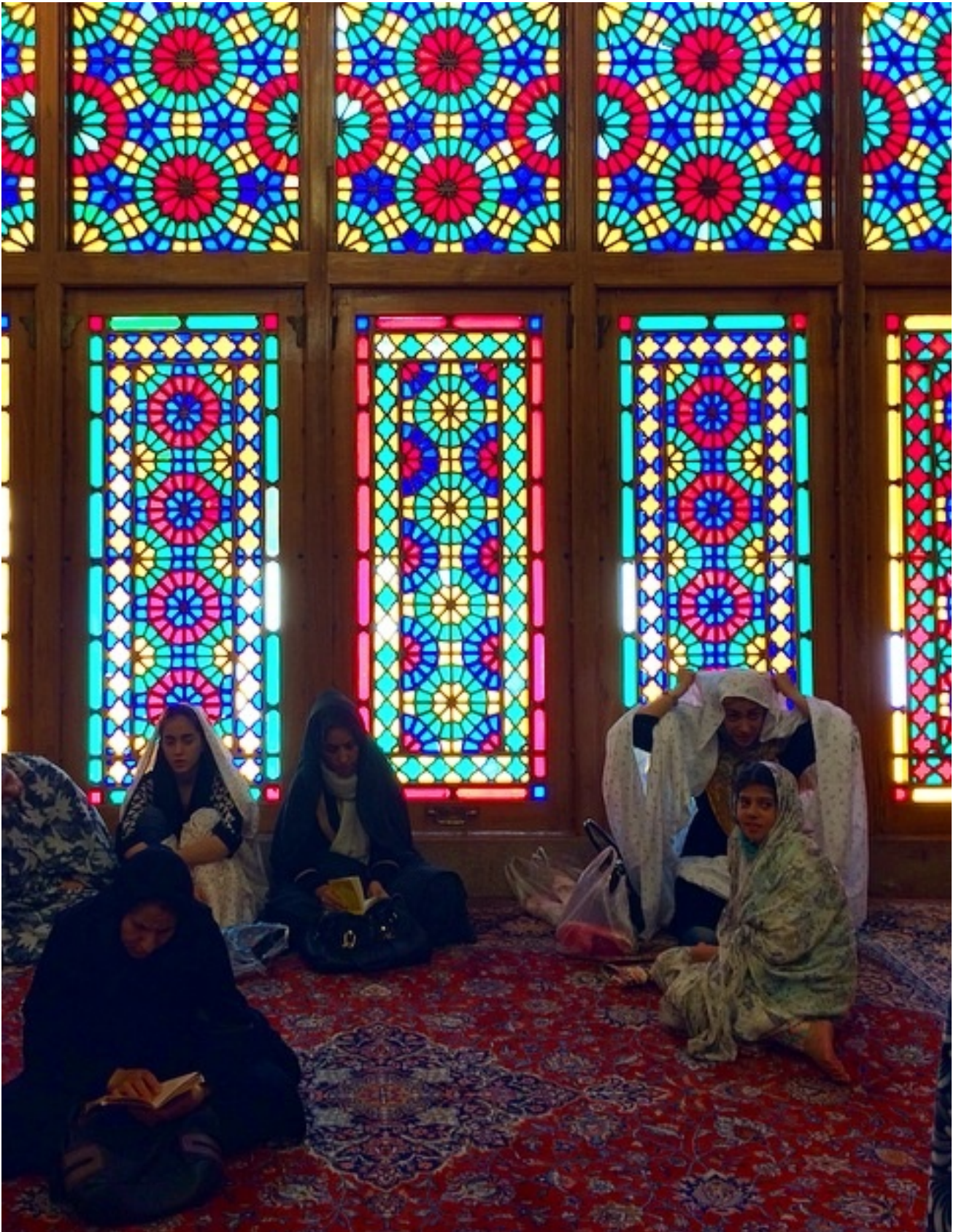
Donne che pregano a Shah Ceragh, Shiraz; ph. Francesca Ledda