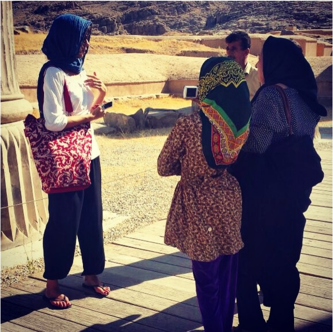
Fotografate tra Shiraz e Persepoli

L'enigma dell'innocenza e dello stupore. Credo sia questo tra queste vie a far germinare qualcosa che sembra una nuova possibilità. Rappresentiamo l'occidente. L'altro.