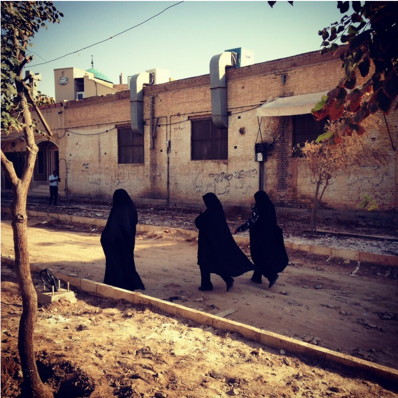
Differenze per le strade di Yazd

Vestiamo quel misto di curiosità e dolcezza e ironica allegria e commozione che si ha tra cose troppo distanti. L'euforia sciocca e dolce dell'ingenuo. Sembra facile qui, qui dove la loro curiosità diventa la tua, e ti pare di poterti ricordare con precisione del tempo in cui sei stato al mondo in quel modo lì, toccando le cose per conoscerle. Non si può fare altrimenti.