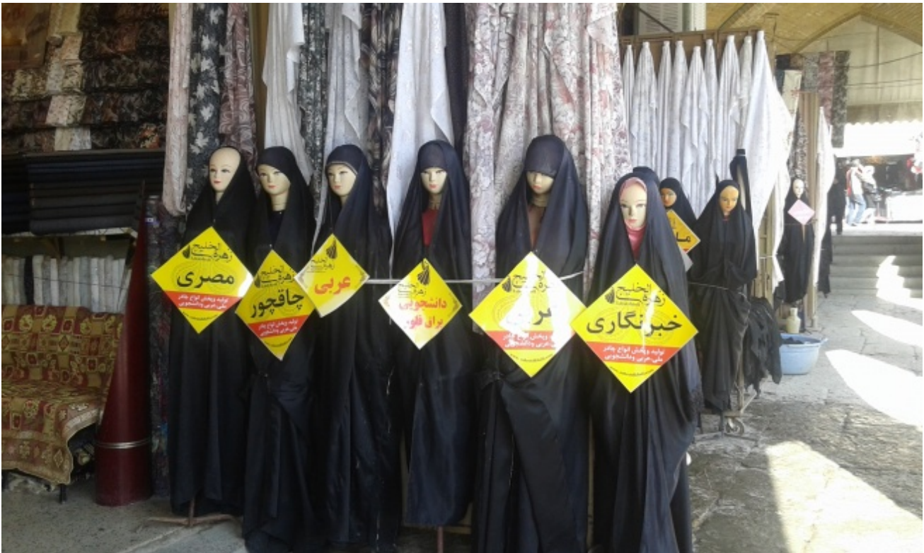
Bazar, Theran

Ma cosa contiene quella sicurezza? È pudore? È l'imbarazzo che immagina porterebbe il vestire una differenza evidente? È desiderio di riservare la sua bellezza all'intimità soltanto degli sguardi innamorati? Al sicuro da cosa? E noi come ci siamo sentite percorrendo queste strade? Guardate, fotografate, abbiamo avuto paura?