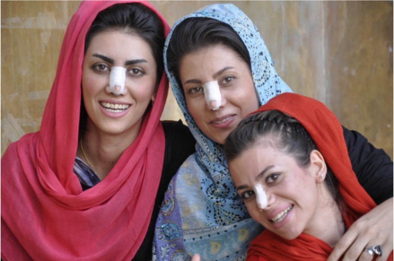
Tantissime le donne, per le strade, con i segni evidenti di una recente rinoplastica, Eisfahan; ph. centochilometri

Ce lo siamo domandate per le strade di Teheran, sorridendo del loro chiederci una foto insieme a loro - donne, ragazze, famiglie intere - e facendo del nostro essere dive fotografate cento volte al giorno uno dei leitmotiv del viaggio.