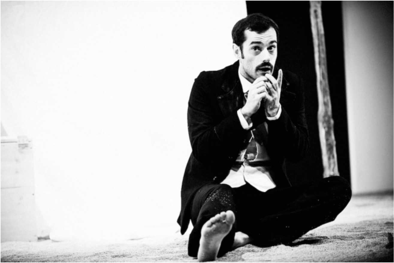
Ballata per Giufà

gli sforzi sovrumani dello 'scemo del villaggio' di affermare che la libertà è il fiore che muove il viaggio e l'altre storie. La via del racconto, la possibilità per gli attori di aggrapparsi a stati d'animo che sanno riconoscere e perciò trasmettere, può rappresentare per la Compagnia Festival Orizzonti una delle direzioni per incontrare la qualità.