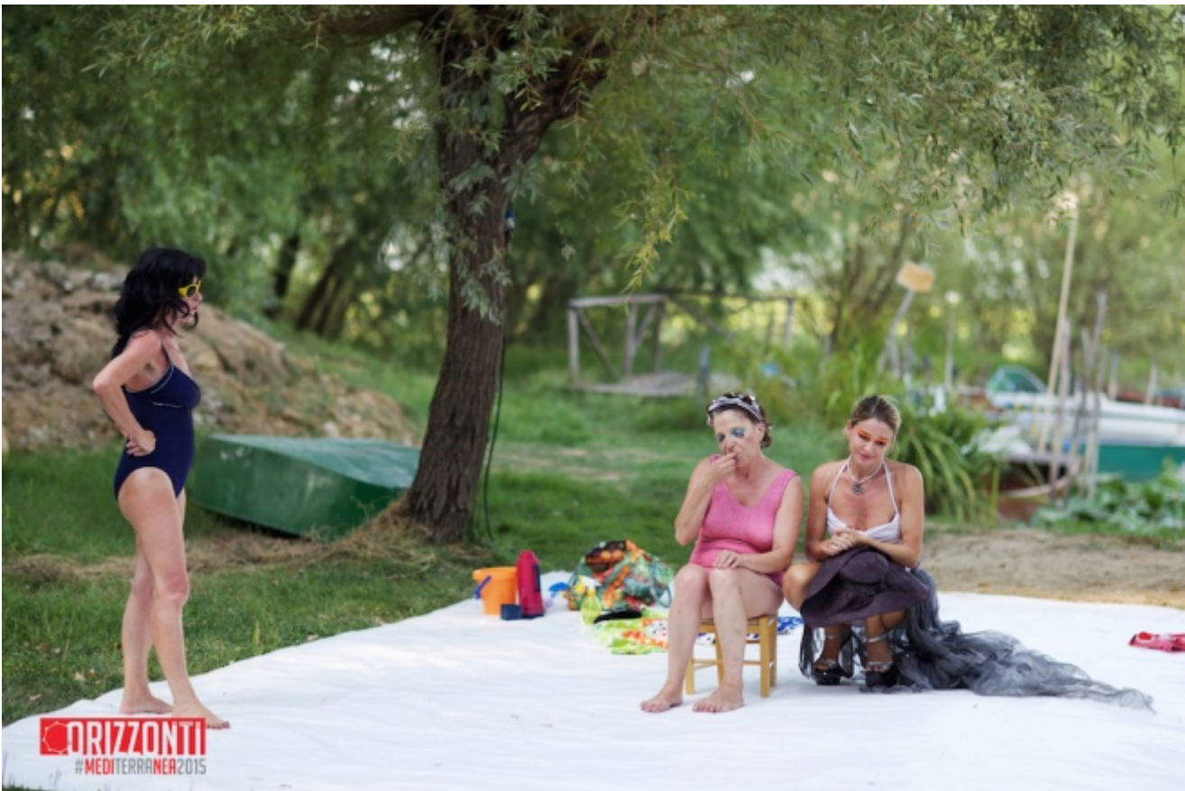
L'omosessuale o la difficoltà di esprimersi