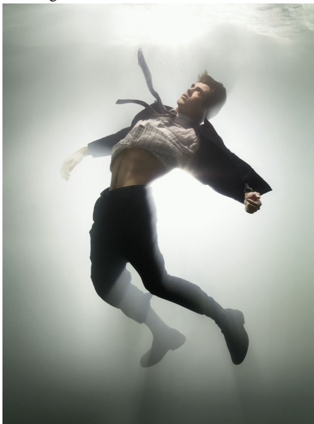
Da sinistra: David LaChapelle, Anonymous Politicians , 2012; The Awakened, Job , 2007