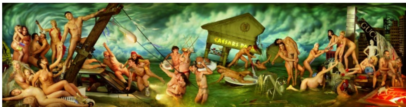
David LaChapelle, Deluge , 2006

La fine di una civiltà porta sempre con sé un cumulo di macerie, cadaveri, rovine semi carbonizzate di un'epoca colma di corpi e oggetti. Dopo il Diluvio , retrospettiva sul lavoro di David LaChapelle in mostra fino al 13 settembre al Palazzo delle Esposizioni di Roma, cattura in immagini il crollo fantasticato della nostra cultura ipermediatica e lo racconta secondo quello che a prima vista potrebbe essere considerato il canone estetico più diffuso del nostro tempo, ovvero quello di una società dello spettacolo estremamente fotoritoccata. La trasposizione nel contesto del presente di un'icona o un topos narrativo sedimentati nella coscienza culturale è un evento necessario per estrapolare dal passato quei dati emotivi o concettuali che continuano ad agire dentro l'essere umano; e la morte di una civiltà presuppone, ben più degli specifici decessi biologici, la fine delle idee, dei pensieri, e soprattutto della capacità di immaginazione di un popolo, lasciando solo i resti dei prodotti culturali da esso realizzati. In Il diluvio , David LaChapelle descrive la distruzione della nostra epoca come un'implacabile inondazione in cui le persone, annegate o semisommerse, possono trattenere della loro vita passata solo gli abiti che indossano, i corpi talora lucidi e palestrati che si sono costruiti, o quelli molli e grinzosi che gli sono capitati.