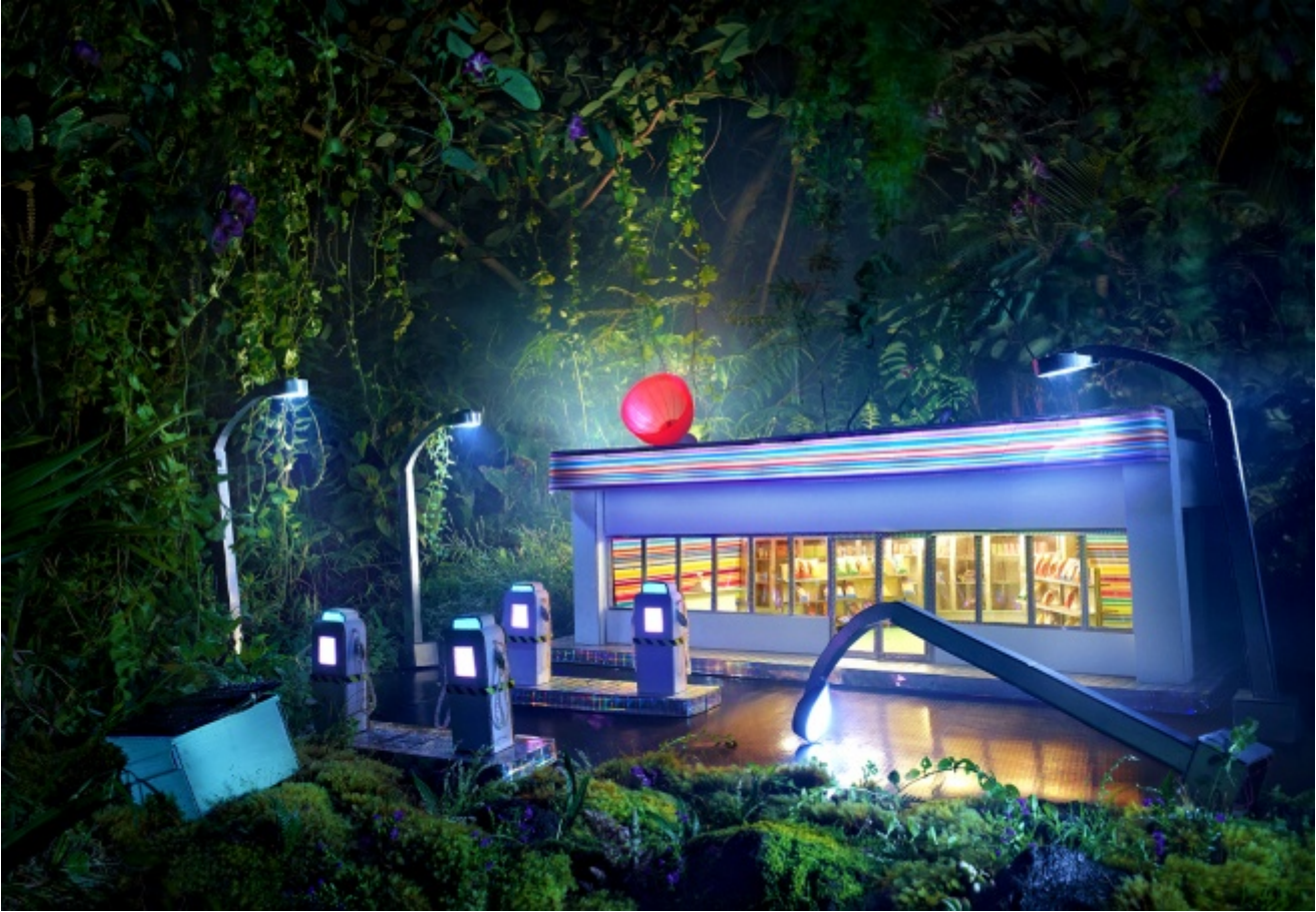
David LaChapelle, Gas am pm , 2012

commissione dopo molti anni di attività.