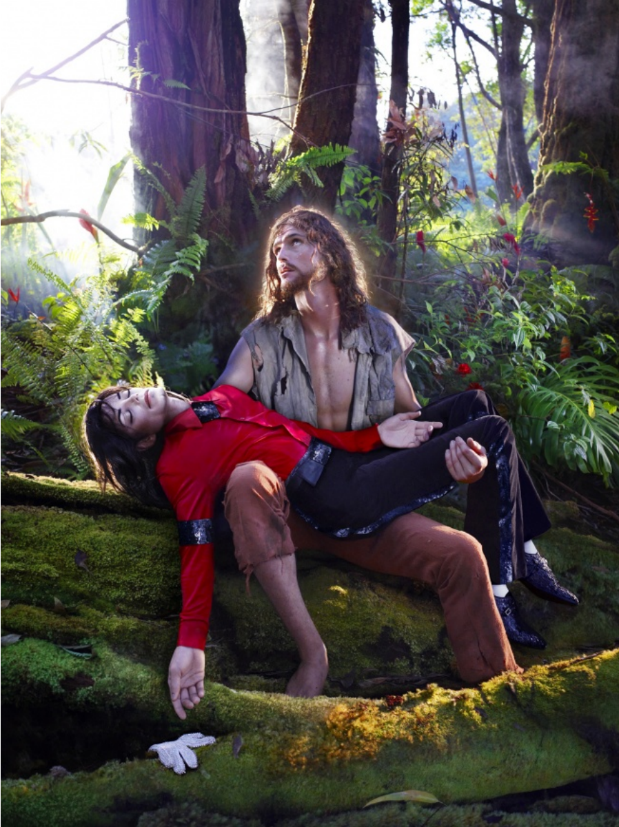
David LaChapelle, American Jesus , 2009