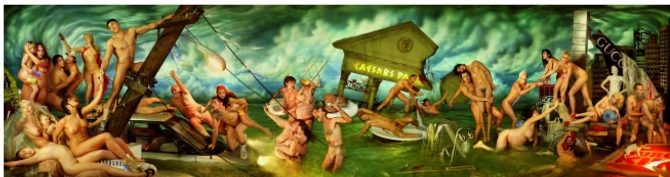
David LaChapelle, Deluge , 2006

La fine di una civiltà porta sempre con sé un cumulo di macerie, cadaveri, rovine semi carbonizzate di un'epoca colma di corpi e oggetti. Dopo il Diluvio , retrospettiva sul lavoro di David LaChapelle in mostra fino al 13 settembre al Palazzo delle Esposizioni di Roma, cattura in immagini il crollo fantasticato della nostra cultura ipermediatica e lo racconta secondo quello che a prima vista potrebbe essere considerato il canone estetico più diffuso del nostro tempo, ovvero quello di una società dello spettacolo estremamente fotoritoccata. La trasposizione nel contesto del presente di un'icona o un topos narrativo sedimentati nella coscienza culturale è un evento necessario per estrapolare dal passato quei dati emotivi o concettuali che continuano ad agire dentro l'essere umano; e la morte di una civiltà presuppone, ben più degli specifici decessi biologici, la fine delle idee, dei pensieri, e soprattutto della capacità di immaginazione di un popolo, lasciando solo i resti dei prodotti culturali da esso realizzati. In Il diluvio , David LaChapelle descrive la distruzione della nostra epoca come un'implacabile inondazione in cui le persone, annegate o semisommerse, possono trattenere della loro vita passata solo gli abiti che indossano, i corpi talora lucidi e palestrati che si sono costruiti, o quelli molli e grinzosi che gli sono capitati.