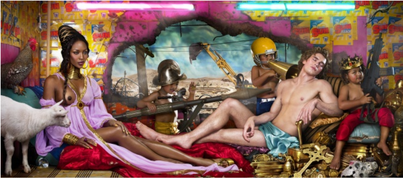
David LaChapelle, The Rape of Africa , 2009

soggetti scelti per interpretare immagini consacrate alla storia dell'arte. Come nei casi di Rape of Africa (2009), citazione dalla Venere e Marte di Sandro Botticelli (1483), oppure in Negative Currency, Car Crash (2008), opere realizzate in seguito alla crisi del 2008, come in My Own Marilyn (2002), dove i riferimenti alle serie One Dollar Bill e Death and Disaster , di Andy Warhol, sono evidenti.