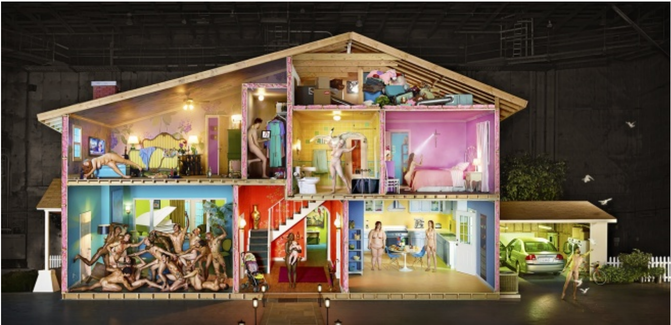
David LaChapelle, Self Portrait as a House, 2013