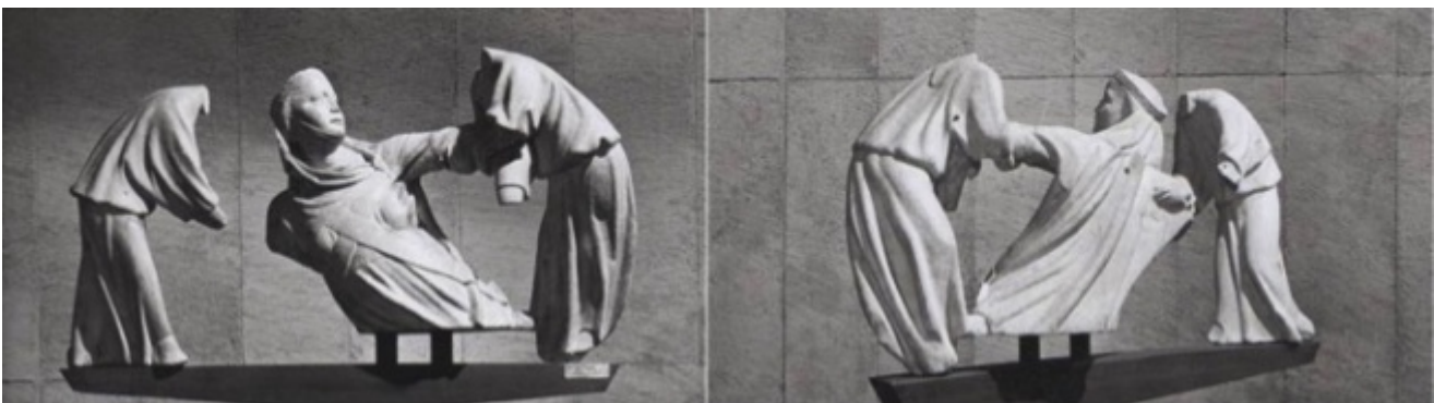
Il gruppo scultoreo collocato sul basamento telescopico girevole in acciaio, progettato da Franco Albini nel 1959 per l'allestimento nel museo di Palazzo Bianco a Genova, rimasto in uso fino al 1968.

Suggestionato dall'immagine evocata dalla nuvola, Giovanni concepì l' elevatio animae della regina composta da tre figure sveltanti verso l'alto. L'anima – simbolicamente da lui resa quale giovane e bellissima donna, velata e col soggolo secondo la moda dell'aristocrazia femminile tedesca, cinta della stola maiestatis , allusiva alla sua immortalità – era aiutata da due angeli apteri ad ascendere al cielo. Tensioni contrapposte, sia fisiche che emotive, animavano il gruppo, sapientemente orchestrate in un'unità di commossa grandezza interiore. Il tema della morte vi era affrontato in una chiave del tutto nuova e moderna. Non più intesa quale semplice trapasso, Giovanni volle tradurla in evento dinamico. Rese infatti l' assumptio animae et corporis della sovrana con un gioco di armonie e di curve, quasi una danza, che esprimeva la spinta trascendentale verso l'ultraterreno, sublimantesi nell'espressione estatica del viso di lei.