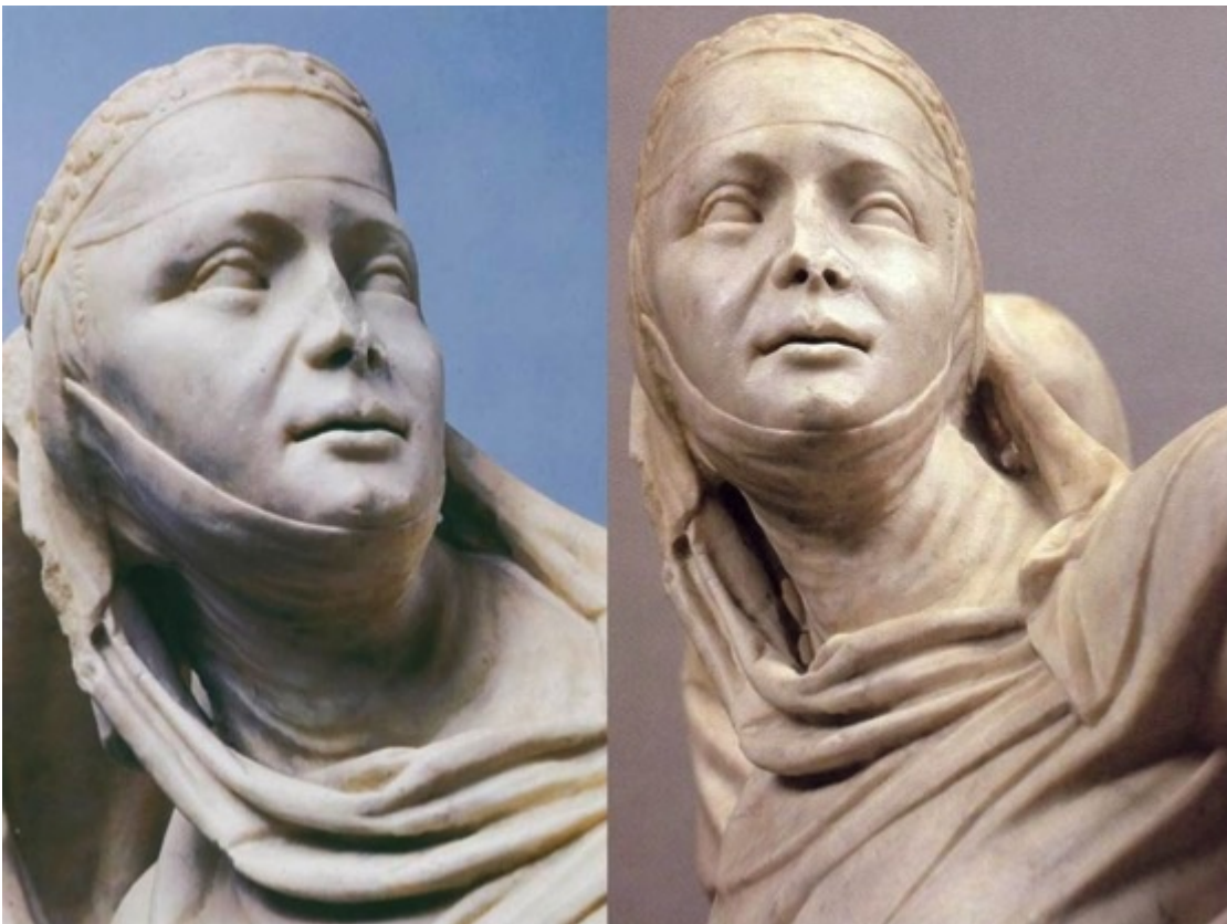
Giovanni Pisano, Monumento sepolcrale di Margherita di Lussemburgo, 1313-1314

Trasfigurò Margherita, conferendole una bellezza spirituale e sensuale al contempo. Ne idealizzò il volto in un ovale perfetto. Le labbra morbide e la bocca dischiusa, ne immortalò l'espressione di stupore, mentre risvegliatasi alla vita eterna, rivolgeva al Cielo che la stava per accogliere uno sguardo quasi incredulo e un sorriso grato e fiducioso.