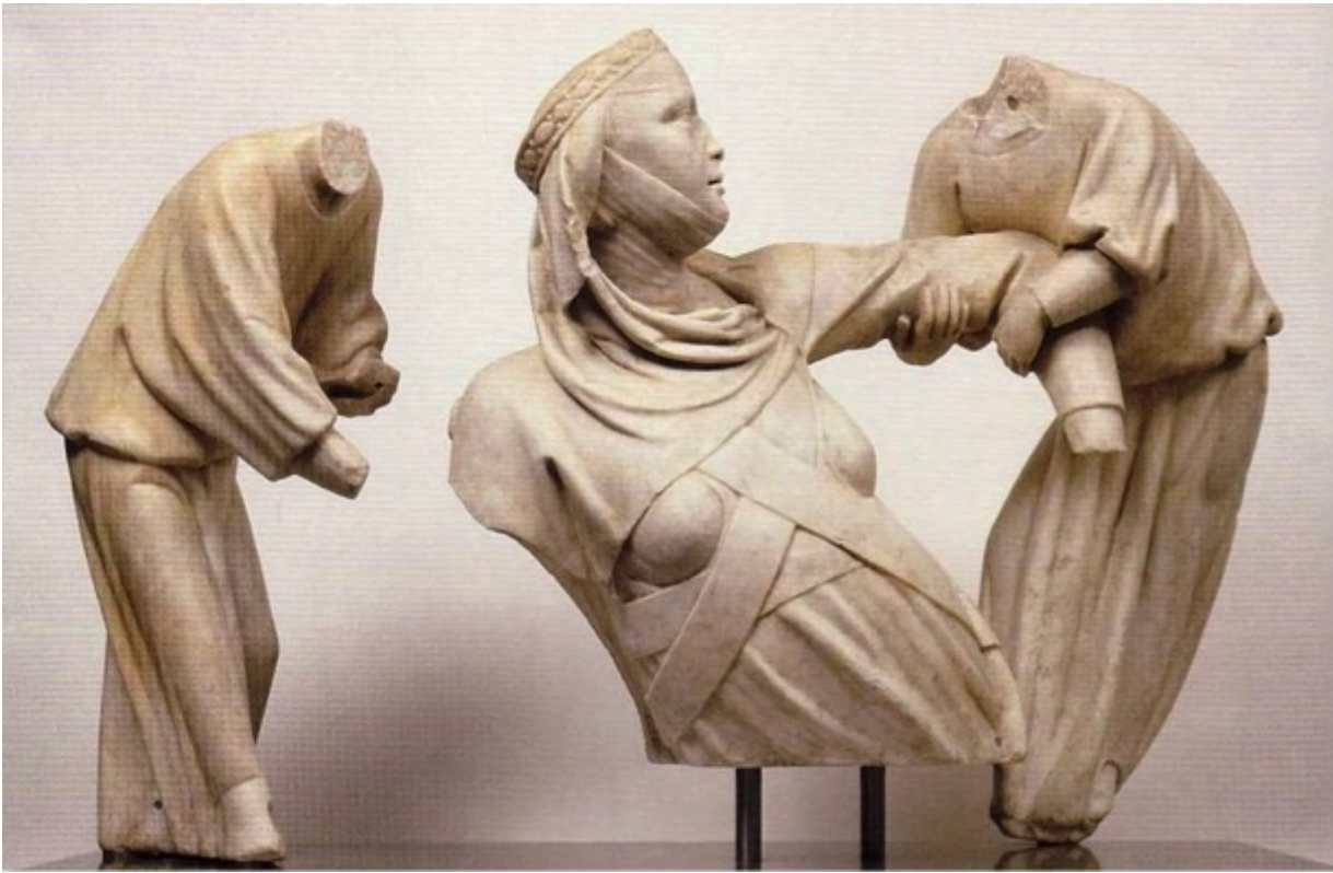
Giovanni Pisano, Monumento sepolcrale di Margherita di Lussemburgo , 1313-1314

Suggestionato dall'immagine evocata dalla nuvola, Giovanni concepì l' elevatio animae della regina composta da tre figure sveltanti verso l'alto. L'anima – simbolicamente da lui resa quale giovane e bellissima donna, velata e col soggolo secondo la moda dell'aristocrazia femminile tedesca, cinta della stola maiestatis , allusiva alla sua immortalità – era aiutata da due angeli apteri ad ascendere al cielo. Tensioni contrapposte, sia fisiche che emotive, animavano il gruppo, sapientemente orchestrate in un'unità di commossa grandezza interiore. Il tema della morte vi era affrontato in una chiave del tutto nuova e moderna. Non più intesa quale semplice trapasso, Giovanni volle tradurla in evento dinamico. Rese infatti l' assumptio animae et corporis della sovrana con un gioco di armonie e di curve, quasi una danza, che esprimeva la spinta trascendentale verso l'ultraterreno, sublimantesi nell'espressione estatica del viso di lei.