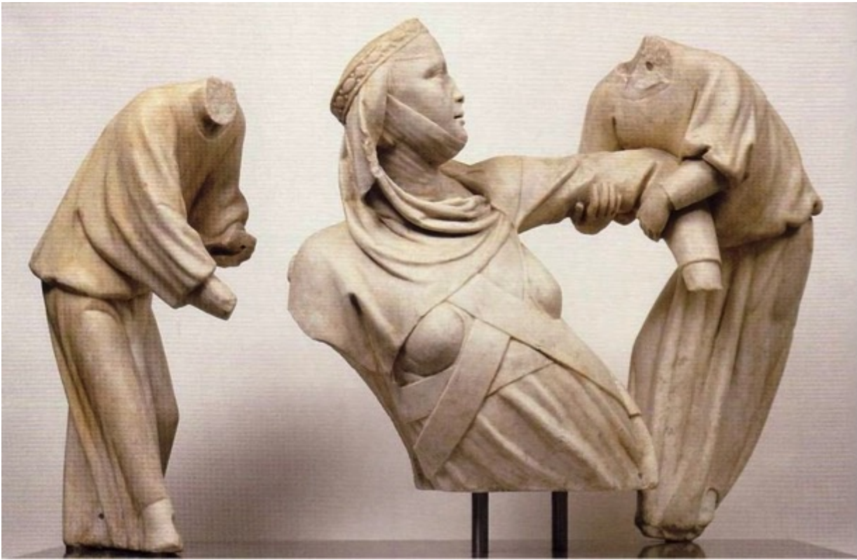
Giovanni Pisano, Monumento sepolcrale di Margherita di Lussemburgo, 1313-1314

Suggerito dall'immagine evocata dalla nuvola, Giovanni concepì l' elevatio animae della regina composta da tre figure svettanti verso l'alto. L'anima - simbolicamente da lui resa quale giovane e bellissima donna, velata e col soggolo secondo la moda dell'aristocrazia femminile tedesca, cinta della stola maiestatis , allusiva alla sua immortalità - era aiutata da due angeli apteri ad ascendere al cielo. Tensioni contrapposte, sia fisiche che emotive, animavano il gruppo, sapientemente orchestrate in un'unità di commossa grandezza interiore. Il tema della morte vi era affrontato in una chiave del tutto nuova e moderna. Non più intesa quale semplice trapasso, Giovanni volle tradurla in evento dinamico. Rese infatti l' assumptio animae et corporis della sovrana con un gioco di armonie e di curve, quasi una danza, che esprimeva la spinta trascendentale verso l'ultraterreno, sublimantesi nell'espressione estatica del viso di lei.