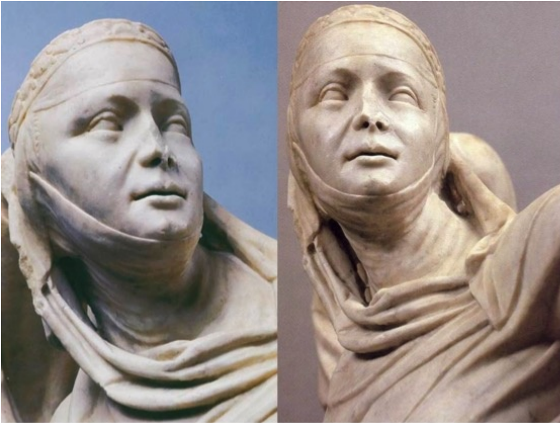
Giovanni Pisano, Monumento sepolcrale di Margherita di Lussemburgo, 1313-1314

Trasfigurò Margherita, conferendole una bellezza spirituale e sensuale al contempo. Ne idealizzò il volto in un ovale perfetto. Le labbra morbide e la bocca dischiusa, ne immortalò l'espressione di stupore, mentre risvegliatasi alla vita eterna, rivolgeva al Cielo che la stava per accogliere uno sguardo quasi incredulo e un sorriso grato e fiducioso.