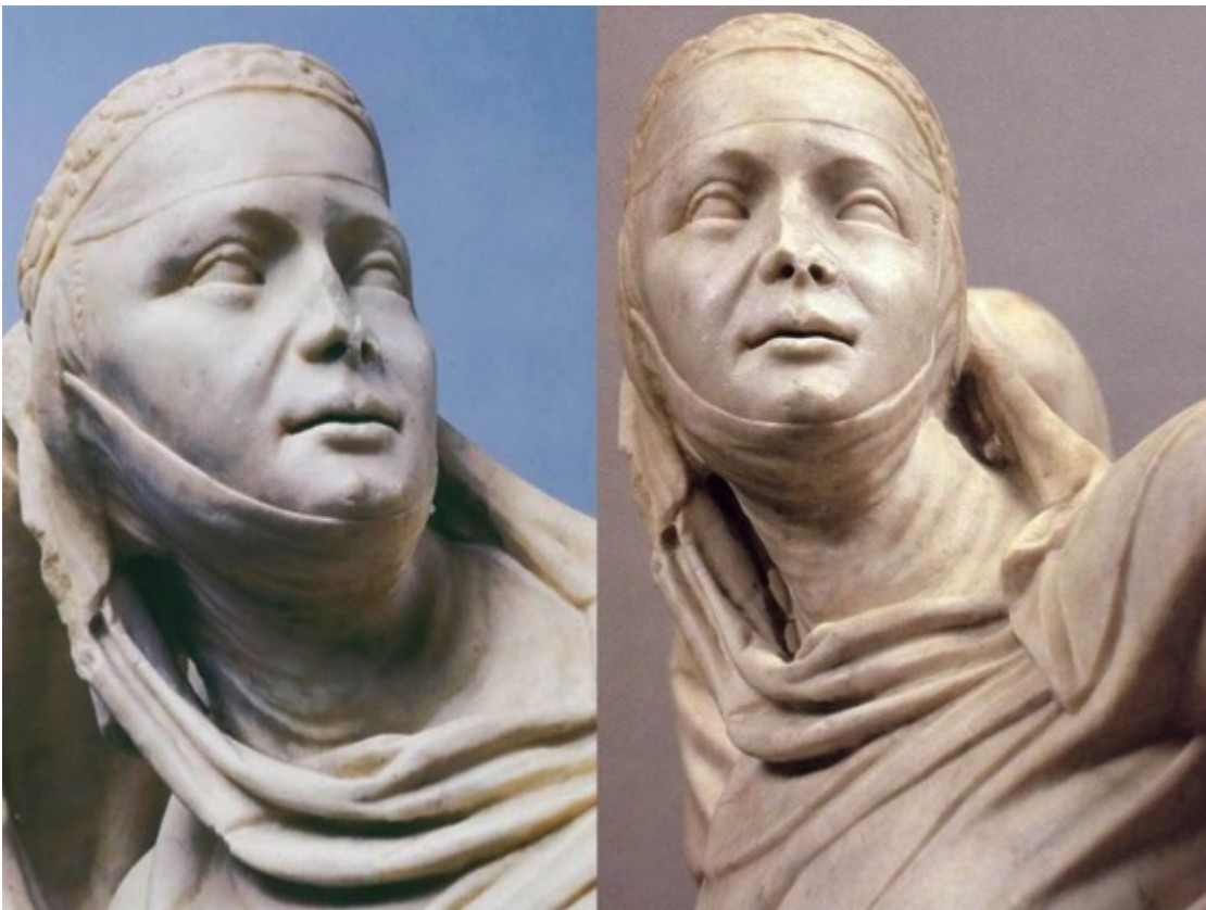
Giovanni Pisano, Monumento sepolcrale di Margherita di Lussemburgo, 1313-1314

Trasfigurò Margherita, conferendole una bellezza spirituale e sensuale al contempo. Ne idealizzò il volto in un ovale perfetto. Le labbra morbide e la bocca dischiusa, ne immortalò l'espressione di stupore, mentre risvegliatasi alla vita eterna, rivolgeva al Cielo che la stava per accogliere uno sguardo quasi incredulo e un sorriso grato e fiducioso.