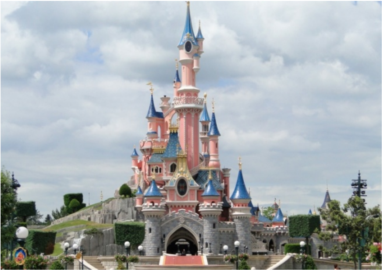
Disneyland Paris, Francia

Nato dal suo amore per gli automi, le macchine e le costruzioni in scala ridotta, passione comune ad alcuni terrifici personaggi di Hoffmann, Disneyland prese forma nell'intuizione, precorritrice dei tempi, di un parco dei divertimenti di nuova concezione creato affinché gli adulti potessero tornare piccoli insieme ai bambini. Un luogo in cui il divertimento non si identificasse più con singole attrazioni, ma con la possibilità di accedere a un mondo immaginario realizzato organicamente hic et nunc , nella realtà, e rispondente unicamente a leggi proprie. Un luogo di regressione dove la materializzazione del sogno e dei desideri della classe media americana – che fu sempre il target di riferimento di Disney – consentisse di precipitare nell'incoscienza della realtà. A Disneyland, quanto ha a che vedere con questioni o problematiche sociali, politiche, economiche, vale a dire ciò che è complesso e reale, non ha corso: “Un'idea sottile,” sosteneva Disney, “per quanto brillante, è destinata a non essere capita dal pubblico”. Quanto Disney sia riuscito a centrare l'obiettivo lo dimostrano i numeri: in tutto il mondo sono gli adulti il pubblico numericamente più consistente dei parchi. Come suggerisce Marc Augé in Un etnologo a Disneyland (in Disneyland e altri non luoghi , Bollati Boringhieri), il “bambino re” a Disneyland diventa “bambino pretesto” utilizzato dall'adulto per accedere alla finzione.