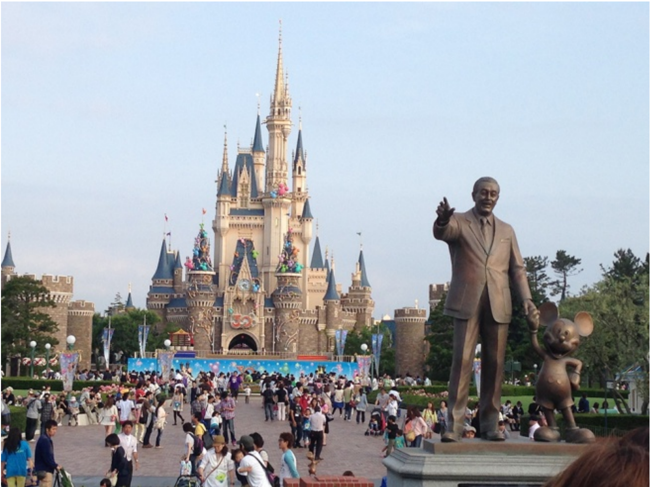
Disneyland Tokyo, Giappone.

Su questa progressiva e rigorosa manovra di separazione dalla realtà operata da Disney nell'edificazione del proprio mondo, la dice lunga Disney World, a Orlando, vera e propria città-stato edificata in Florida, come scrive Codeluppi, ottenendo “uno stato di sovranità senza precedenti sul territorio acquistato. Una sovranità di tipo amministrativo, poliziesco, fiscale che consente all'azienda una totale libertà persino rispetto ai controlli sull'uso dell'ambiente”. A Orlando è stato esaudito, post mortem , anche l'ultimo sogno di Walt Disney, quello di creare una vera e propria comunità di umani uniti dal desiderio di vivere nel mondo Disney. Realizzata nel 1995 all'interno del parco, Celebration, che conta 20 mila abitanti, è, come scrive Jeremy Rifkin in L'era dell'accesso (Mondadori), la celebrazione di uno stile di vita più che un quartiere residenziale. Così si esprime l'opuscolo che la descrive: