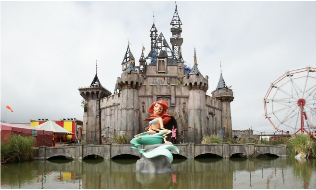
Dismaland, Weston-super-Mare, Gran Bretagna

Anche nel Bemusement Park di Banksy è un castello che, al centro dell'area, accoglie i visitatori, ed è il medesimo castello preso a logo dell'evento. Benché sia riconoscibilissimo come appartenente alla schiatta dei castelli disneyani, il castello di Banksy è più orizzontale che verticale, più fortezza che collezione di torri e pinnacoli dei quali, nella costruzione, rimangono solo incerti e bruciacchiati scheletri. Lo slancio verso il sogno qui sembra essere collassato e tendere all'istituto di correzione penale. Tributato a Cinderella, il palazzo accoglie al suo interno la scena di un incidente mortale occorso alla principessa durante il ritorno in carrozza prima dello scoccare della mezzanotte. La scena luttuosa, illuminata nel buio da una gragnola di flash, evoca la galleria sotto il Ponte de l'Alma a Parigi.