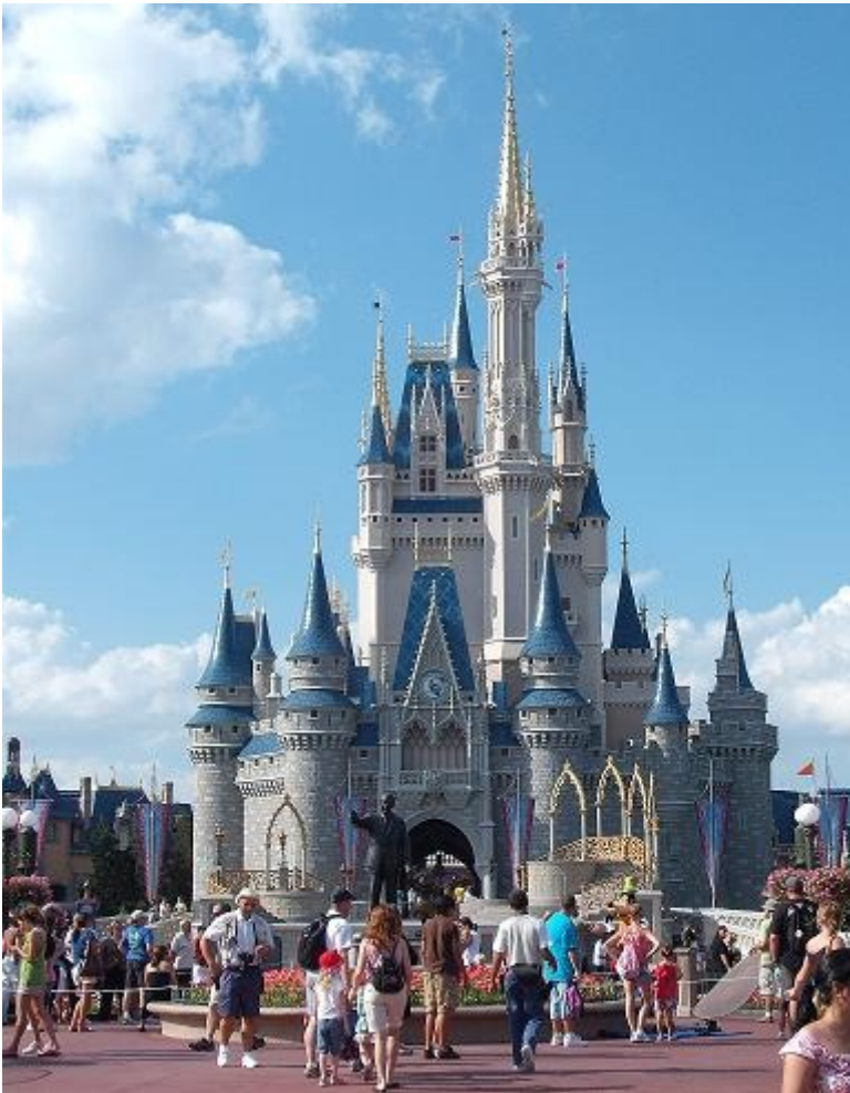
Disney World, Orlando, Florida

Il castello della Bella Addormentata nel bosco, apparso nel film omonimo, e assunto a simbolo grafico della Disney, è una compiuta espressione di quel Medioevo disneyano, che fu e rimane uno dei pilastri dell'estetica realizzata dal fondatore dell'azienda americana. I castelli medioevali, così come le altre ambientazioni medioevalescenti in gran parte dei film Disney, sono molto diversi da quelli reali, ma alla Disney furono così abili nel rielaborarli, che nel tempo nell'immaginario del mass market l'iconografia hollywoodiana si è sostituita a quella storicamente fondata. Per Walt Disney, peraltro, l'archetipo del castello era Neuschwanstein, edificato in Baviera fra il 1869 e il 1886: un edificio che Ludwig II, detronizzato da una diagnosi di follia e morto in circostanze oscure nel 1886, dedicò alla propria ossessione wagneriana e in particolare al mito di Loehngrin. Progettato dall'architetto e dagli scenografi Christian Janck e G. Dollmann, Neuschwanstein appare, quasi identico, in diversi film Disney, da Biancaneve e i sette nani , a Cenerentola , da La bella addormentata nel bosco a Rapunzel .