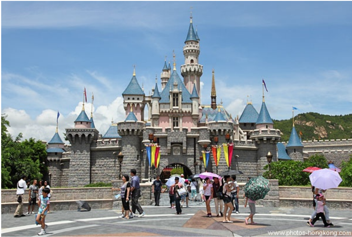
Disneyland Hong Kong, Cina

Costruita in sei stili diversi – mediterraneo, coloniale, vittoriano, classico, costiero, francese – e divisa in aree destinate a diverse categorie umane, fra golfisti, single, pensionati, famiglie etc., la comunità è soggetta a norme come non stendere il bucato a vista, dipingere le case del colore previsto dal regolamento, tagliare l'erba del prato alla stessa misura, e persino non lasciare la casa per più di tre mesi. Ordine, pulizia, sicurezza, cortesia sono le regole pilastro che Celebration ha ereditato dai parchi Disney, a tal punto distintive della loro identità che ovunque nei sondaggi di gradimento risultano essere le caratteristiche più apprezzate dal pubblico, persino rispetto alle costosissime e ipertecnologiche attrazioni. L'impeccabile facciata dei parchi Disney è assicurata, oltre che da una manutenzione ferrea e costante, da un sistema di sotterranei che consente al personale di servizio di nascondere la propria presenza in tutte le situazioni in cui non è parte del protocollo dello spettacolo.