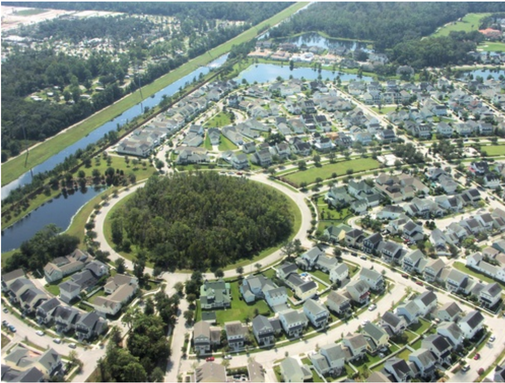
Celebration, Orlando, Florida

Quanto l'intrattenimento faccia parte delle nostre abitudini e modelli i nostri comportamenti lo mette in luce indirettamente Banksy nell'intervista che si trova sul sito di Dismaland , quando riferisce che all'inaugurazione del parco la gente si aspettava che le installazioni, in quanto parte di un "parco di divertimenti", per quanto fosco, "facessero qualche cosa". Nessuno, riflette Banksy, va a vedere Henry Moore pensando che le sue statue 'facciano qualcosa'. Per quale ragione, dunque, quando si visita un'installazione di arte contemporanea sotto forma di parco dei divertimenti la gente si dovrebbe aspettare davvero un parco dei divertimenti, pur trovandosi a pescare paperelle di plastica coperte di petrolio, a spiare cadaveri di principesse, a guidare un autoscontro con la morte o a pilotare una barca carica di migranti?