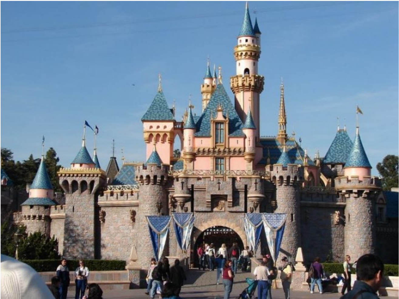
Disneyland, Anaheim, California

Non solo: è probabile che il 17 luglio 1955 qualcuno uscì davvero dall'inaugurazione di Disneyland in lacrime. Racconta Wikipedia che il giorno dell'inaugurazione passò alla storia come “il giorno nero” di Disney: