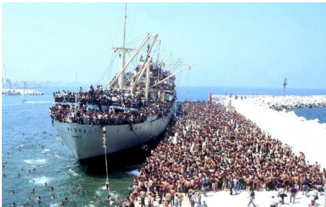
Esodo albanese, 1992

Così inizia la poesia che dà il titolo al volume più recente di Gëzim Hajdari, portando con sé secoli di tradizione orale e patrimonio collettivo, ma in una veste nuova, contemporanea e mitica al tempo stesso. Una «Penelope shqiptar» intona il suo canto d'amore rivolto all'eroe lontano, disperso nell'esilio, «ex pastore di capre dei lidi balcanici», Ulisse/Gëzim. Il corpus epico albanese si unisce alla tradizione dei cantori greci e alla drammaticità del tempo presente, dando nuova vita a figure, gesti e azioni antiche da tempo abbandonate dalla scrittura poetica "occidentale". L'« intentio epica» (Gazzoni 2010) si realizza attraverso un atto di fusione multiculturale, attingendo all'immaginario collettivo balcanico; ecco dunque che Gëzim e Ulisse, Penelope e la donna shqiptar , il Pireo e la Darsia, le Erinni e le Zane, Itaca e l'Arberia convivono e vibrano all'unisono, accompagnate dal suono della lahuta .