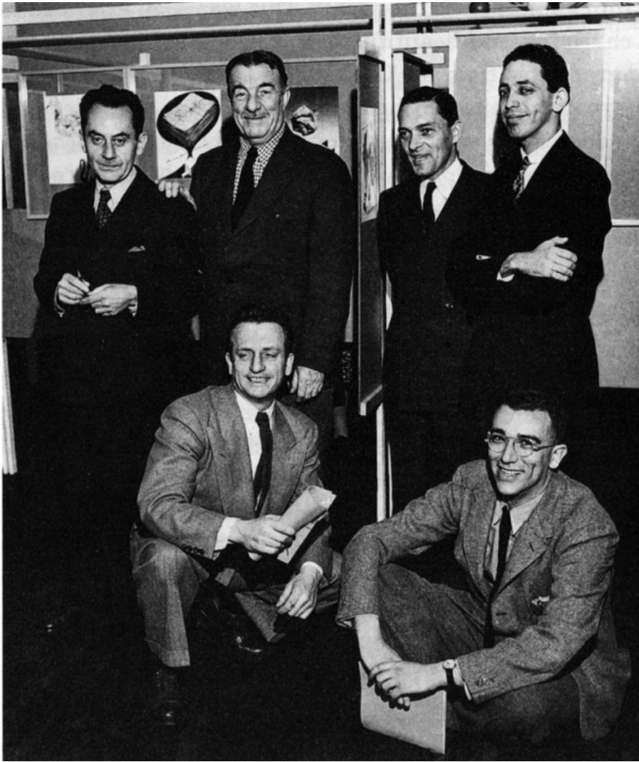
ph. Man Ray

Una raccolta di avvenimenti – tra successi, eventi insperati, incontri e a volte cadute e nuovi percorsi – che è comunque, pur nella sua ricchezza, meno interessante della narrazione che le tesse insieme e che lascia intravedere, in questa molteplicità di esperienze, un filo unico. Una narrazione che parte dalle immagini consegnate ai ricordi di Leo bambino, Leo adolescente e Leo adulto, immagini che portano sullo stesso piano la luce dorata della Amsterdam dell'infanzia e i chiaroscuri di Rembrandt, la voce della madre e l'amore per la musica, i tocchi del Violinista sul tetto di Chagall della collezione dello zio e il ritratto di Nora da giovane e dei figli, Mannie e Paolo.