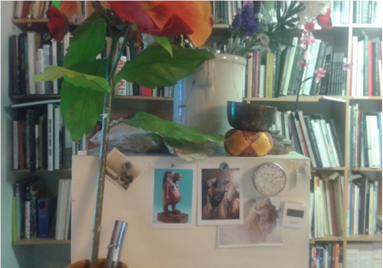
Dettaglio dello studio.

ma anche all'oggetto immagine, stavo per dire oggetto fotografia ( image e picture , dicono gli anglofoni). Dunque, che cosa ha fotografato? Di tutto in realtà, tutto come se fosse letteralmente in un luogo sconosciuto, dove tutto è diverso, neanche fosse un paese esotico, cioè lontano dalla nostra cultura e abitudini; certo non l'America né degli americani né dei turisti. Io direi, secondo quanto dicevo sopra, il fondo primordiale di una terra, quello che si ritrova, modificato di poco, altrove se non ovunque, cioè nel fondo di ogni earth .