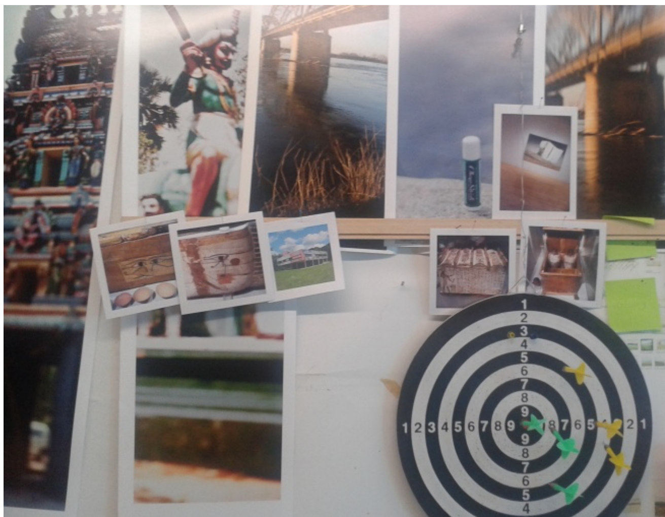
Dettaglio dello studio.

Battaglia viene da una laurea in architettura; quello che fotografa, da sempre – cioè ormai da tre decenni –, è l’"architettura", cioè il rapporto spazio-temporale-materico-fenomenologico con la realtà umana. Ebbene, cercherò di ricostruire il percorso che mi ha prospettato ieri. Mi aveva detto che questa estate aveva fatto un giro in alcuni parchi nazionali degli Stati Uniti, dallo Yosemite allo Yellowstone, e che era stato un viaggio bellissimo, durante il quale aveva scattato a non finire, quindi io gli ho chiesto di parlargli. Prima del viaggio americano però, mi dice Battaglia mostrandomi una "zona" di provini appesi, era stato a visitare il Museo Egizio di Torino, dove ha trovato delle cose stupende e inattese. Una sono gli occhi udjat dipinti sui lati di un sarcofago come fosse sulla prua di una nave, che hanno la pupilla bucata per permettere al morto di guardare fuori durante il viaggio! Poi questo altro tipo di "sarcofago" sui generis, diviso in quattro scomparti, in ognuno dei quali andava stipato un organo, i quattro ritenuti essenziali – cuore, fegato, intestino, credo, e polmoni; il cervello proprio no! –, come una dotazione, un kit di montaggio per l’aldilà.