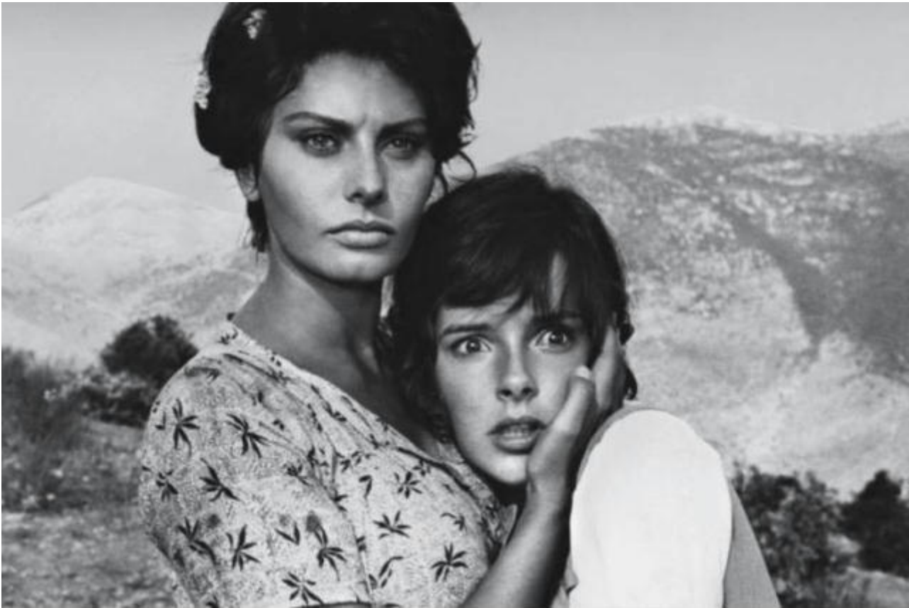
Sophia Loren ne La ciociara, 1960. Regia di Vittorio De Sica