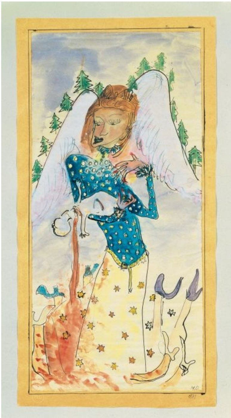
Meret Oppenheim, Votivbild, (Wu?rgeengel) , 1931

Sono questi allora gli estremi attorno a cui ruota la rappresentazione della maternità? La serena accettazione della stessa o il suo rifiuto? Quali e quanti possono essere i nodi e le differenze che separano questi due poli e come li ha affrontati Gioni? La rivendicazione politica di un ruolo sociale che non sia relegato alla sfera familiare e all'appagamento del desiderio di essere madre, la volontà di affermare un universo femminile indipendente dalla famiglia e il timore della maternità come luogo di rinuncia alla propria identità, la trasformazione del corpo, i successi della tecnologia, la rappresentazione – gelida o affettuosa – della propria madre, l'allegoria mariana e votiva, la divoratrice, la generatrice dell'universo sono alcune delle diverse declinazioni della maternità così come emerge da La Grande Madre .