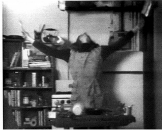
Martha Rosler, Semiotic of the Kitchen, 1975