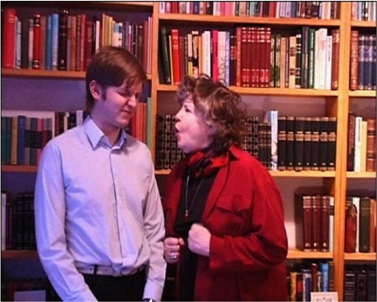
Ragnar Kjartansson, Me and My Mother , 2000, 2005, 2010, 2015