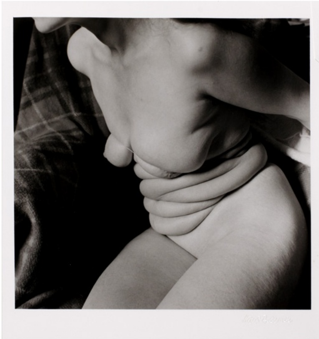
Hans Bellmer, Unica Zürich, 1958

All'interno del percorso espositivo, una prima cesura temporale e tematica sembra ritrovarsi nell'opera di Nari Ward, Amazing Grace (1993), una perturbante installazione mistica in cui decine di passeggeri-rottami, recuperati in strada dall'artista compongono una barca ferma all'interno di un un flusso composto da tubi per l'acqua dei pompieri di New York. Forse più un lavoro sulla speranza che sulla maternità, dove il residuo di un oggetto usato per un tempo definito e poi abbandonato si presta all'occasione.