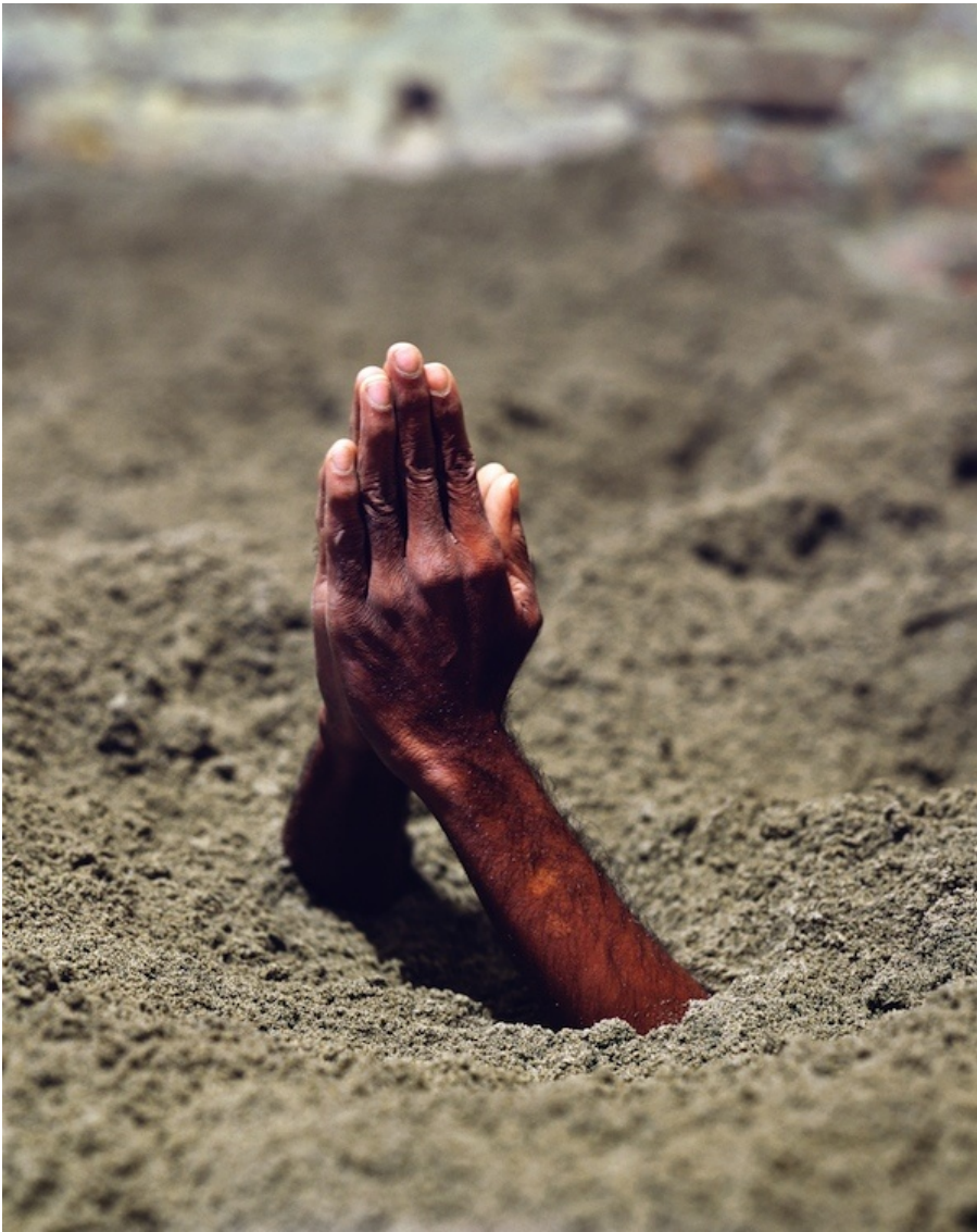
Maurizio Cattelan, Mother, 1999