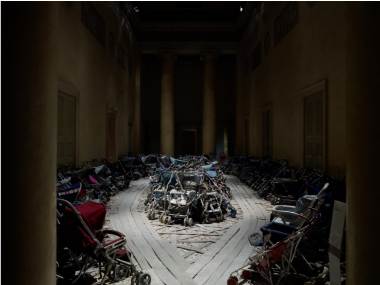
Nari Ward, Amazing Grace, 1993

Da questo momento tuttavia la mostra cambia registro e guarda a una nuova contemporaneità che si muove dalla dimensione intima a quella pubblica e dove la madre è donna e la donna è madre, l'una riflesso dell'altra o del proprio sacrificio, della propria vita votata al figlio. Così negli scatti privati di Diane Arbus, nelle immagini di Sophia Loren e Anna Magnani della Ciocciara e di Mamma Roma , o nei fazzoletti delle madri di Plaza de Mayo, piuttosto che nella giovane madre della Depressione americana fotografata da Dorothea Lange. Il sacrificio lascia subito dopo il passo ai temi della genesi, e della fertilità in Balloon Venus (Red) (2008), rilettura della Venere di Willendorf di Jeff Koons e nel video di Camille Henrot, Grosse Fatigue (2013), già premiato alla Biennale veneziana dello stesso Gioni.