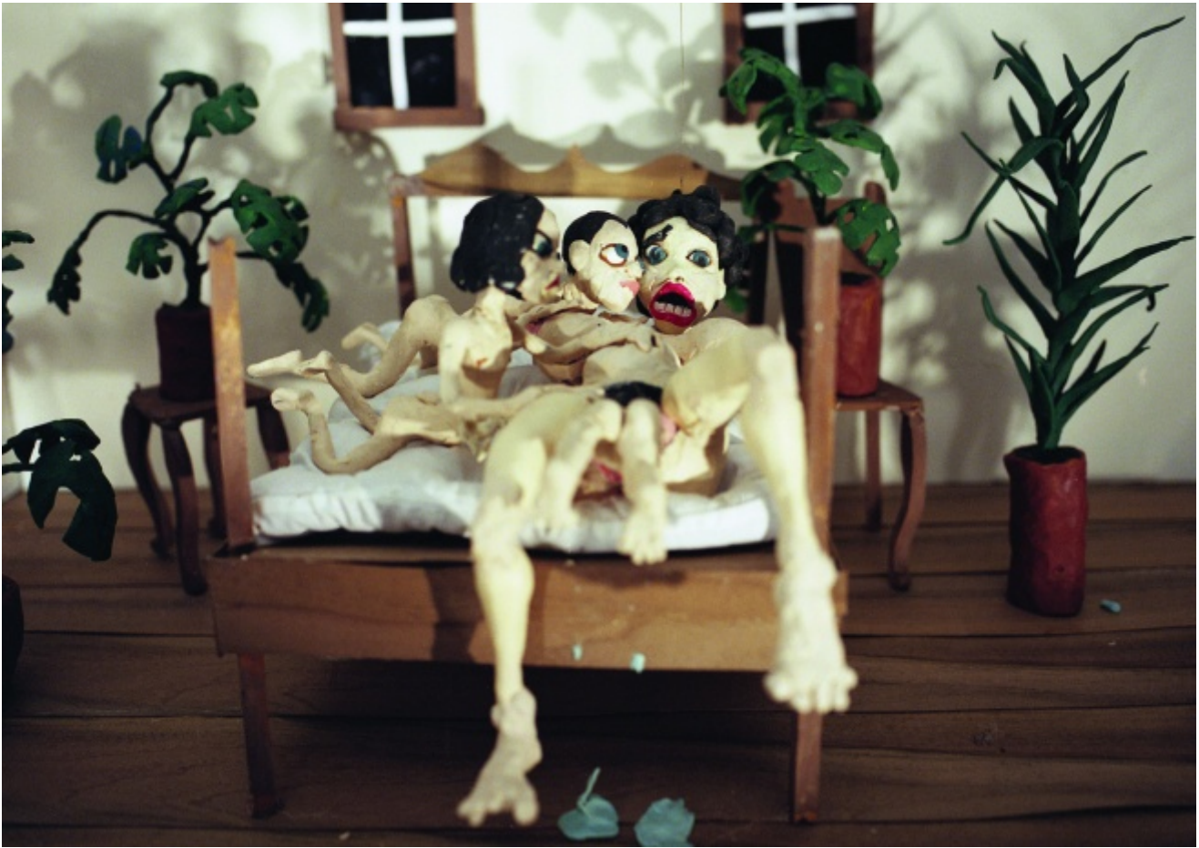
Nathalie Djurberg, It's the Mother (2008)