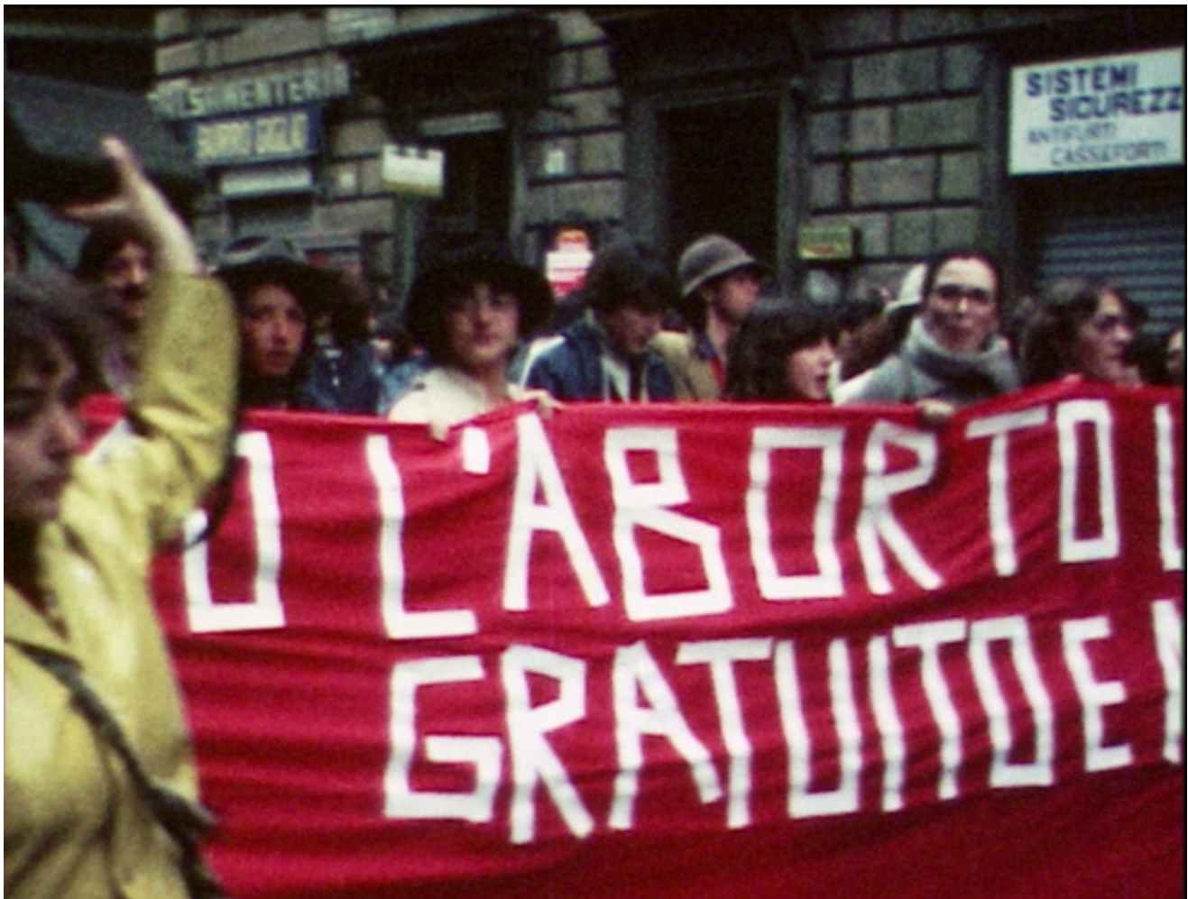
Immagine dal film Vogliamo anche le rose, di Alina Marazzi, 2007