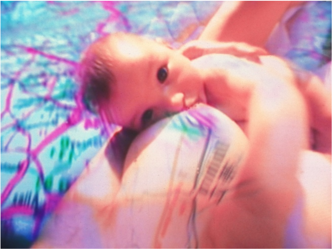
Pipilotti Rist, Mother, Son and the Holy Milanese Garden, 2002-2015