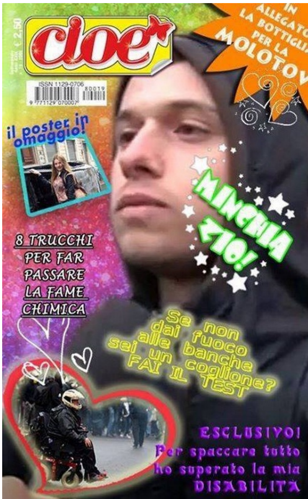
In una caricatura della rivista "Cioè".