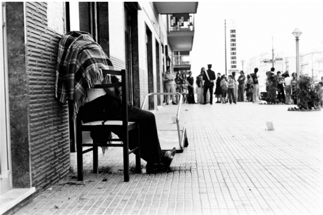
Letizia Battaglia, Omicidio sulla sedia, Palermo 1975. Letizia Battaglia

Le immagini di Letizia Battaglia ne sono un esempio: le sue fotografie testimoniano i delitti di mafia, raccontano la sua città, Palermo, nella miseria e nello splendore: le morti violente, i quartieri degradati, le strade insanguinate, ma anche gli sguardi delle bambine che incarnano la speranza nel futuro, in cui la fotografa si rispecchia, immergendosi appieno nella realtà che la circonda: "Non bastava fotografare, bisognava farlo con rispetto e partecipazione", ribadisce tutt'oggi.