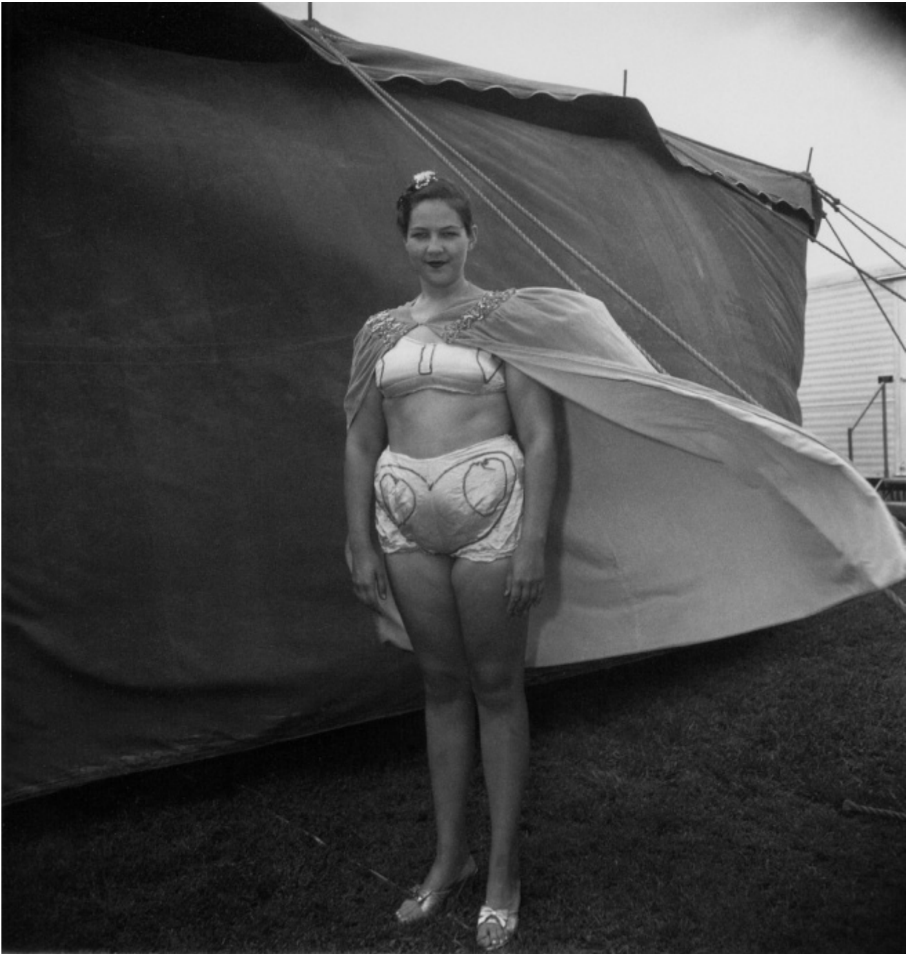
Diane Arbus, Girl in her circus costume, MD, 1970.

La risposta si trova in maniera diversa nelle altre immagini esposte. Sembra che in esse sia racchiuso il tentativo di oltrepassare ciò che Susan Sontag nel suo saggio sulla fotografia, scriveva a proposito delle immagini della Arbus: ovvero che impediscono una comprensione storica della realtà, poiché mostrano “un mondo nel quale tutti sono stranieri, disperatamente isolati, immobilizzati in identità e reazioni meccaniche e paralizzanti”, rendendo così irrilevanti la politica e la storia.