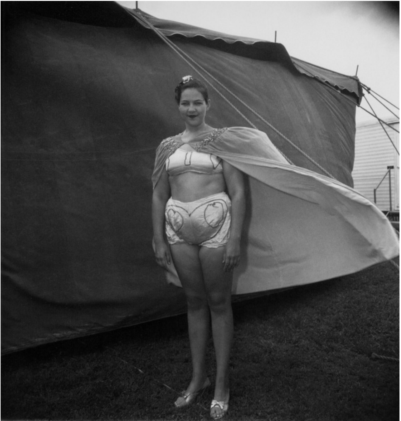
Diane Arbus, Girl in her circus costume, MD, 1970.

La risposta si trova in maniera diversa nelle altre immagini esposte. Sembra che in esse sia racchiuso il tentativo di oltrepassare ciò che Susan Sontag nel suo saggio sulla fotografia, scriveva a proposito delle immagini della Arbus: ovvero che impediscono una comprensione storica della realtà, poiché mostrano “un mondo nel quale tutti sono stranieri, disperatamente isolati, immobilizzati in identità e reazioni meccaniche e paralizzanti”, rendendo così irrilevanti la politica e la storia.