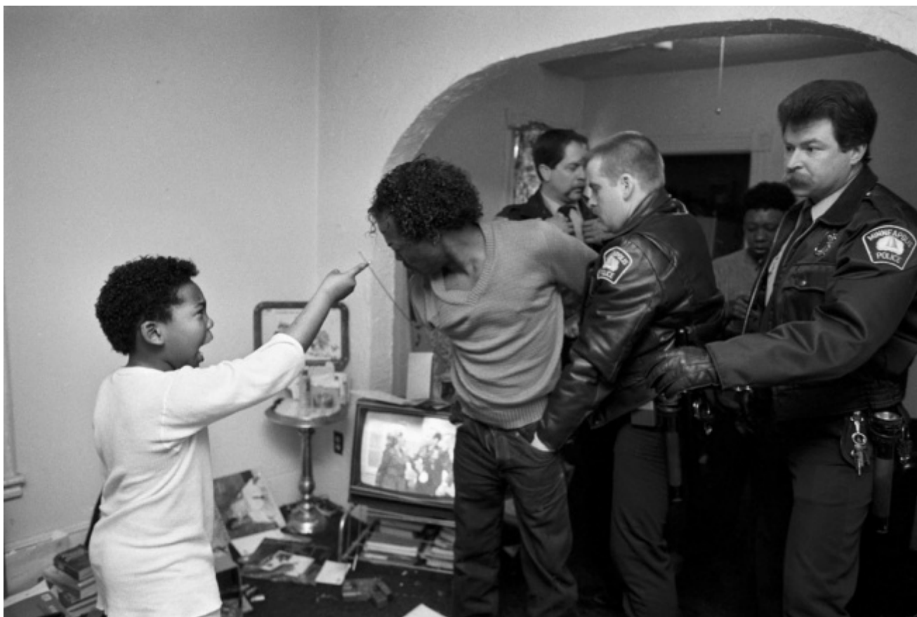
Donna Ferrato, Diamond (from the series Living with the Enemy) 1988. Donna Ferrato

E se alla fine l'interrogativo che sorge è: cosa hanno cambiato queste immagini? La violenza è diminuita, il degrado sparito, le città sono luoghi idilliaci? No. Eppure l'imperativo categorico è iniziare: a guardare, a capire, a stare nel mondo, forse a cambiare. E queste fotografie ne sono l'emblema: non se ne vanno, stanno ferme, chiedono di essere viste, sono lì a interpellare ognuno di noi sul nostro ruolo e il nostro essere nel mondo. C'è una frase di Marlene Dumas che voglio ricordare: «Vorrei che i miei quadri fossero poesie. La poesia è una scrittura che respira, lascia spazi aperti, in modo che si possa leggere tra le righe». Grazie a questa mostra, si può capire come lo può essere anche una fotografia.