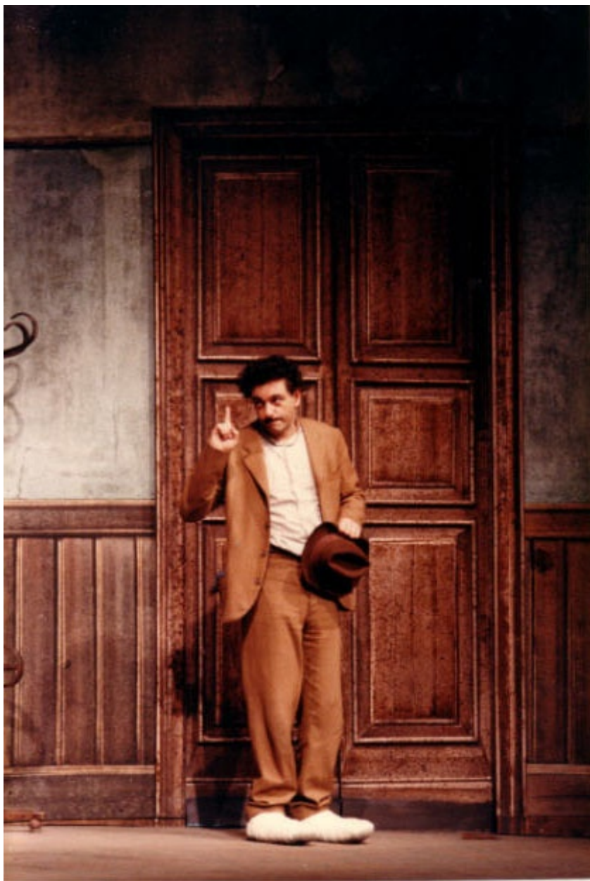
Uomo e galantuomo 85-86.