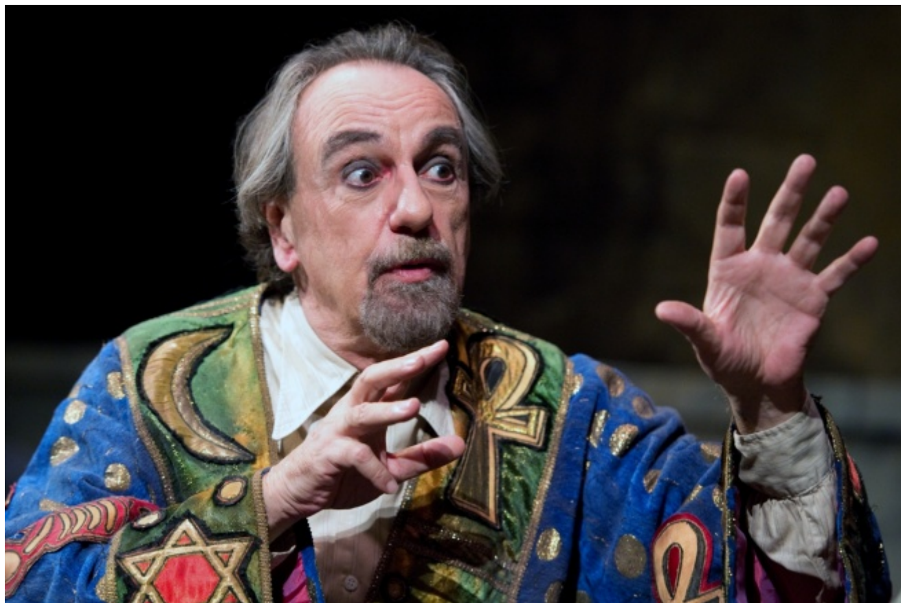
La grande magia, 2012-13.