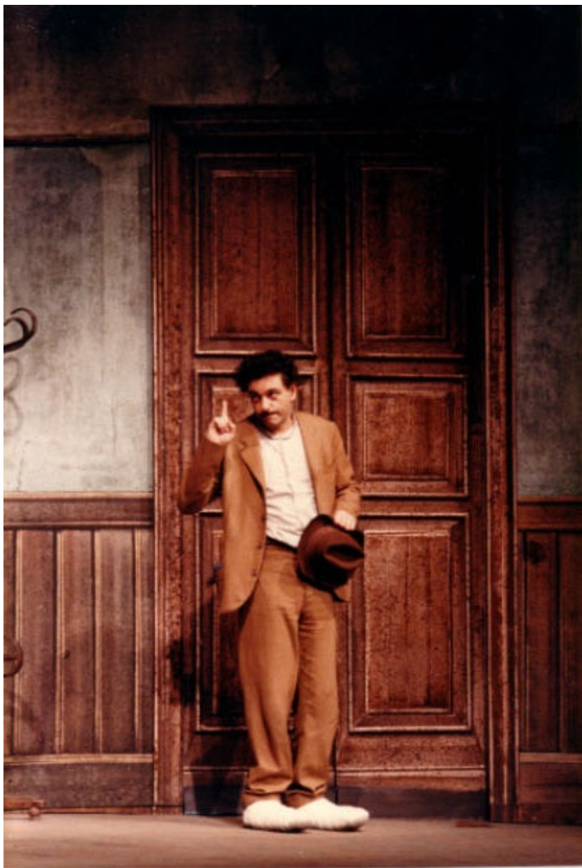
Uomo e galantuomo 85-86.