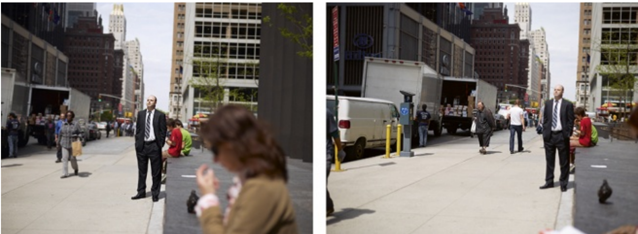
Paul Graham, The Present

Se prendiamo come unità di misura di riferimento questi attimi, inevitabilmente l'esperienza del presente si farà molteplice e frammentaria, come frammentaria, e a volte difficile da seguire rispetto al tema originario è l'esposizione presente al Macro, quest'anno alla sua XIV edizione. L'opera che sembra però più di tutte riunire la riflessione sul medium e sul tempo sociale è The Present , di Paul Graham: la stessa fotografia viene ri-scattata qualche secondo dopo, quando personaggi, messa a fuoco e punto di vista si sono spostati. Due istanti praticamente identici e già completamente diversi che sottolineano la tremenda verità insita nell'illusione del vivere un presente iperamplificato, ovvero che il tempo, pur diviso in così tanti secondi e relative immagini, non dura più a lungo, ma sta già inesorabilmente passando , come ha sempre fatto.