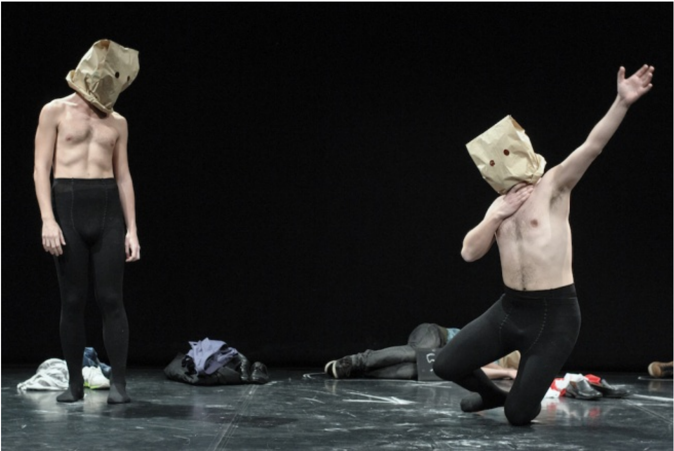
CollettivO CINETICO, Amleto