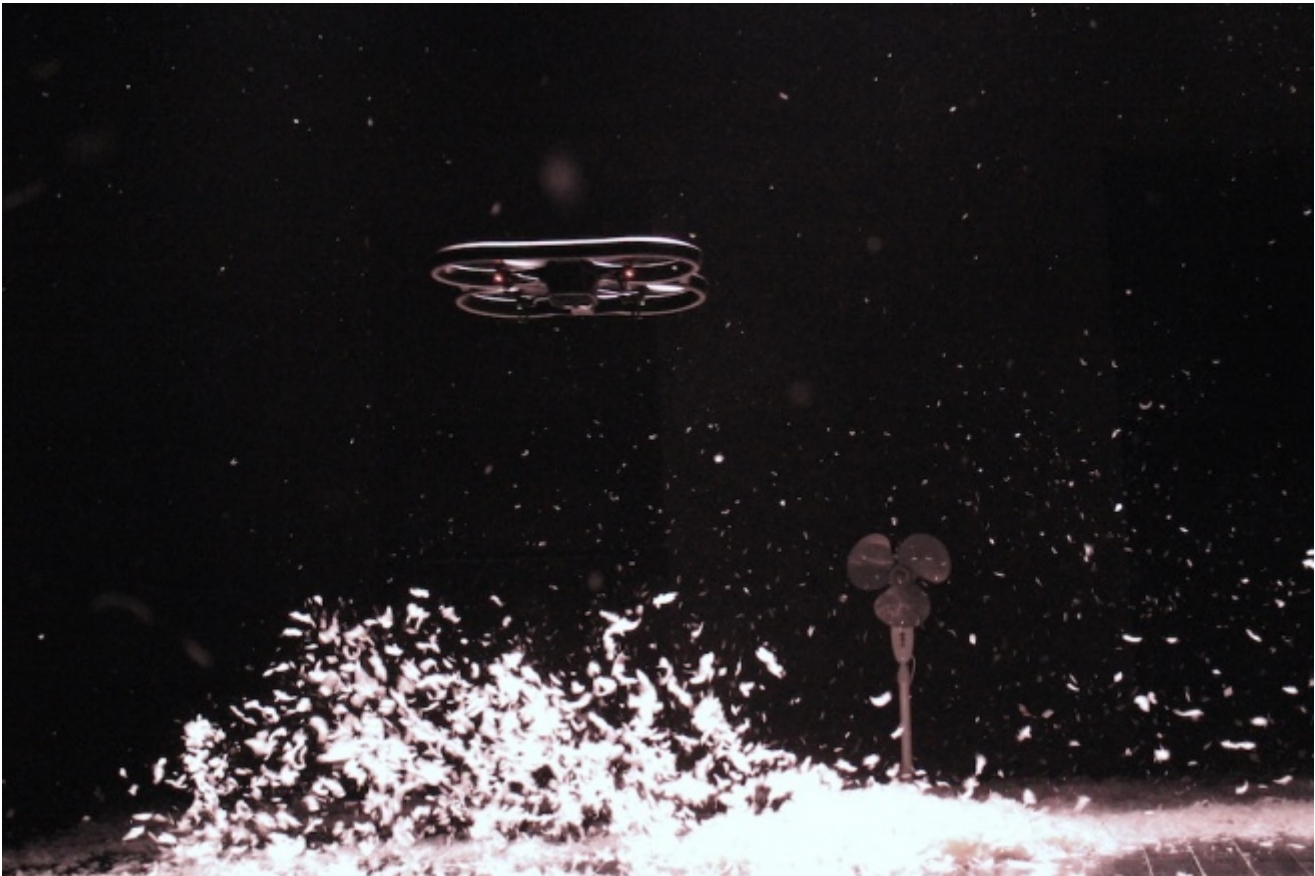
CollettivO CineticO, Miniballetti

I Miniballetti , e qui entra un altro elemento della scomposizione-ricomposizione su un altro piano del cubismo CineticO, erano brevi coreografie annotate su un quadernetto dalla Pennini bambina e pre-adolescente, a testimoniare una vocazione precoce coltivata poi con puntigliosa, disciplinata, bruciante passione. Ora la danzatrice realizza quei sogni di bambina: e sembra che abbia studiato, tutti questi anni, danza, ginnastica, solo per materializzare fantasie, desideri infantili.