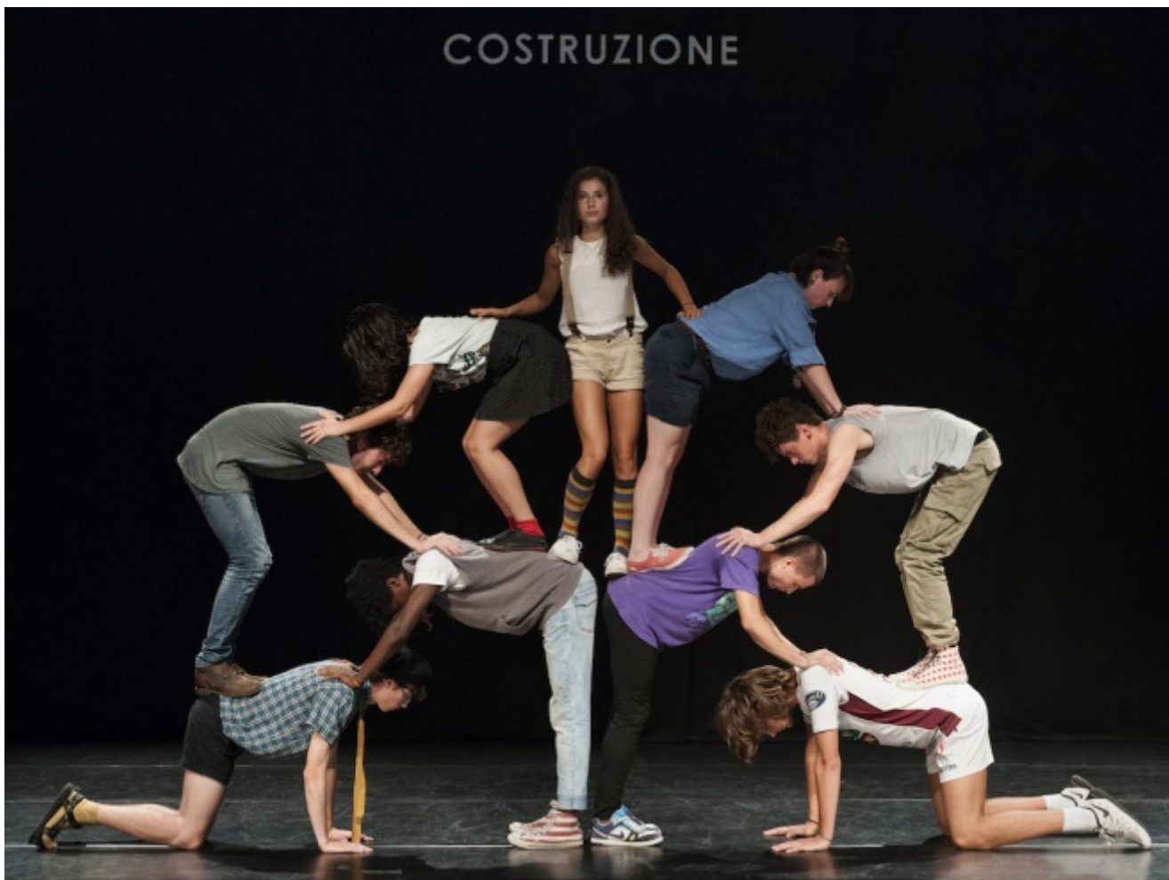
CollettivO CINETICo, Age

In attesa di lanciarsi nell'impresa futura della produzione di un vero e proprio classico del balletto, prima di una personale che in primavera Emilia Romagna Teatro dovrebbe dedicargli a Bologna, CollettivO CINETICo ha replicato due lavori recenti nel teatro Claudio Abbado della sua città, Ferrara. Ed è stato un gran successo, salutato da una notevole partecipazione di pubblico giovane, entusiasta, solidale, curioso, una testimonianza dell'affetto per questa compagnia che lavora in residenza proprio presso quel teatro comunale, dove ha svolto anche un laboratorio per universitari basato sugli sguardi.