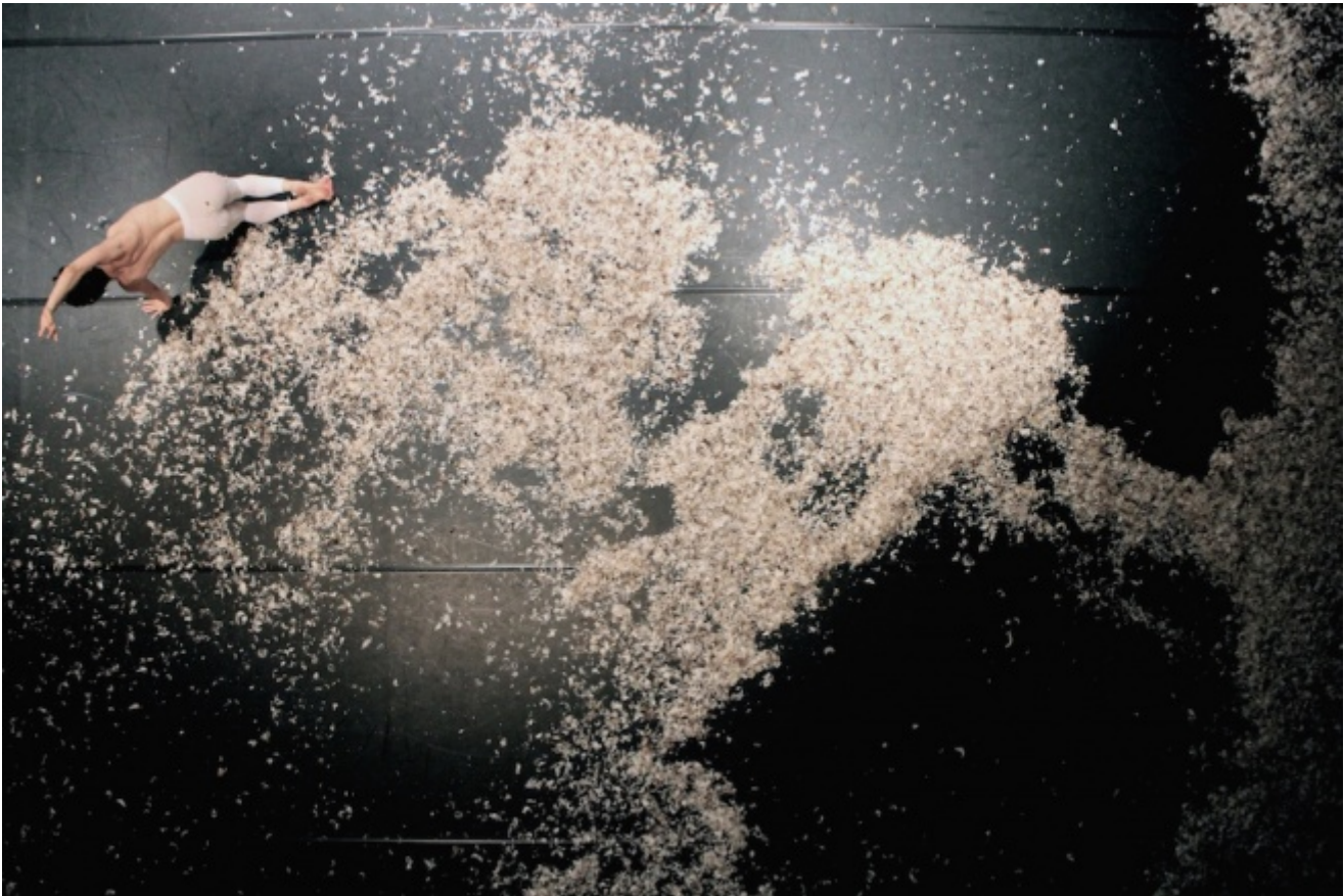
CollettivO CINETICo, Miniballetti

Danza piena di ironia, di tecnica puntigliosa e raffinatissima, di sfide immaginative, quando il corpo si lancia e allora dei numeri elencati rimane solo un vortice mentale, la meraviglia per la quantità che fa il salto imprevisto nella qualità, dimostrando che l'arte vive di salti, di precipizi, di accelerazioni impreviste, improvvise, tese sempre in equilibrio immaginale sull'abisso.