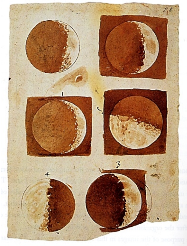
Galileo Galilei, Disegni della Luna, Sidereus Nuncius , 1610

Questo è uno dei tanti esempi che ci inducono a riflettere su molti luoghi comuni: siamo portati a credere che il mondo coincida con il visibile; che il visibile sia solo ciò che appare; che i nostri occhi vedano tutto quello che è visibile. Non è assolutamente vero: l'occhio saetta velocemente da un punto all'altro, mette a fuoco solo pochissime cose che risvegliano il suo interesse, tralascia e rimuove moltissime altre cose, benché altrettanto visibili quanto quelle notate. Per pure esigenze adattive non può e non deve vedere con la meccanica precisione di uno scanner. Quante volte vi capita di spostare lo sguardo da un punto all'altro e di domandarvi che cosa state guardando? Pochissime volte vi accorgete di vedere niente: l'occhio vede sempre qualcosa dovunque noi giriamo lo sguardo e tuttavia non incontra mai cose insignificanti, non incappa in lacune o incertezze proprio perché vede solo ciò che gli interessa vedere e che si aspetta di vedere.