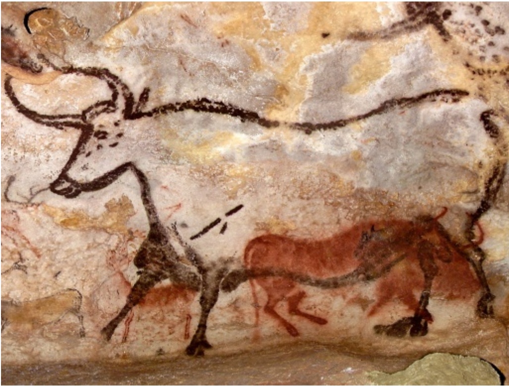
Grotte di Lascaux