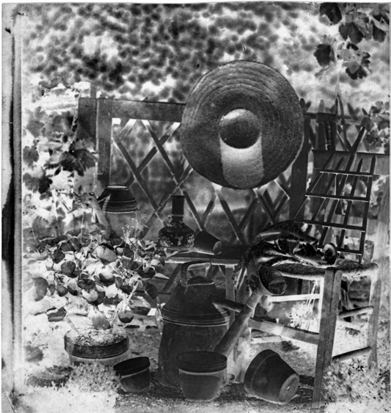
Hippolyte Baiard, Garden

clic_eleonora_roaro_-_g._batchen_-_un_desiderio_ardente_1.jpg