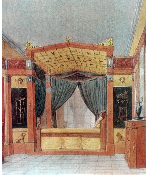
Da sinistra: Percier & Fontaine, Camera di Napoleone a Malmaison; Percier & Fontaine, Letto a baldacchino