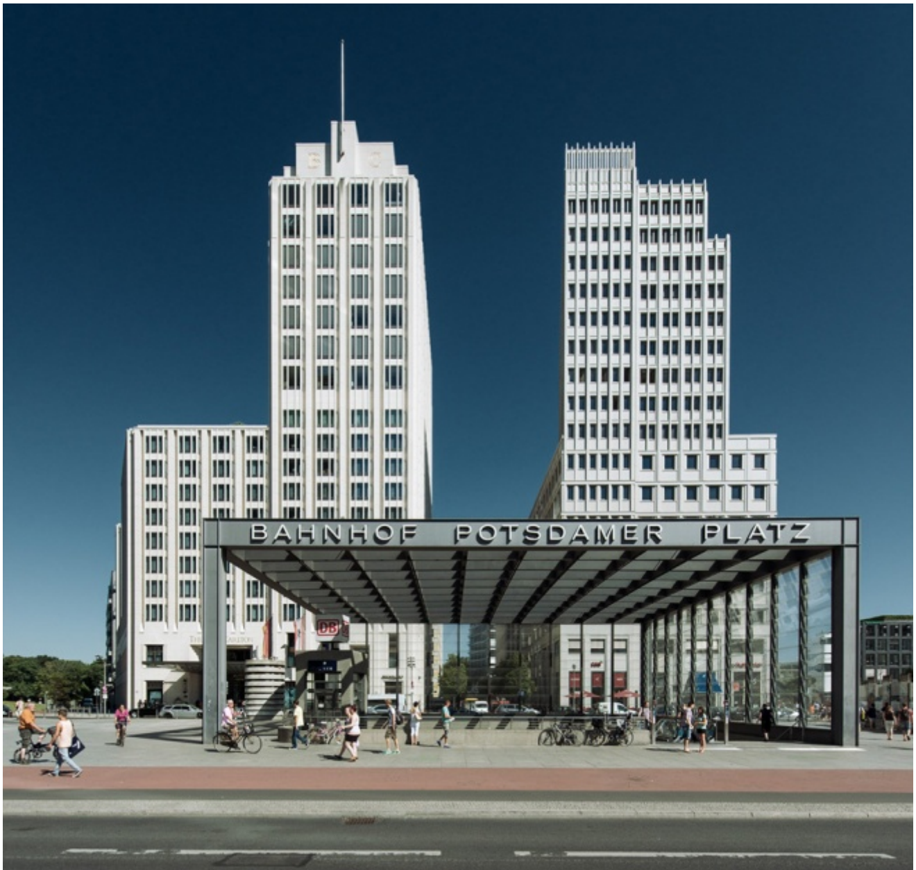
Potsdamer Platz

Un rapporto analogo - ma con effetti diversi - è istituito dal baldacchino che occupa la parte centrale della Piazza Gino Valle a Milano, realizzato dallo Studio Valle Architetti Associati tra il 2003 e il 2012. La funzione assegnatagli è quella di coprire l'accesso ai parcheggi sotterranei; una funzione che lo spropositato soffitto sorretto da altrettanto possenti "zampe" assolve in modo palesemente esorbitante. Ed è proprio questa smisuratezza dimensionale in rapporto alla limitatezza del compito svolto a svuotare di significato il baldacchino e a ingenerare una sensazione di straniamento: più che di un mobile, nella più grande piazza di Milano, questo oggetto ingombrante assume le sembianze di un inutile soprammobile, al cospetto dei monumentali edifici obliqui costruiti dallo stesso