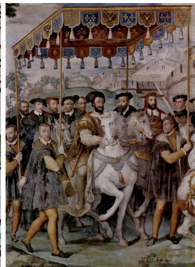
Da sinistra: Barca sacra egizia, Tomba di Sennefer, XVIII dinastia Sheikh Abd el-Qurna; Taddeo Zuccari, Palazzo Farnese, Caprarola