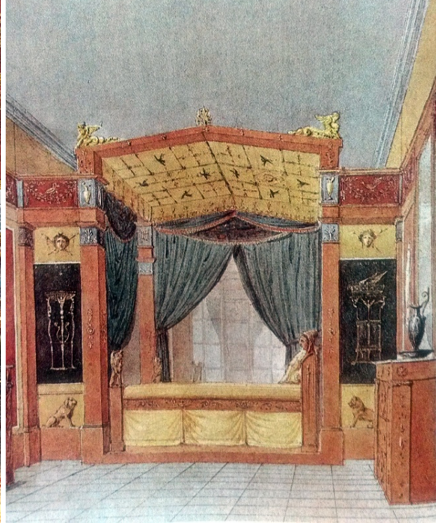
Da sinistra: Percier & Fontaine, Camera di Napoleone a Malmaison; Percier & Fontaine, Letto a baldacchino