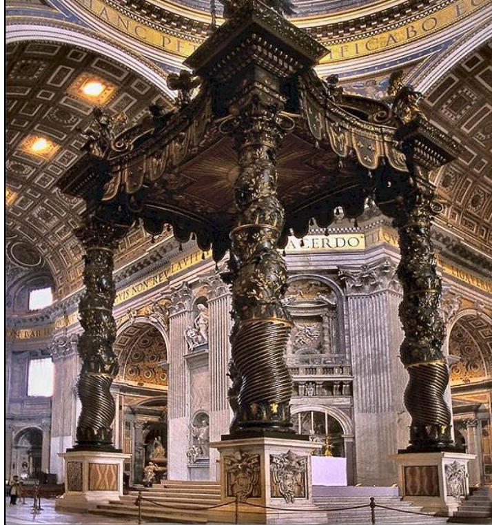
Da sinistra: Disegno del Baldacchino di San Pietro; Gian Lorenzo Bernini, Baldacchino di San Pietro

L'evoluzione del baldacchino in direzione dell'architettura avrà luogo soltanto molto più tardi, in un periodo relativamente recente. È con la trasformazione delle moderne città in immensi snodi infrastrutturali, labirinti inestricabili disposti su più livelli, che il baldacchino fa la sua comparsa in vasti spazi urbani. Sintomatica di questa fase è la nuova Potsdamer Platz a Berlino, realizzata a partire dai primi anni novanta. Qui il baldacchino (raddoppiato come per effetto di un artificio barocco) assume il ruolo di "coperchio" ai varchi di accesso al complesso mondo infero che si apre sotto di loro; un mondo comprendente diverse linee metropolitane e ferroviarie, oltreché un ragguardevole numero di spazi commerciali. Tecnicamente questi coperchi, progettati dallo studio Hilmer & Sattler und Albrecht, in collaborazione con Hermann+Öttl e J. Modersohn, servono a proteggere le scale mobili e gli spazi sottostanti dagli agenti atmosferici; tale azione protettiva però è ormai spogliata di qualsiasi risonanza simbolica, benché i due baldacchini - quasi fossero memori delle loro lontane origini - continuano a essere collocati nello spazio della Potsdamer Platz come fossero mobili all'interno di una gigantesca stanza.