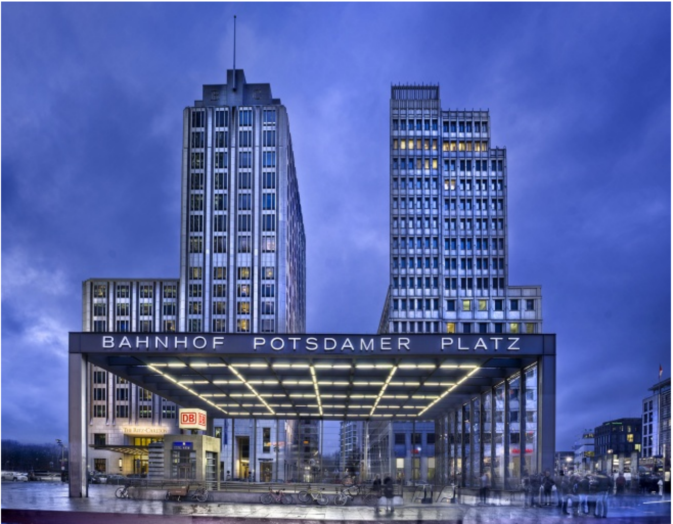
Potsdamer Platz, ph. Domingo Leiva