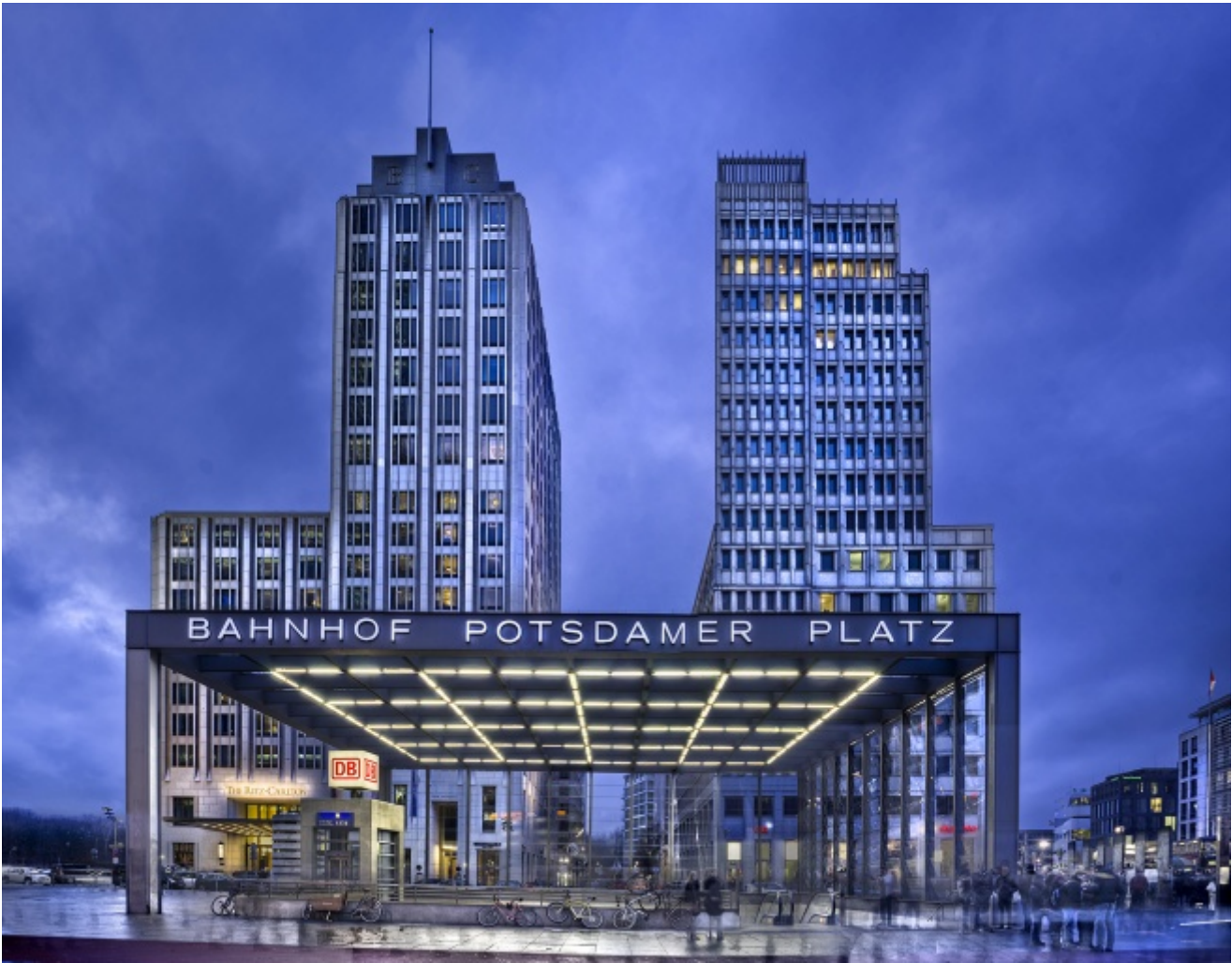
Potsdamer Platz