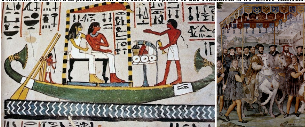
Da sinistra: Barca sacra egizia, Tomba di Sennefer, XVIII dinastia Sheikh Abd el-Qurna; Taddeo Zuccari, Palazzo Farnese, Caprarola

Che cos'è un baldacchino? L'etimologia del nome è di quelle capaci di farci compiere un giro del mondo (o quantomeno, di una bella porzione di esso) in una sola parola. Baldacchino deriva da Baldac, o Baldacco, che in origine indicava una stoffa proveniente da Baghdad, uno dei principali centri di produzione della seta e di altri tessuti preziosi del mondo antico. Ed era appunto un pezzo di stoffa quadrato, sostenuto da quattro aste di legno, a costituire la forma originaria del baldacchino. A che cosa questo servisse è abbastanza evidente: si trattava di un riparo, qualcosa come una tenda trasportabile sotto la quale avere un provvisorio ricovero. Il baldacchino, dunque, era un soffitto portatile, una protezione più vasta di un ombrello e soprattutto dotata di un ben maggiore valore simbolico. Chi stava sotto un baldacchino aveva e insieme assumeva una speciale dignità e importanza, al pari di chi – nell'iconografia tradizionale, a tutte le latitudini – stava seduto in confronto a chi stava in piedi. E non è un caso che spesso le due condizioni si trovassero unificate.