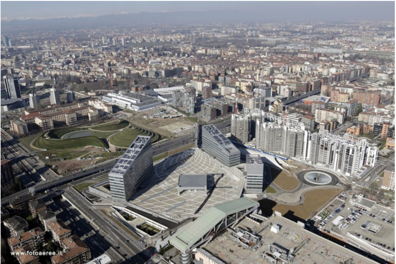
Piazza Gino Valle

Studio Valle e della pletorica testata dell'ex Fiera di Mario Bellini.