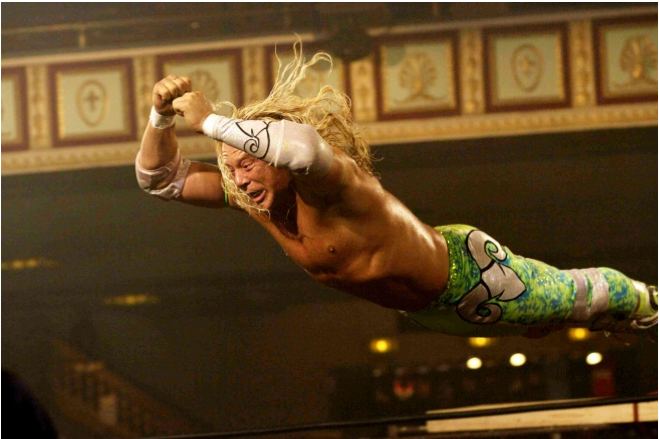
Dal film The Wrestler