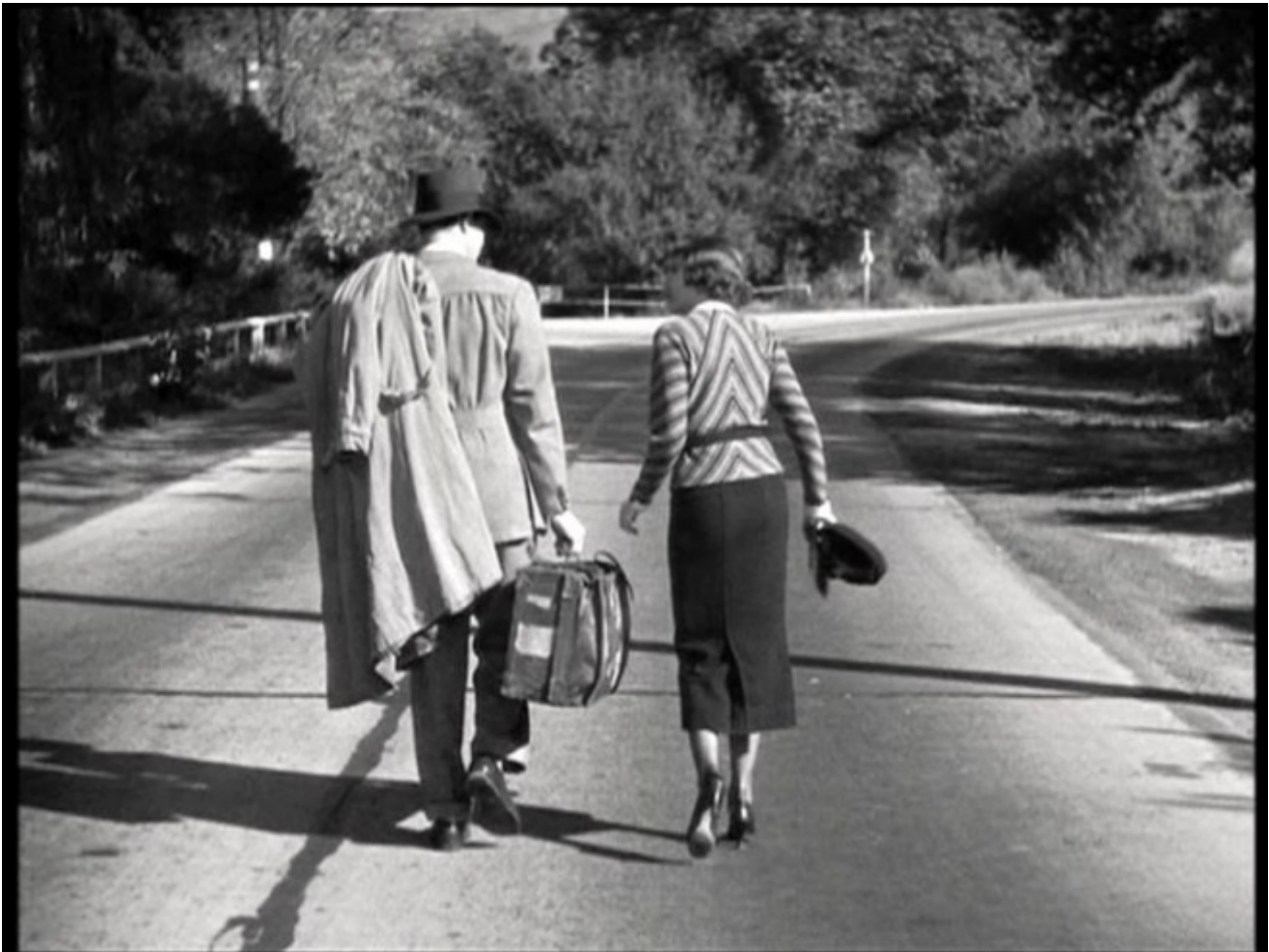
Accadde una notte (It Happened one Night), di Frank Capra, 1934