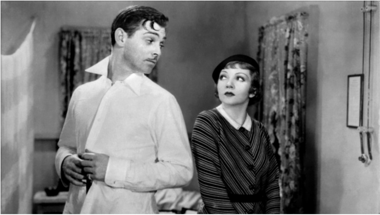
Accadde una notte (It Happened one Night), di Frank Capra, 1934