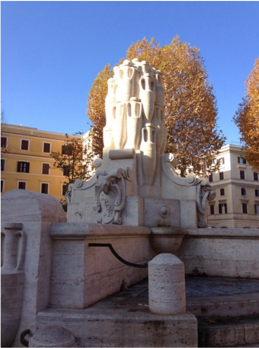
Fontana delle Anfore