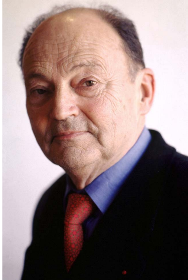
A destra: Michel Tournier

Gaspere, che ha scorto nella mangiatoia un Gesù nero come lui, confessa la verità di un amore che rispetta – la parola nel suo significato originale significa guardare due volte . Il principe spodestato, Melchiorre, apprende presso il Bambino la forza della debolezza, e presso Erode la violenza e la paura del potere regale.