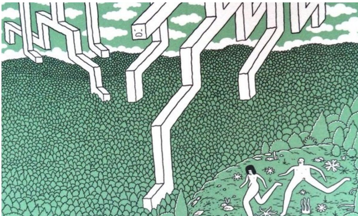
Safari Honeymoon, di Jeff Jacobs