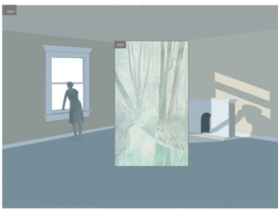
Qui, di Richard McGuire