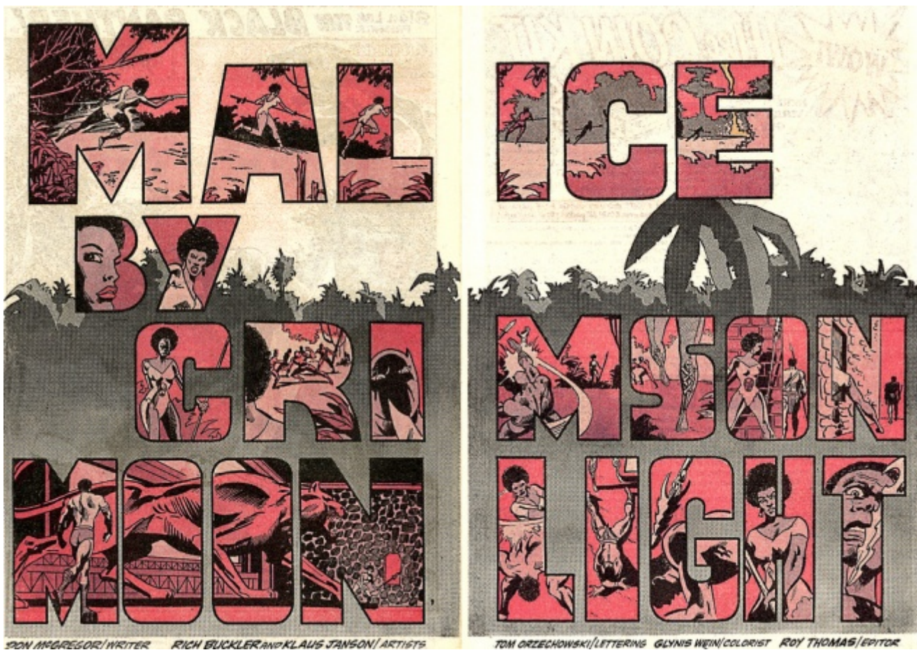
Pantera Nera, disegni di Rich Buckler, Billy Graham, Gil Kane, Keith Pollard