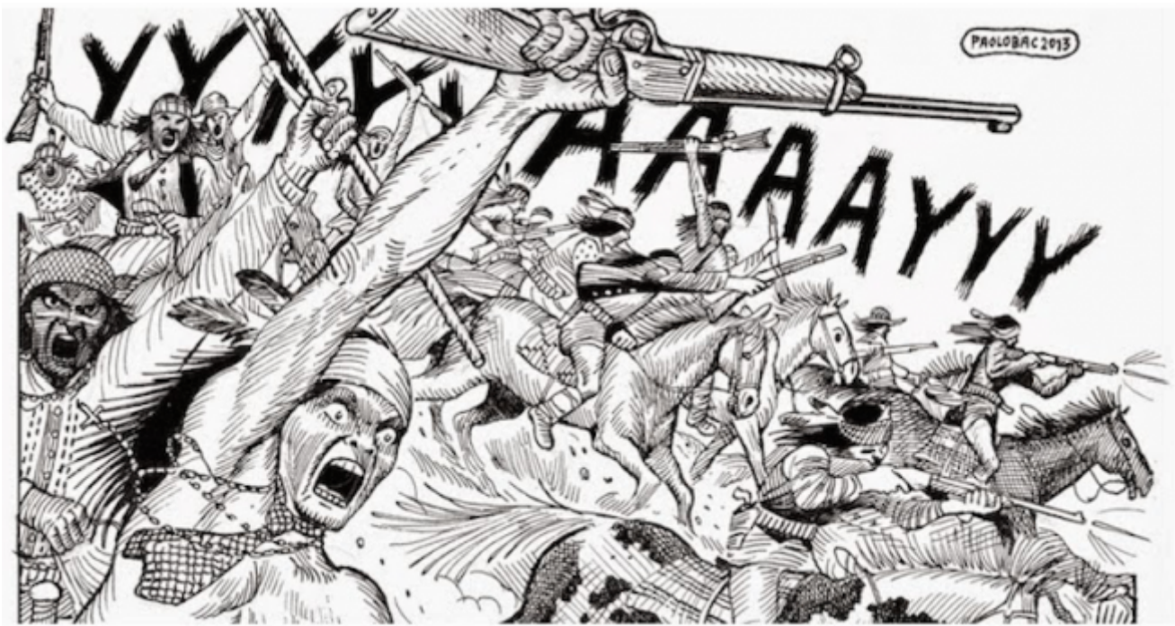
Il prezzo dell'onore, disegni di Paolo Bacilieri