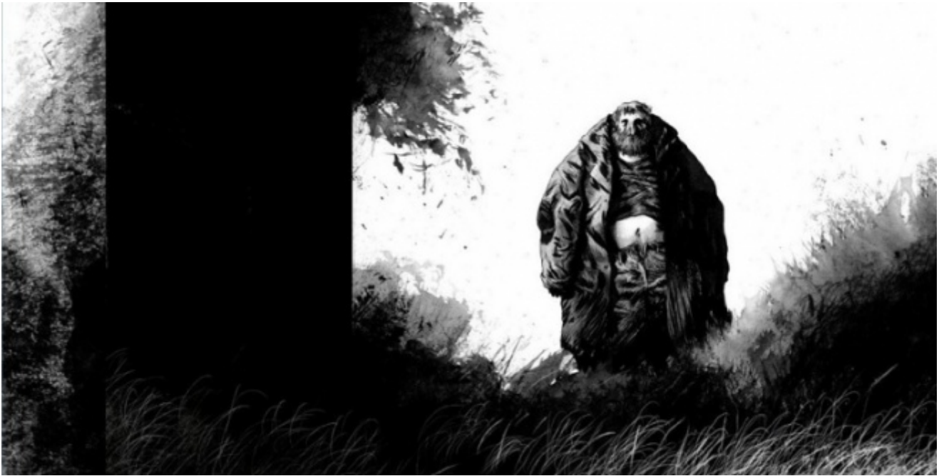
Blast, di Manu Larcenet