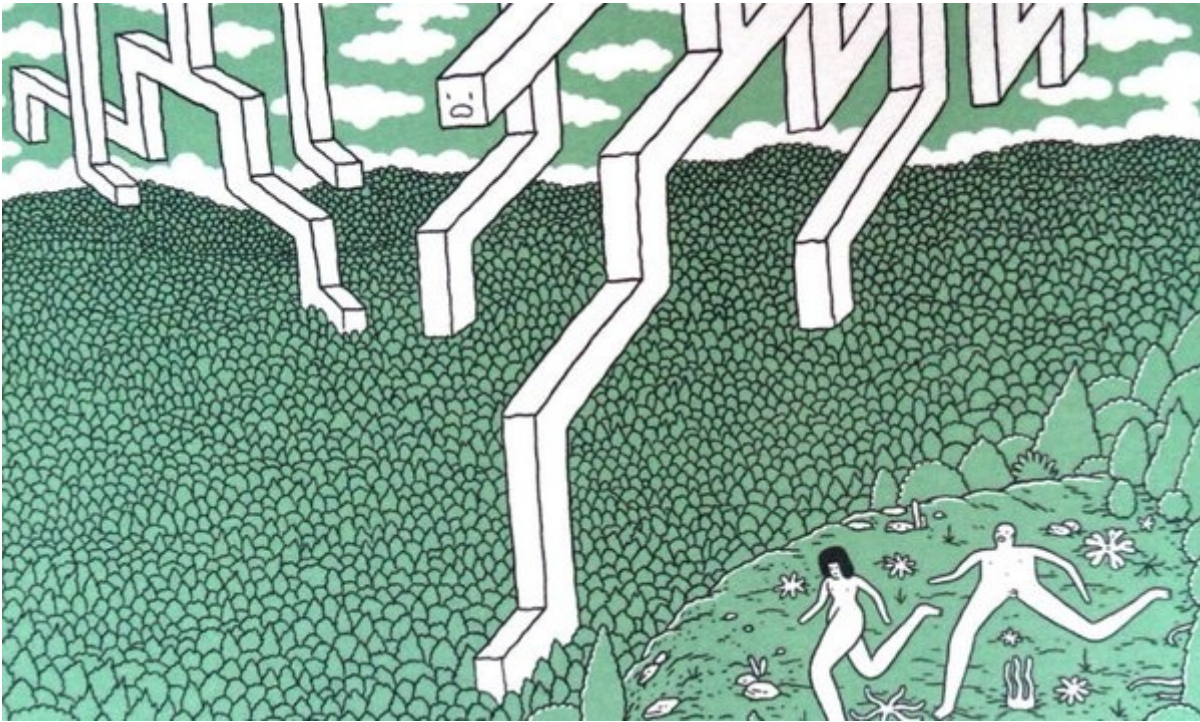
Safari Honeymoon, di Jeff Jacobs