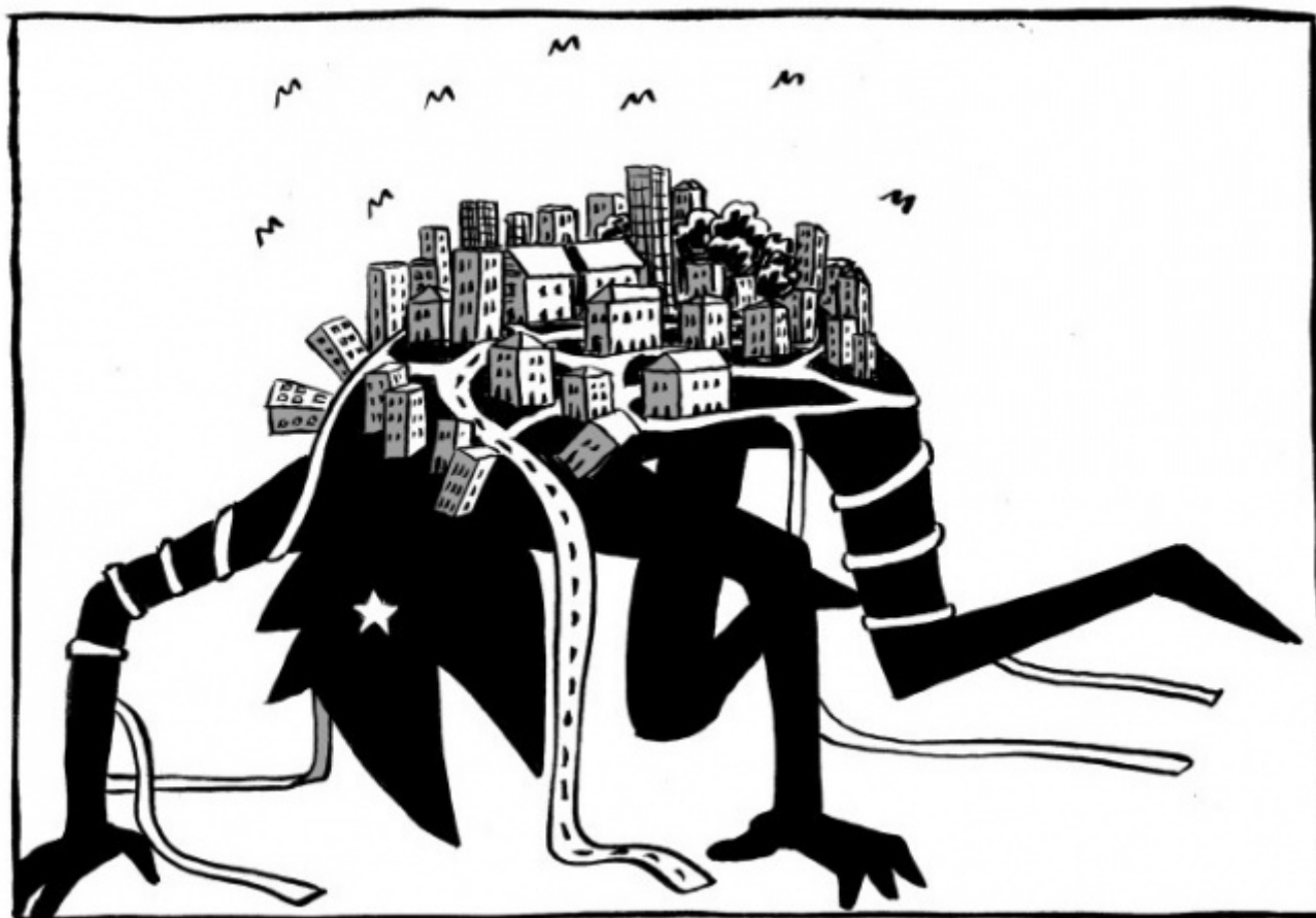
Anubi, disegni di Simone Angelini

La vera sorpresa del 2015. Un'opera prima ambiziosa e fuori dagli schemi per raccontare le peripezie di Anubi, divinità egizia che da troppi secoli non torna fra le piramidi e preferisce oziare e forse soffrire in un piccolo paesino della provincia italiana. Ci sono il bar, la droga, la solitudine, l'assurdo. C'è un umorismo brutale e delle improvvise sterzate di lirismo che lasciano senza fiato. E poi c'è uno dei finali più belli fra quelli letti quest'anno. Lunga vita ad Anubi. Adesso però passatemi un altro Campari.