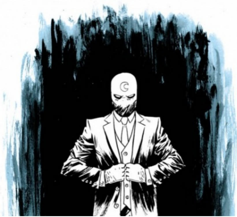
Moon Knight - Dalla Morte, disegni di Declan Shalvey