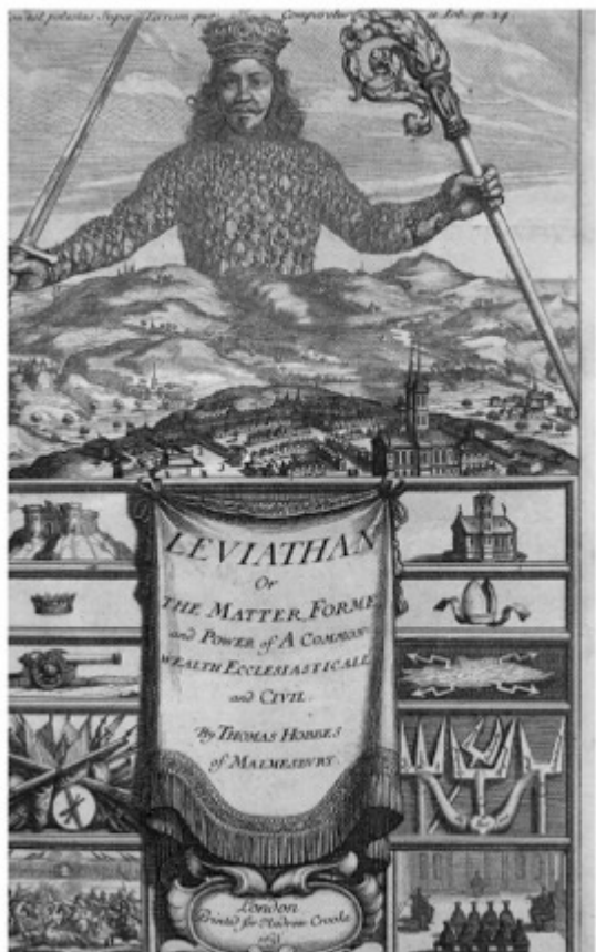
Frontespizio del Liatano di Hobbes