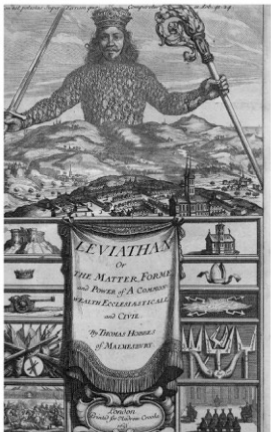
Frontespizio del Leviathan di Hobbes