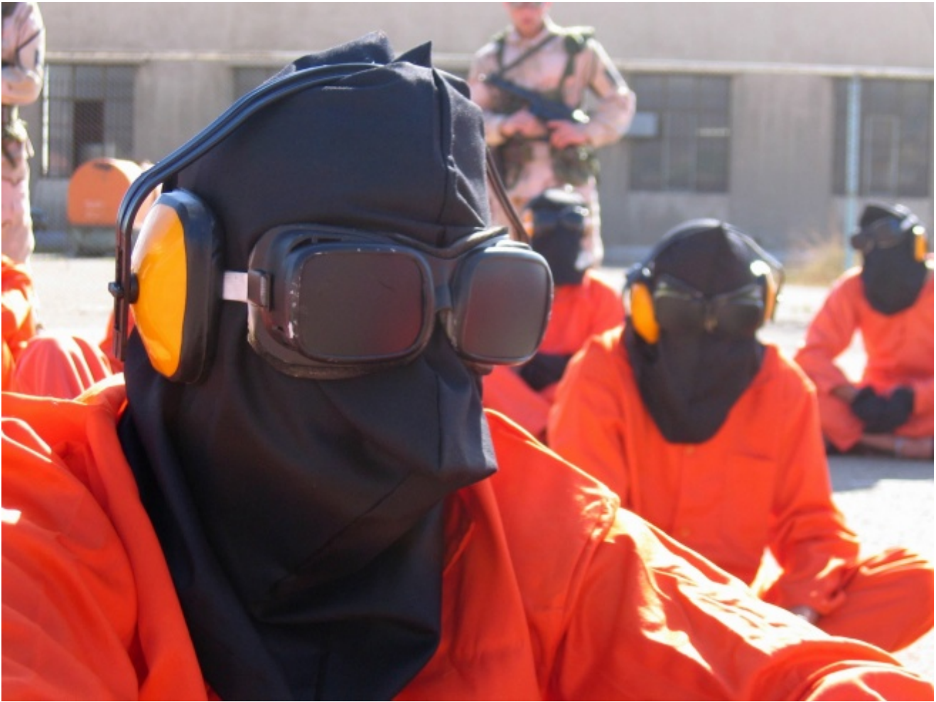
Detenuti a Guantanamo