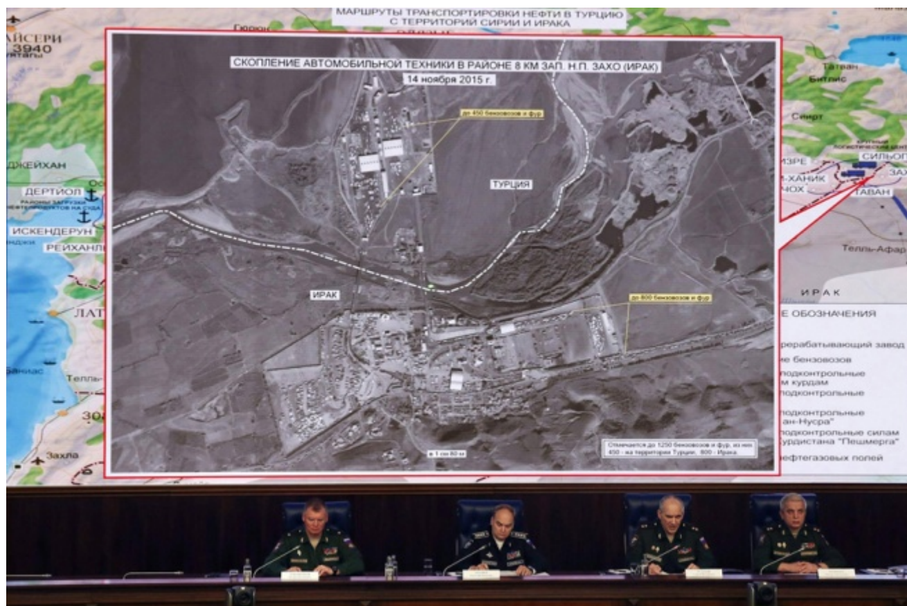
Conferenza stampa del viceministro della difesa russo Anatoly Antonov

In seguito all'abbattimento di un velivolo dell'aviazione militare russa al confine tra Siria e Turchia, i rapporti tra Russia e Turchia si sono deteriorati. Il presidente della Federazione Russa Putin accusa il presidente del governo turco Erdoğan di acquistare petrolio a basso costo dall'Isis. La Turchia è "il consumatore principale di questo petrolio rubato ai proprietari legittimi della Siria e dell'Iraq", ha comunicato in una conferenza stampa il vice ministro russo della Difesa Anatoly Antonov, aggiungendo che il presidente Erdoğan e la sua famiglia sono direttamente coinvolti in questa attività criminale. L'attività estrattiva, che costituisce la maggiore fonte di finanziamento dell'Isis, oltre ad avere un rilievo economico ne ha anche uno simbolico.