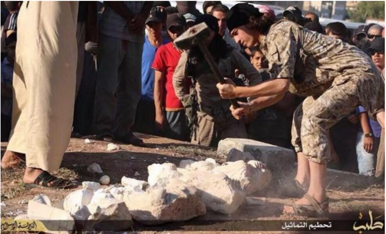
Distruzione di statue a Palmira

La distruzione delle statue e dei monumenti nel sito archeologico di Palmira non è solo la distruzione dei simboli della civiltà preislamica, ma anche della bellezza, sfigurata dagli jihadisti dell'Isis per avversità alla cultura che l'ha concepita come forma di risarcimento dovuto alla terra, e per avversità alla terra genitrice stessa, simbolicamente associata alla madre e quindi al potere generativo della donna. Questo potere pesa sui rapporti di forza nei ruoli sociali e perciò è contrastato dalle culture patriarcali, tra le quali anche quella dell'Islam fondamentalista, nelle quale i maschi più anziani del gruppo hanno il controllo esclusivo dell'autorità familiare, pubblica e politica.