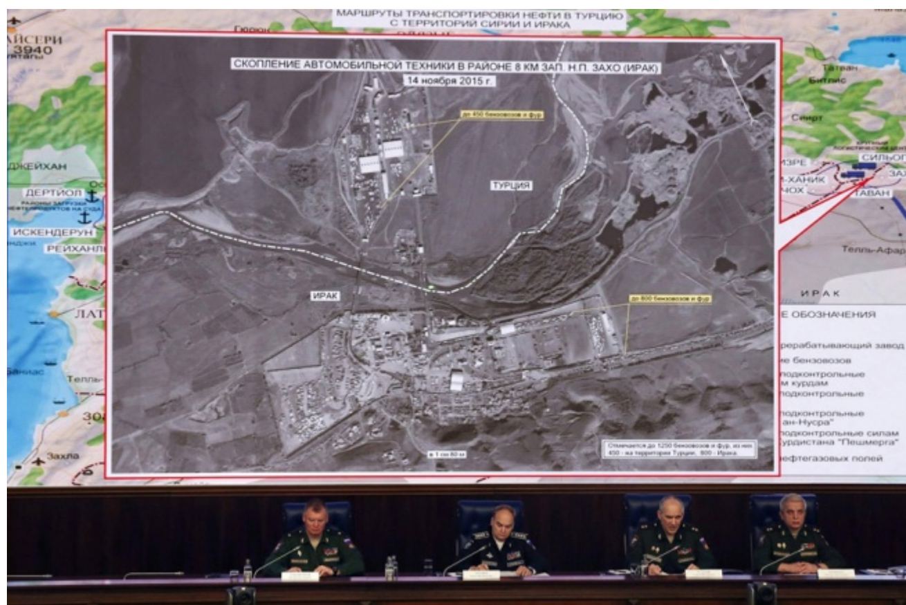
Conferenza stampa del viceministro della difesa russo Anatoly Antonov

In seguito all'abbattimento di un velivolo dell'aviazione militare russa al confine tra Siria e Turchia, i rapporti tra Russia e Turchia si sono deteriorati. Il presidente della Federazione Russa Putin accusa il presidente del governo turco Erdoğan di acquistare petrolio a basso costo dall'Isis. La Turchia è "il consumatore principale di questo petrolio rubato ai proprietari legittimi della Siria e dell'Iraq", ha comunicato in una conferenza stampa il vice ministro russo della Difesa Anatoly Antonov, aggiungendo che il presidente Erdoğan e la sua famiglia sono direttamente coinvolti in questa attività criminale. L'attività estrattiva, che costituisce la maggiore fonte di finanziamento dell'Isis, oltre ad avere un rilievo economico ne ha anche uno simbolico.