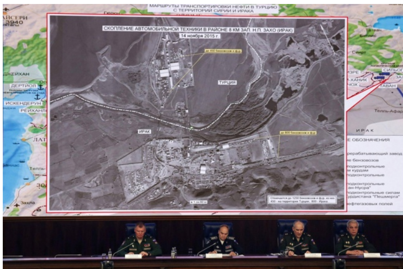
Conferenza stampa del viceministro della difesa russo Anatoly Antonov

In seguito all'abbattimento di un velivolo dell'aviazione militare russa al confine tra Siria e Turchia, i rapporti tra Russia e Turchia si sono deteriorati. Il presidente della Federazione Russa Putin accusa il presidente del governo turco Erdoğan di acquistare petrolio a basso costo dall'Isis. La Turchia è "il consumatore principale di questo petrolio rubato ai proprietari legittimi della Siria e dell'Iraq", ha comunicato in una conferenza stampa il vice ministro russo della Difesa Anatoly Antonov, aggiungendo che il presidente Erdoğan e la sua famiglia sono direttamente coinvolti in questa attività criminale. L'attività estrattiva, che costituisce la maggiore fonte di finanziamento dell'Isis, oltre ad avere un rilievo economico ne ha anche uno simbolico.