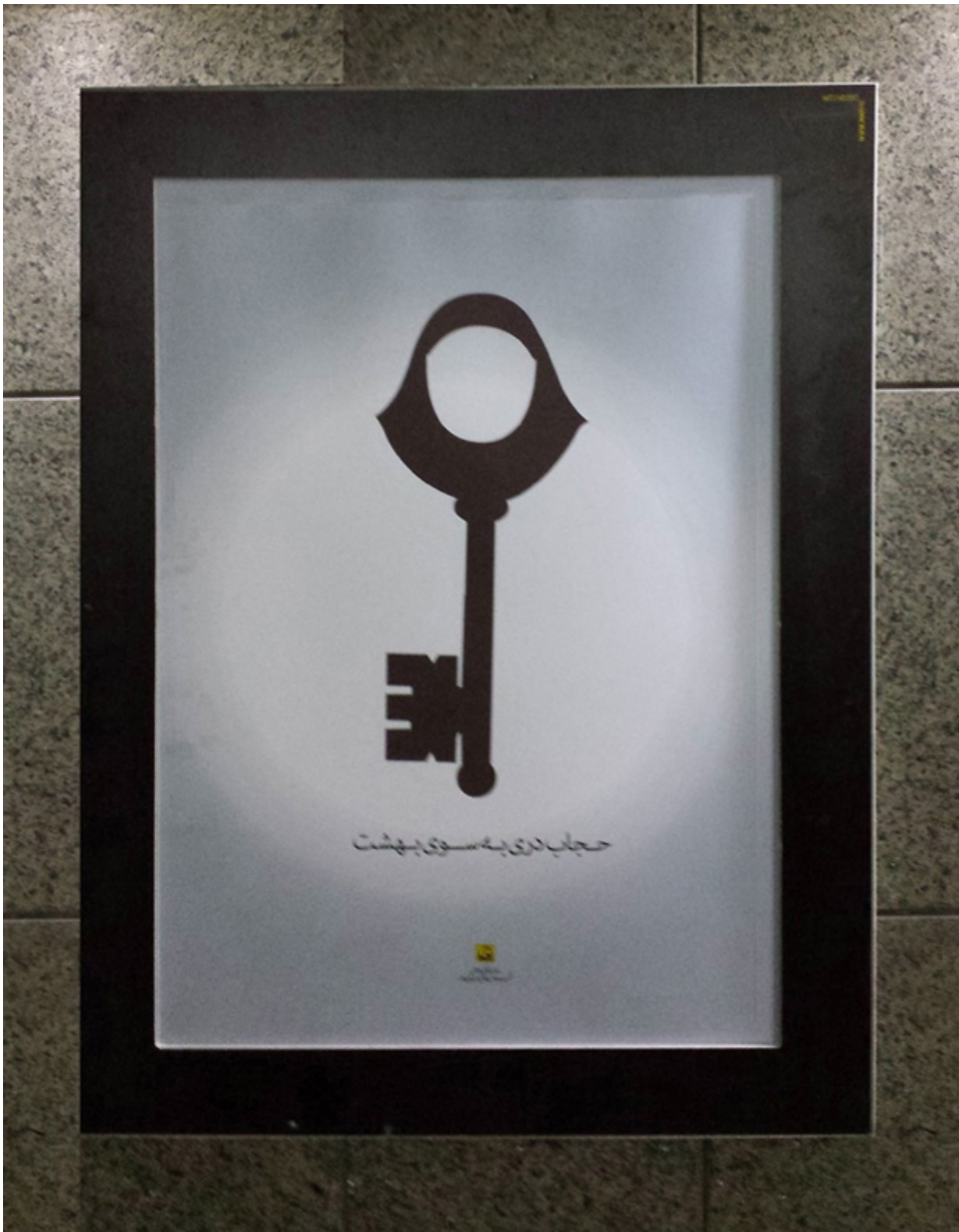
Manifesti di propaganda ideologica affissi nella metropolitana di Teheran

[Traduzioni dal farsi: i primi due da sinistra in alto: "Ogni secondo sono venduti nel mondo 22 rossetti!"; a seguire: "Non diventiamo l'esca con la quale satana intrappola gli uomini!"; "Hijab: una porta verso il paradiso".]