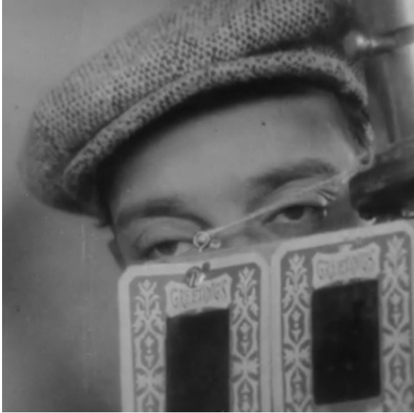
Dall'alto, da sinistra a destra: "Neighbors" (1920); "The Haunted House" (1921); "The Navigator" (1924); "The Cameraman" (1928)