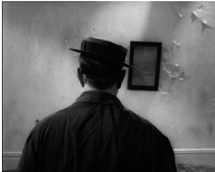
Da sinistra: Immagine pubblicitaria (1927 ca.); "Film", di Alan Schneider (1965)

Berkeley o non Berkeley, la figura di Keaton vista di spalle possiede una indubbia forza iconica. Già nel 1927, in occasione del suo passaggio alla United Artists, viene diffusa un'immagine pubblicitaria che lo ritrae appunto di schiena. Prima ancora, nel 1917, era stato lo stesso attore, a debuttare in questo modo sul grande schermo, nei due rulli di Roscoe Arbuckle The Butcher Boy .