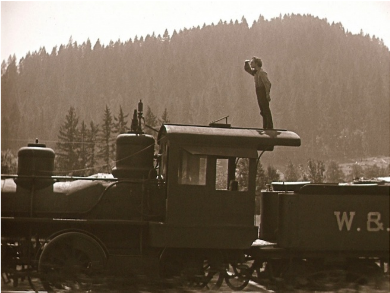
"The General" (1926)

Questa dialettica tra fisicità concreta e fisicità astratta si ripresenta continuamente. Basta un gesto, un'occhiata, una svolta qualsiasi nel racconto. In The General è sufficiente che Buster porti la mano agli occhi, a mo' di visiera per scrutare l'orizzonte, o che si prenda la faccia in mano con aria preoccupata. Per un istante, con un gesto che non è nemmeno una gag, l'intero film (l'inseguimento ferroviario, la ragazza in pericolo, la Guerra di Secessione) viene messo come fra parentesi, relegato in secondo piano. Rimane soltanto quel corpo, il corpo di Buster, piatto e immateriale come una gif avanti lettera.