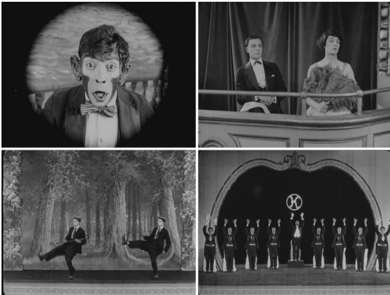
“The Playhouse” (1921)

d'altra parte non consisteva proprio in quello il suo essere “buster”, il fenomeno?