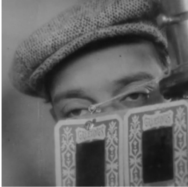
Dall'alto, da sinistra a destra: "Neighbors" (1920); "The Haunted House" (1921); "The Navigator" (1924); "The Cameraman" (1928)