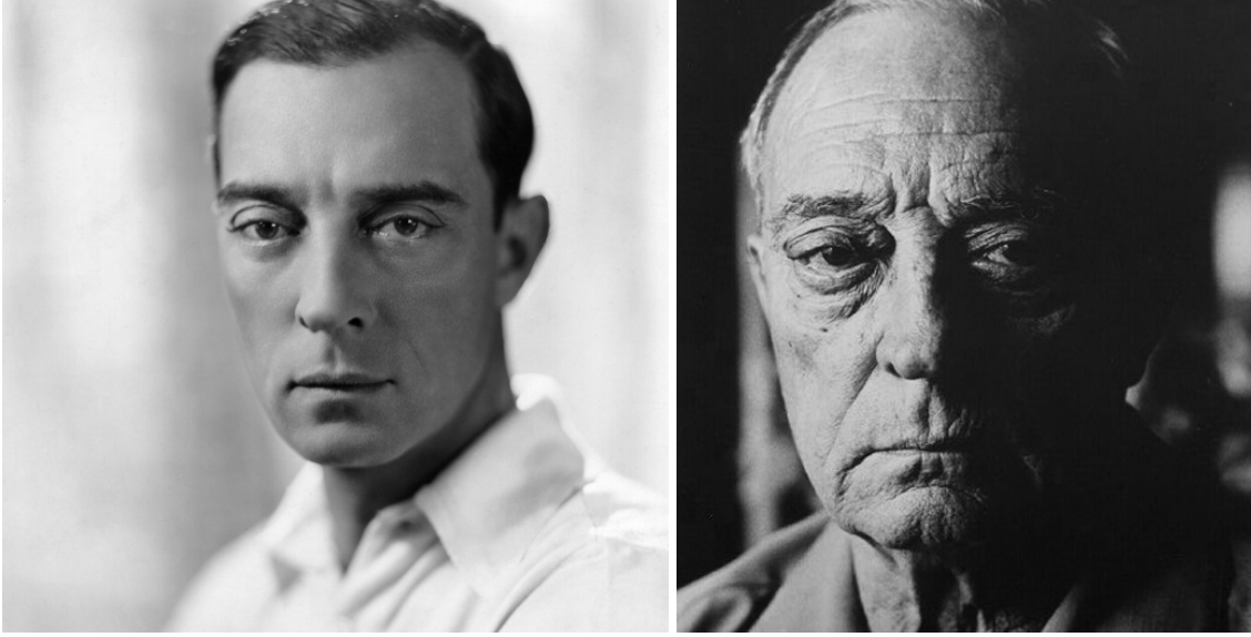
Keaton nel 1930 e nel 1965

A proposito di seduzione, vale la pena di sottolineare un aspetto del volto keatoniano sul quale in pochi si sono soffermati: la bellezza . (Prima o poi bisognerà che qualcuno parli della bellezza dei comici: di Chaplin, naturalmente, ma anche di Harold Lloyd, di Stan Laurel o – perché no? – anche di Oliver Hardy). Può sembrare una provocazione, ma le testimonianze non mancano. James Agee scrisse che la faccia di Keaton «rivaleggiava quasi con quella di Lincoln come archetipo americano, era inquietante, attraente, quasi bella» (l'interessato commentò: «Non riesco a immaginare come avrebbe preso questa affermazione il grande Lincoln, io ne fui molto contento»); mentre Louise Brooks la definì molto più semplicemente «il più bel volto d'uomo che abbia mai conosciuto». Una bellezza che non è solo l' appeal del divo hollywoodiano (in alcune immagini degli anni Venti sfiora persino il fascino androgino d'un Valentino), ma è qualcosa di più. Lo dimostrano i ritratti del Keaton anziano. Ora che il glamour ha ceduto il posto alle rughe, alle pieghe amare, alle borse profonde sotto gli occhi liquidi, quel volto acquisisce una ieratica grandezza, un “sublime naturale” non lontano da quello di certe statue antiche (preveggenze, Cecchi l'associava alle «terracotte azteche» e ai «basalti egizî»).