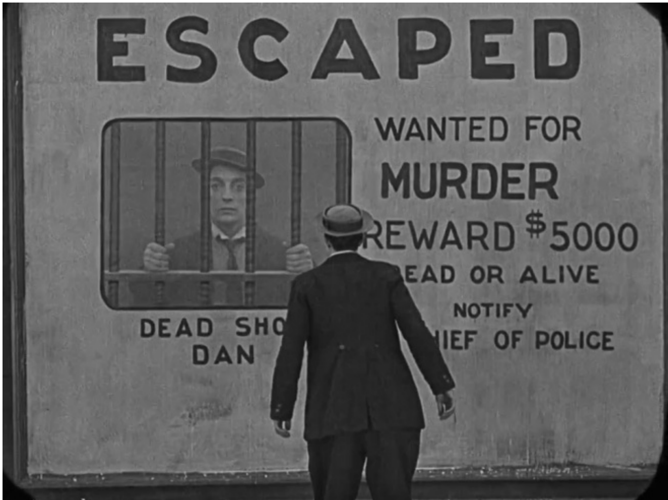
“The Goat” (1921)

Rispetto a lui, Keaton è quasi una presenza defilata. Essere al centro dell'attenzione sembra infastidirlo, e probabilmente si sottrarrebbe volentieri all'obbiettivo. Semplificando, si potrebbe dire che mentre Chaplin gioca sull'eccesso di presenza , Keaton punta su una altrettanto eccessiva assenza . Del resto, nel suo primo film come autore completo, The High Sign , viene presentato da questa didascalia: «Our Hero come from Nowhere – he wasn't going Anywhere and got kicked off Somewhere».