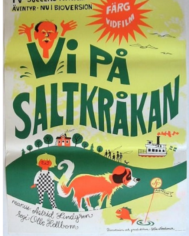
Da sinistra: Astrid Lindgren; Locandina per la serie televisiva Vacanze all'isola dei gabbiani, 1964

Astrid Lindgren spiegò in diverse occasioni che il giacimento a cui attinse per tutta la vita i suoi personaggi e le sue storie fu l'infanzia con la sua grande famiglia, nella fattoria di Näs, a Vimmerby, nella contea dello Småland, di proprietà dei genitori, dove nacque nel 1907, e crebbe con i suoi fratelli rispettata e amata, con mansioni, compiti e doveri precisi, ma anche con la possibilità di godere di tutta la libertà del gioco in un ambiente naturale che dai suoi ricordi doveva essere una specie di paradiso terrestre. Una proprietà, quella di Näs, a cui la scrittrice fu legatissima, di cui si prese cura per tutta la vita, e in cui non più bambina, trascorse lunghi periodi di vacanza insieme ai fratelli, alle sorelle, ai figli e ai nipoti.