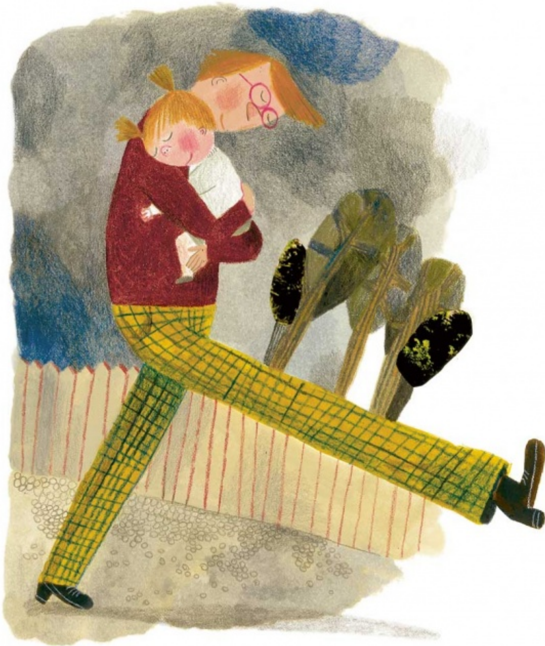
Illustrazione di Beatrice Alemagna per Lotta combinaguai

Nello stesso modo i genitori di Lotta non vanno a riprendersi la figlia, pur sapendo bene dove si trovi. In sostanza, questi adulti non fanno confusione fra controllo e accudimento, responsabilità e imposizione, evitando che tutta la questione si riduca a una faccenda fra 'grandi'. Lotta, al contrario, è lasciata libera di sperimentare la sua decisione, di andare fino in fondo all'avventura. Una volta stabilito che la situazione non presenta pericoli, gli adulti si fanno da parte e lasciano che sia lei a riflettere sulle conseguenze della sua scelta. Le permettono, cioè, di fare un'esperienza.