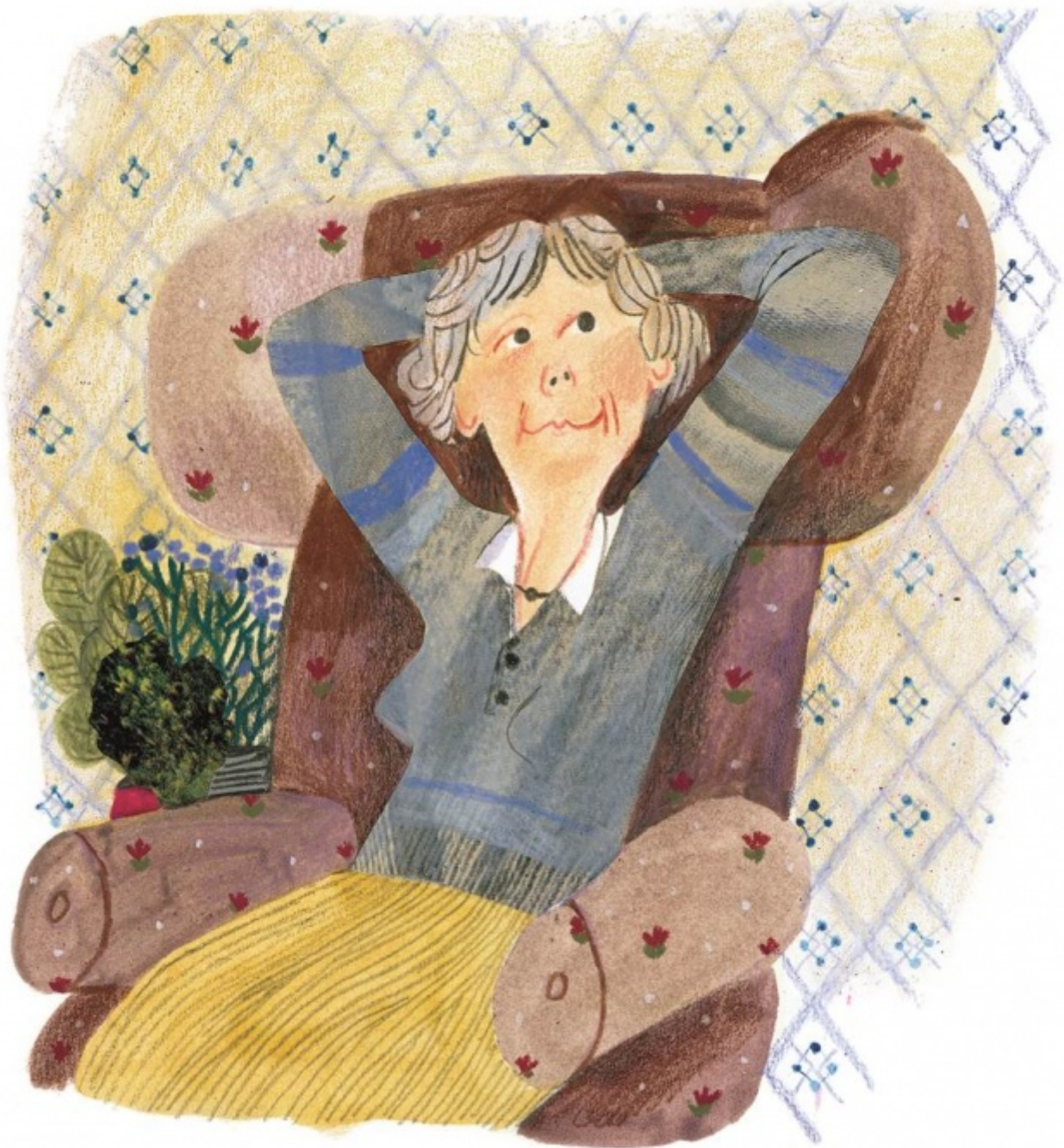
Illustrazione di Beatrice Alemagna per Lotta combinaguai

Una figura esemplare in questo senso, è quella della vicina di casa, la signora Berg, di Lotta combinaguai , protagonista di un episodio illuminante. Una mattina, Lotta, svegliatasi capricciosa e antipatica, dopo aver litigato con la mamma e averle nascosto di avere distrutto un maglioncino a forciciate, decide di scappare di casa (o meglio “di traslocare” perché scappare è una cosa da piccoli). La nuova casa scelta da Lotta è quella della vicina, signora Berg, che in una illustrazione Beatrice Alemagna ritrae identica ad Astrid Lindgren. La signora Berg accoglie Lotta senza far troppe domande, le fa fare merenda e infine la accompagna in