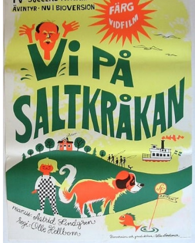
Da sinistra: Astrid Lindgren; Locandina per la serie televisiva Vacanze all'isola dei gabbiani, 1964

Astrid Lindgren spiegò in diverse occasioni che il giacimento a cui attinse per tutta la vita i suoi personaggi e le sue storie fu l'infanzia con la sua grande famiglia, nella fattoria di Näs, a Vimmerby, nella contea dello Småland, di proprietà dei genitori, dove nacque nel 1907, e crebbe con i suoi fratelli rispettata e amata, con mansioni, compiti e doveri precisi, ma anche con la possibilità di godere di tutta la libertà del gioco in un ambiente naturale che dai suoi ricordi doveva essere una specie di paradiso terrestre. Una proprietà, quella di Näs, a cui la scrittrice fu legatissima, di cui si prese cura per tutta la vita, e in cui non più bambina, trascorse lunghi periodi di vacanza insieme ai fratelli, alle sorelle, ai figli e ai nipoti.