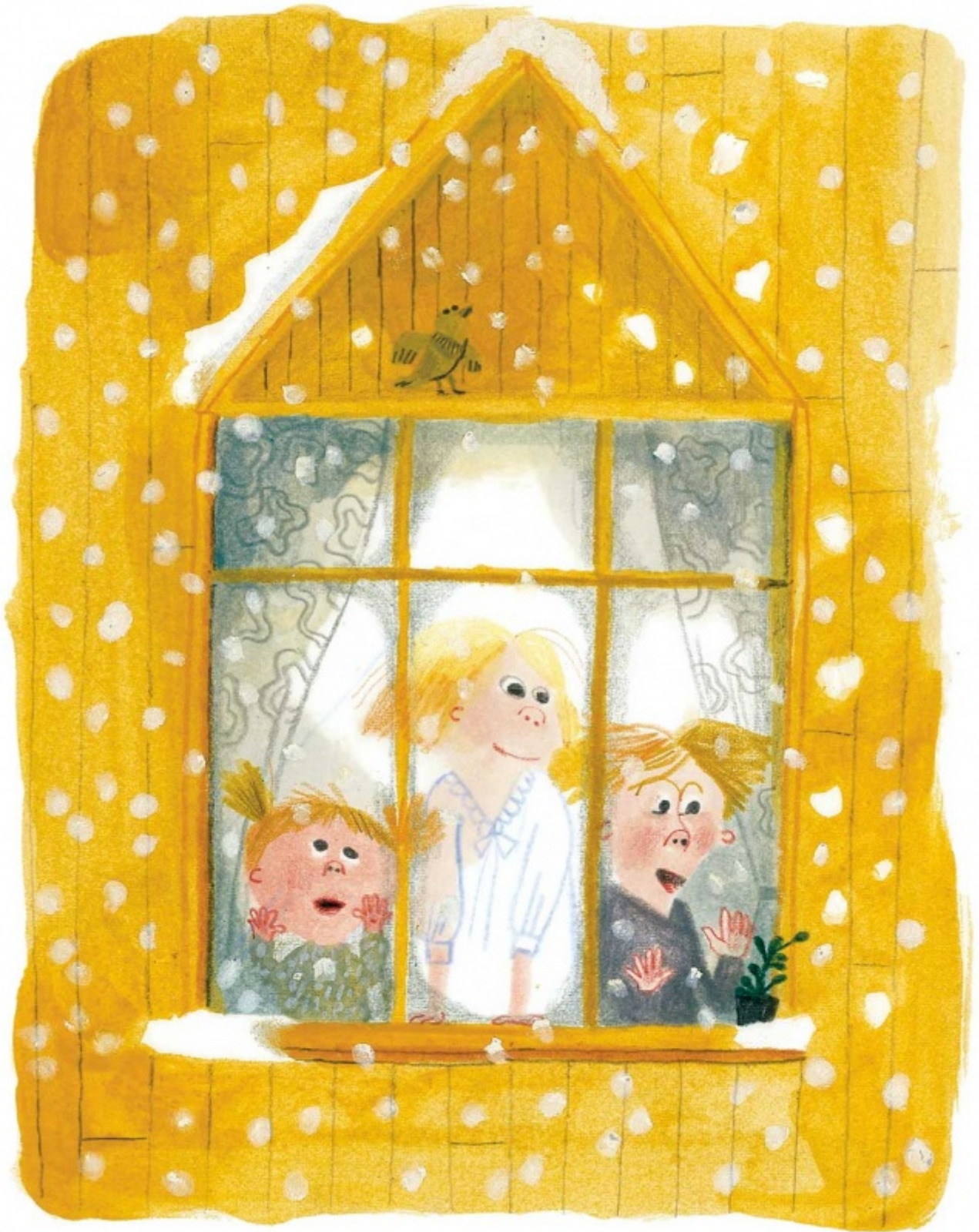
Illustrazione di Beatrice Alemagna per Lotta combinaguai