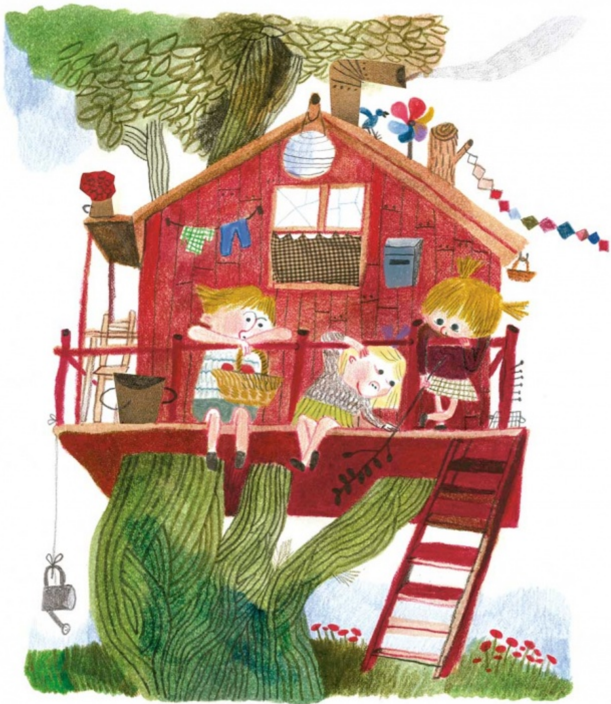
Illustrazione di Beatrice Alemagna per Lotta combinaguai

Ronja si smarca dagli agi e dalla sicurezza della propria casa, richiamata dalla potenza della vita avventurosa nella foresta, senza sottrarsi ad alcuna delle sue insidie. Rasmus scopre accanto a un vagabondo lo splendore della vita nomade e precaria, del sonno sotto la volta stellata, senza un tetto sulla testa. I ragazzi