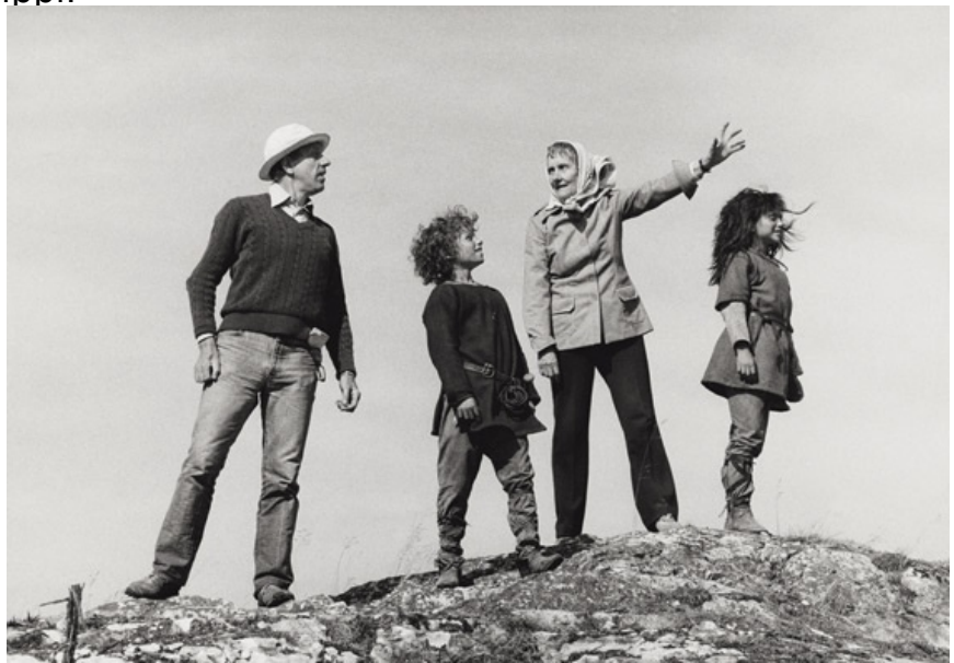
Da sinistra: Pippi calzelunghe, serie tv, 1969; Astrid Lindgren sul set del film Ronja 1984