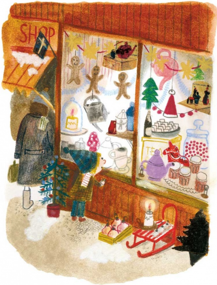
Illustrazione di Beatrice Alemagna per Lotta combinaguai

Lotta fa parte di quella grande famiglia infantile che nacque dal genio di una delle più grandi autrici per bambini di ogni tempo, che cambiò in tutto il mondo (poiché in tutto il mondo i suoi libri sono tradotti) il modo di vedere e raccontare l'infanzia.