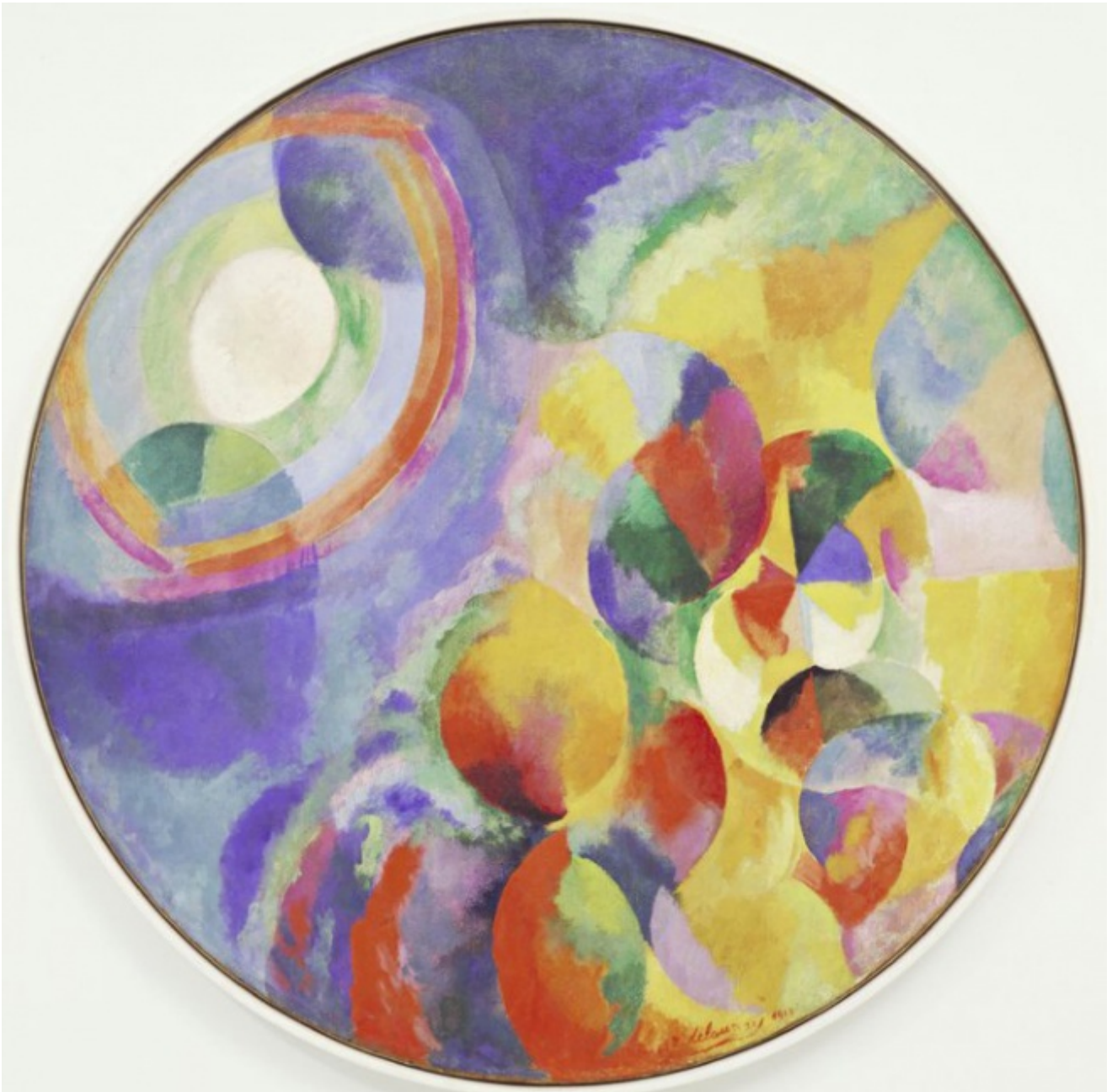
Robert Delaunay, Contrasti Simultanei, Sole, Luna, 1913

Il termine 'qualità terziarie' risale addirittura a John Locke. La sua classificazione parte dalle qualità primarie, le qualità inseparabili dai corpi: la solidità, l'estensione, la figura, il numero, il movimento e la quiete; esse sono calcolabili, oggettive e rendono possibile la scienza matematica della natura, la fisica di Galileo e Newton. Le qualità secondarie sono invece quelle percepibili da un solo organo di senso: il sapore, l'odore e, appunto, il colore; sono soggettive e quindi escluse dalla trattazione scientifica, a meno che non se ne trovi un aspetto misurabile. Il che in effetti avvenne con l'esperimento newtoniano della scomposizione della luce attraverso lo spettro, ciò che permise a Newton di legare