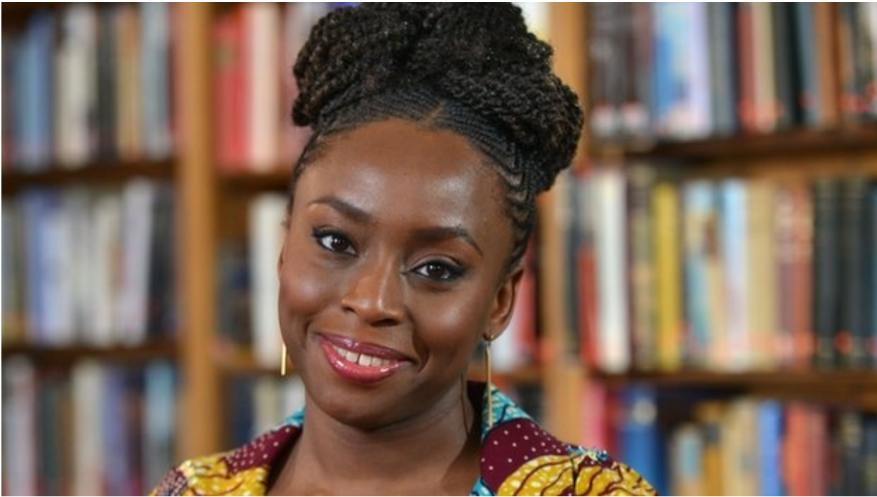
Chimamanda Ngozi Adichie

Americanah ha ottenuto il National Book Critics Circle Award e molte altre menzioni, tra cui quella di uno dei cinque migliori romanzi del 2013 sul New York Times.