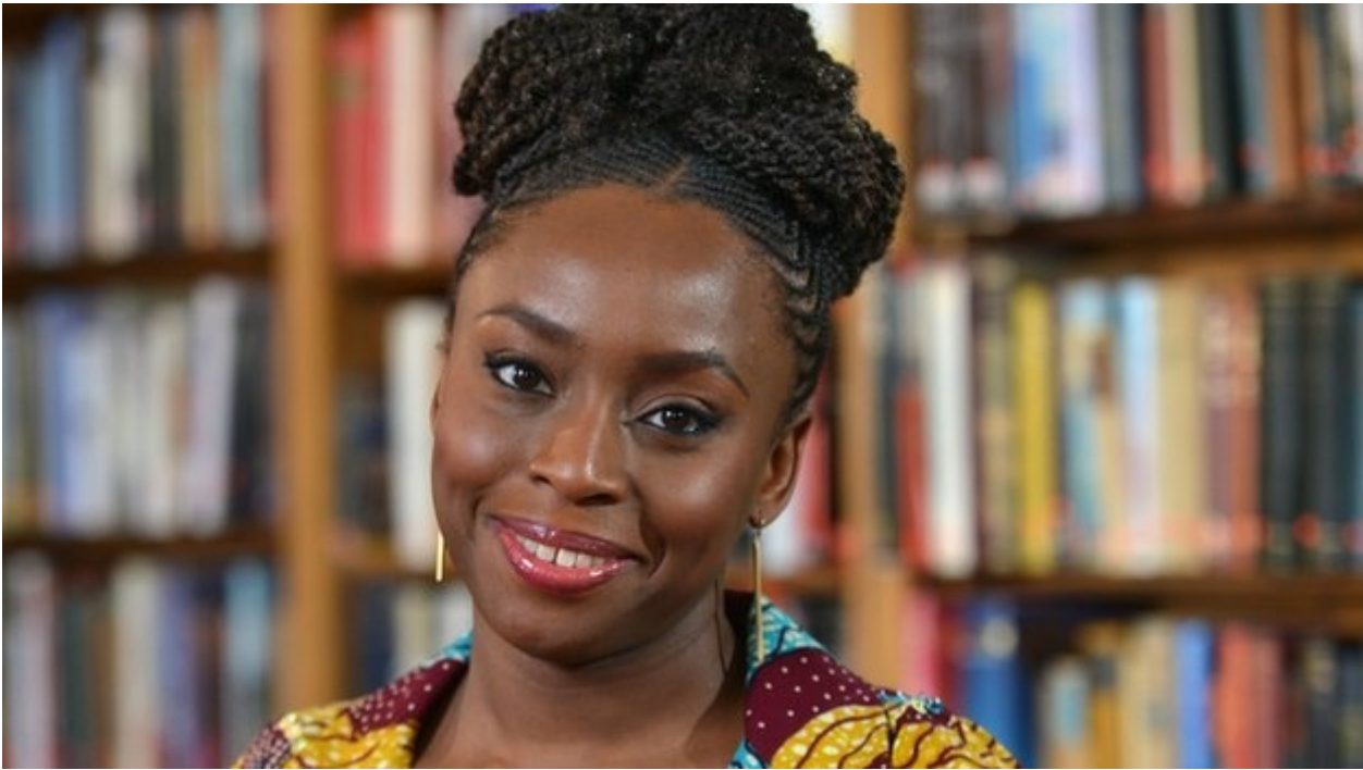
Chimamanda Ngozi Adichie

Americanah ha ottenuto il National Book Critics Circle Award e molte altre menzioni, tra cui quella di uno dei cinque migliori romanzi del 2013 sul New York Times.