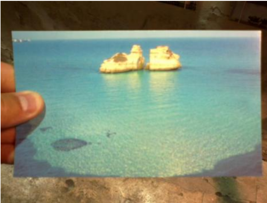
Due sorelle a Melendugno