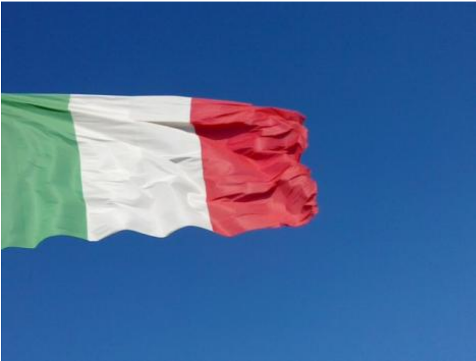
Santa Maria di Leuca. De finibus terrae