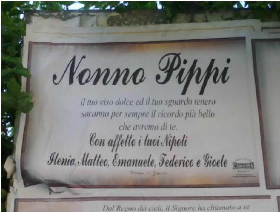
Con affetto i tuoi nipoti