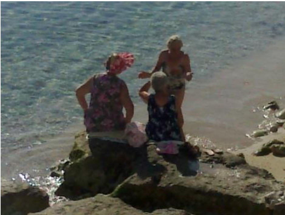
Care signore di Monopoli