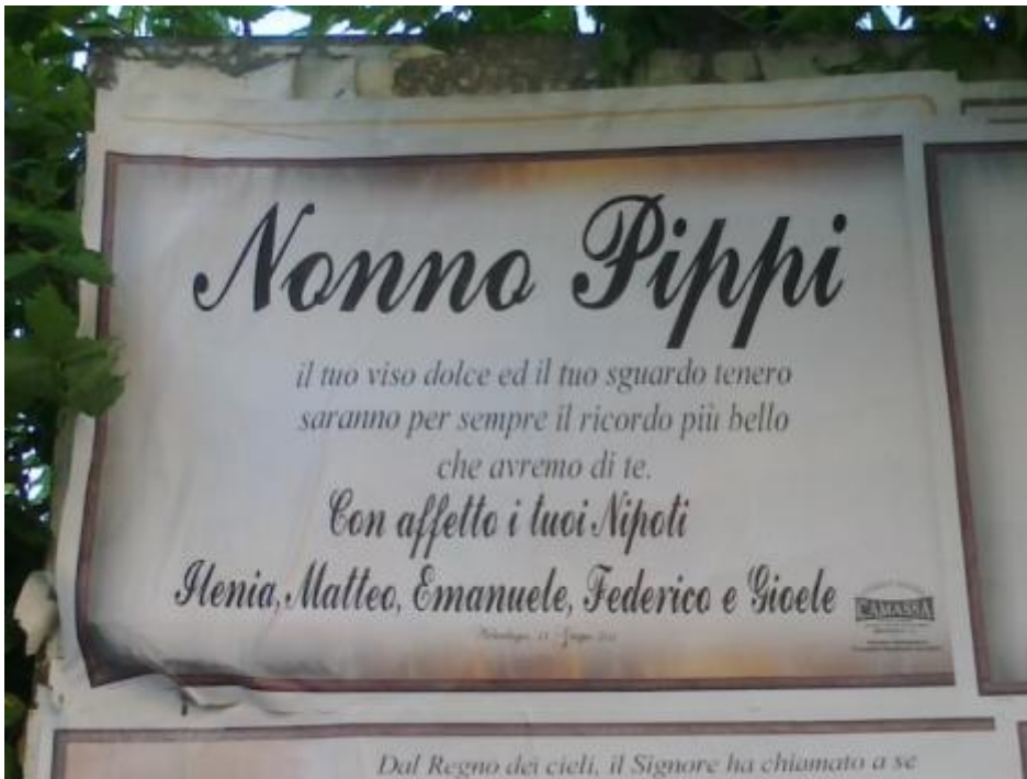
Con affetto i tuoi nipoti