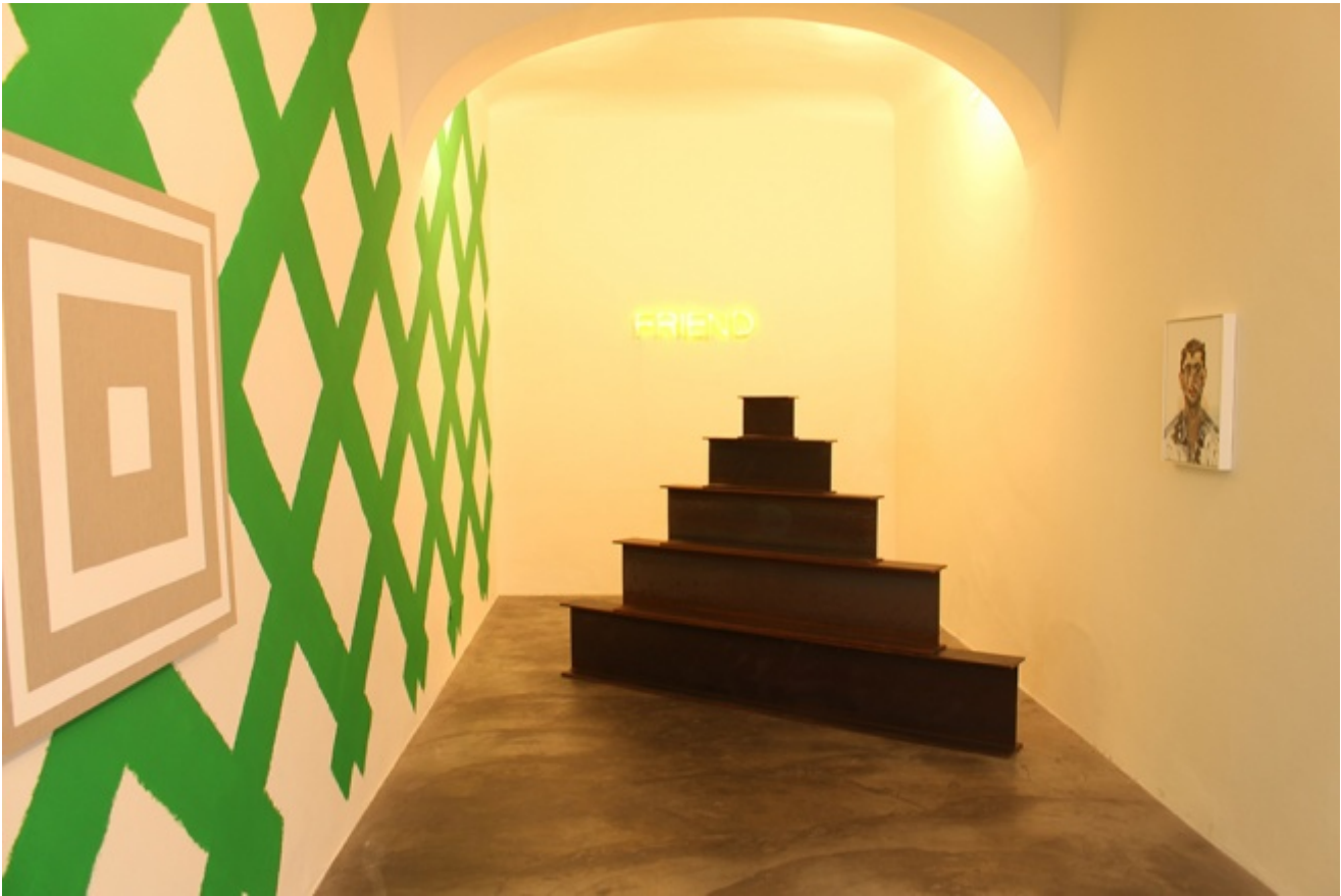
Veduta dell'allestimento della prima sala di BASE / Progetti per l'arte in occasione della mostra dedicata a Martin Creed