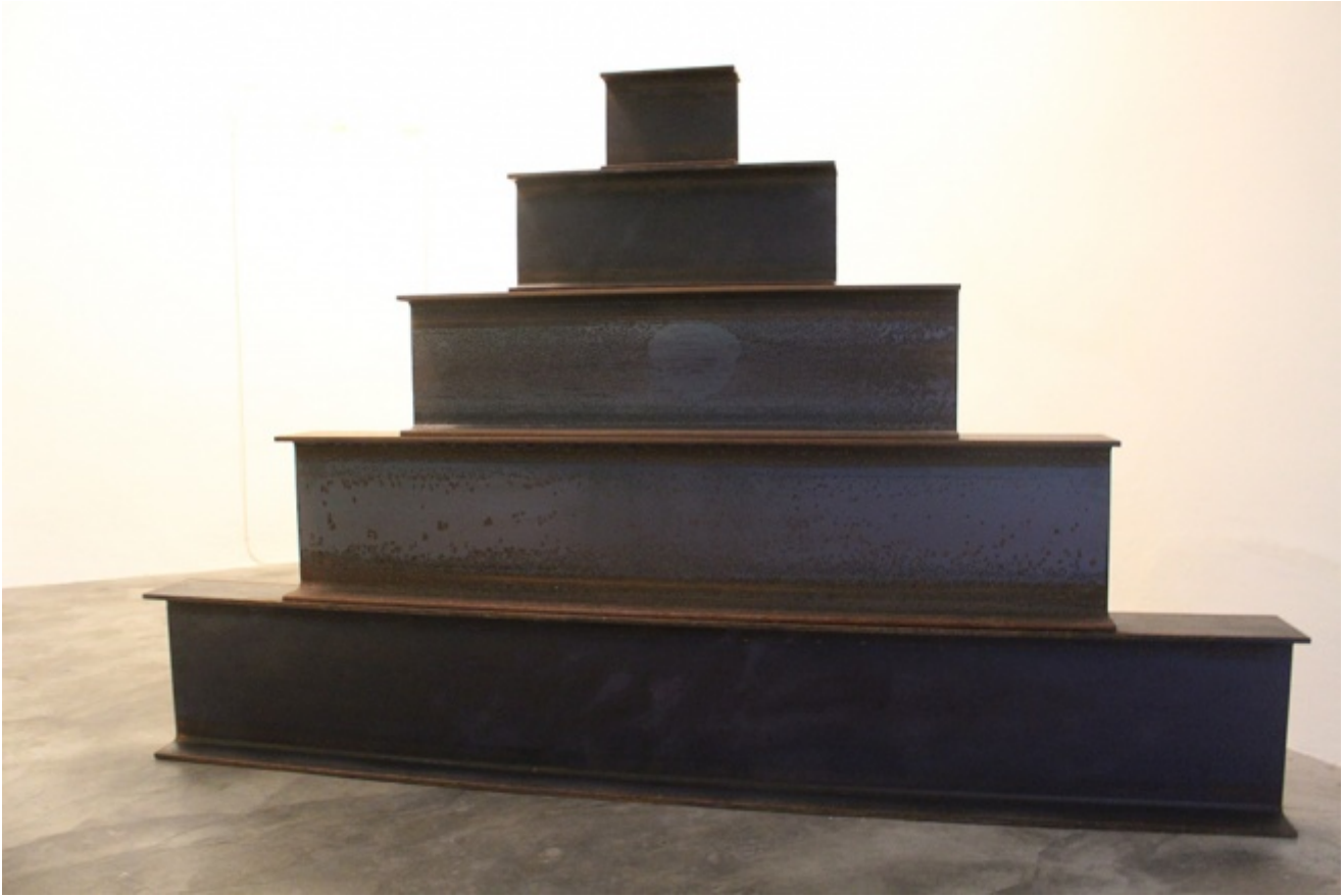
Martin Creed, Work No. 1638, 2013

Altra opera che Creed ha deciso di ripresentare per la mostra a Base è Work No. 1638 , del 2013, una struttura modulare a ziggurat , costituita da cinque longarine in ferro che si rastremano progressivamente verso l'alto: posta in maniera obliqua all'interno degli spazi espositivi, l'opera, nella sua elementarità e definizione, da una parte si caratterizza come realtà segnica autonoma e autoevidente, dall'altra come elemento di rottura, ma d'interazione, nella linearità del percorso espositivo. La ripetizione dei motivi romboidali del Wall Painting sembrano infine accompagnare chi guarda sino alla parete di fondo della galleria, dove il punto di fuga viene a coincidere con Work No. 672, Friend , un'installazione al neon del 2007, tanto fisica quanto rarefatta, tanto ermetica quanto evasiva, tesa a suscitare significati senza mai affermarli: segno e simbolo di quella che oggi viene identificata come estetica relazionale , il cui substrato generativo, per citare Nicolas Bourriaud, resta l'intersoggettività. La mostra, presso gli spazi della vivida realtà di BASE in San Niccolò a Firenze, sarà visitabile ancora per qualche settimana, oltre la data ufficiale di chiusura.