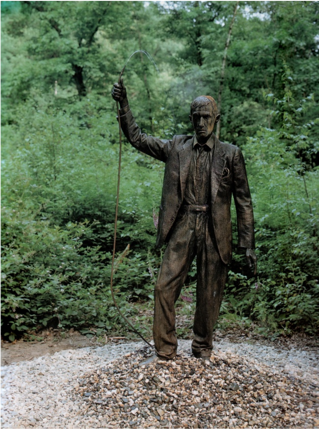
Alighiero Boetti, Autoritratto (1993)

Ovvero, e solo in apparenza per serendipity , una resa dei conti al tempo stesso esistenziale e letteraria con i diversi io che hanno nel tempo abitato, alcuni simultaneamente, altri allo stato latente, la vita dell'autore: studente d'accademia di belle arti, aspirante pittore, e assistente di altri artisti, gallerista, critico d'arte, curatore, e finalmente scrittore. Una vicenda che il lettore è chiamato oggi a osservare come una di quelle stratigrafie usate dagli archeologi