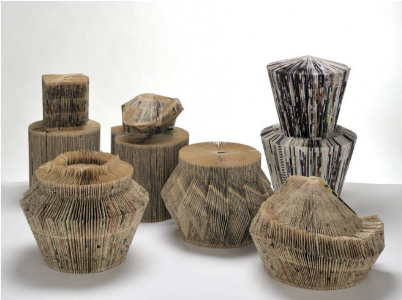
Stefano Arienti, Senza Titolo Turbine (1990)

passa simbolicamente attraverso la morte e la trasfigurazione delle personalità, appare, anziché come un rassicurante, definitivo approdo, come l'apertura di una ulteriore, non meno problematica stagione sperimentale, come un agone in cui riappare in filigrana, è ancora Cortellessa a scriverlo nella sua postfazione, la secolare, fraticida rivalità, tra la penna e il pennello, tra pittori e scrittori.