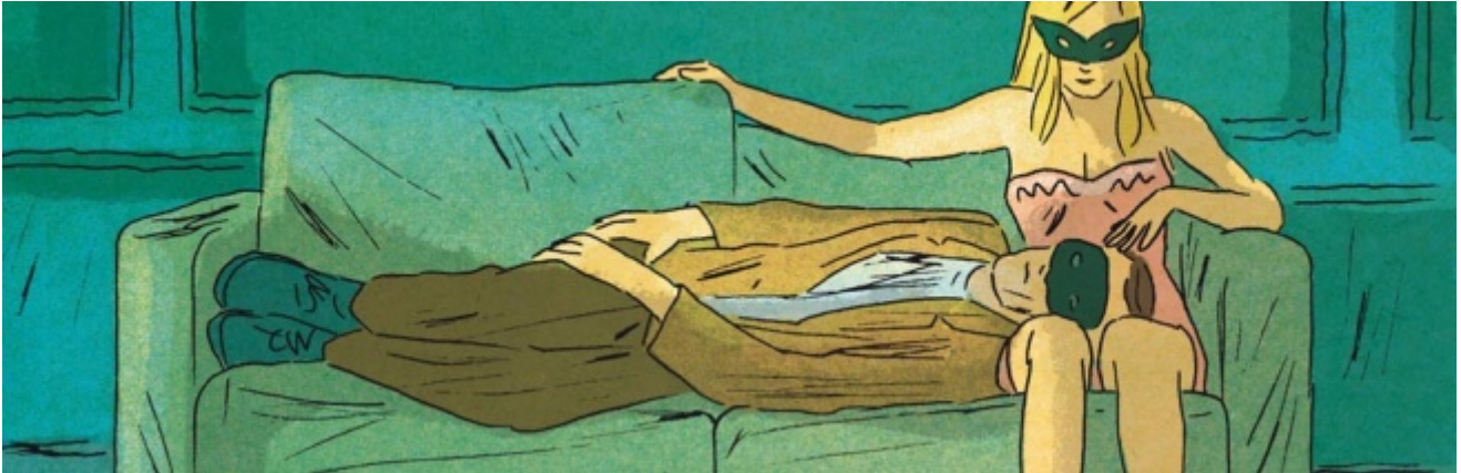
Ruppert & Mulot, La tecnica del perineo

Gli scenari tratteggiati da R&M, legati a filo doppio all'universo di Moebius, a poco a poco però contagiano la realtà, la trasformano, in un crescendo che è quello vissuto dai personaggi e dai loro sentimenti. Solo al termine di questo viaggio iniziatico del desiderio, i due amanti staranno sdraiati su un letto, fianco a fianco, e JH, artista in crisi perso nella costruzione di opere monumentali e malriuscite, troverà l'ispirazione per dare sfogo attraverso l'arte al proprio mondo interiore.