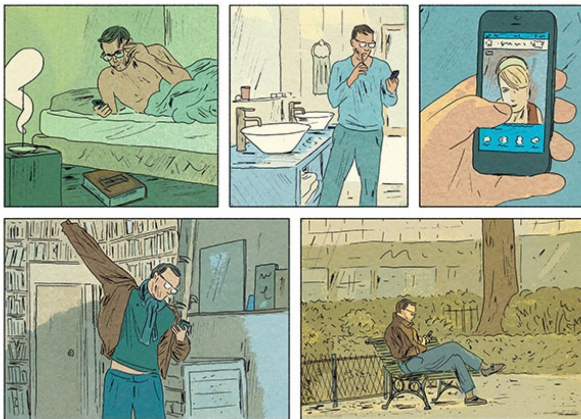
Ruppert & Mulot, La tecnica del perineo

vista assolutamente da recuperare il loro magnifico Irene e i clochard , uno dei pochi loro titoli presenti in traduzione italiana edito in Italia da Canicola).