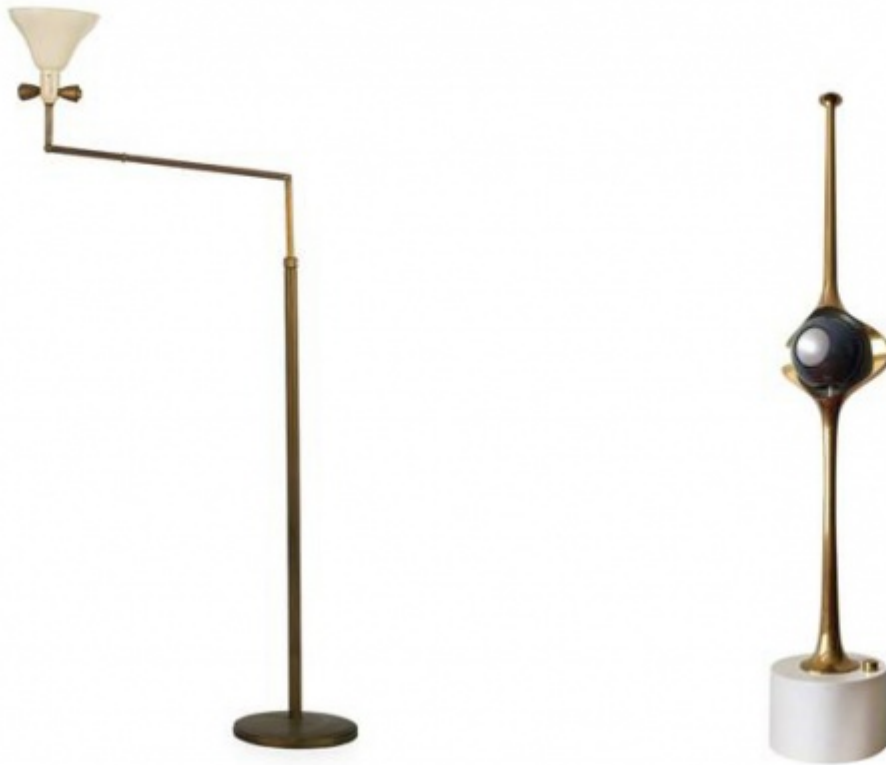
Angelo Lelii, Lampada Tris (1946) e lampada Cobra (1965).

Dopo la forzata interruzione del periodo bellico, nel 1946 su “I Quaderni di Domus” compare la sua prima pubblicità che presenta la “nuova lampada Tris”, in ottone e ghisa, orientabile con tre diversi snodi