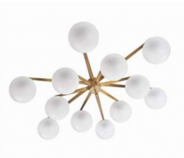
Angelo Lelii, Lampada Triennale (1947) e lampadario Stella (1950).

Obliato ancor oggi dalla critica ufficiale – che gli ha sempre preferito il suo antagonista (tipo Coppi-Bartali), il milanese Gino Sarfatti di Arteluce – Angelo Lelii deve la sua riscoperta in anni recenti non già al mondo della cultura bensì a quello delle aste, in particolare oltralpine.